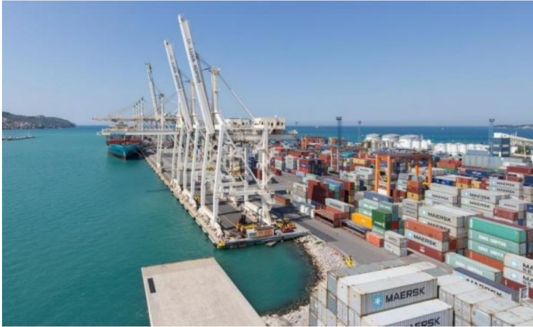
Slika 2. Položaj luke Koper u Mediteranskom i Baltik-Jadran prometnom koridoru