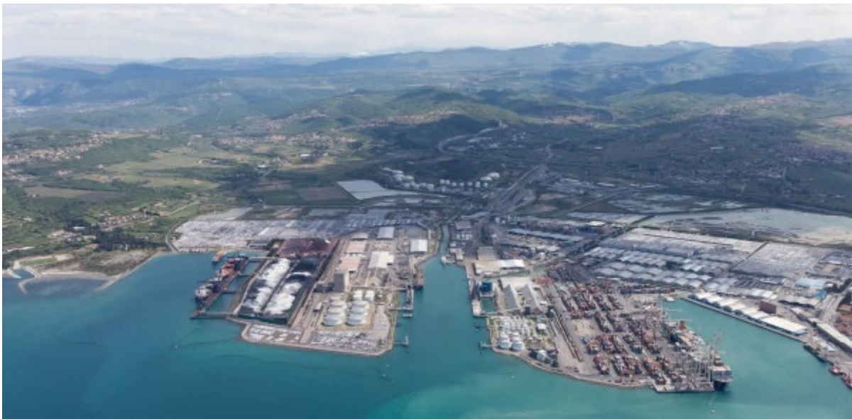
Slika 1. Luka Kopar

Luka Kopar smještena je na sjeveru Jadrana te je ujedno i najveća pomorska luka Slovenije, a isto tako je i jedna od luka koja ima najveći prometni teret na Jadranskom moru. Luka Kopar predstavlja direktnu konkurenciju Riječkoj luci jer se u posljednjih nekoliko godina vrlo brzo počela razvijati te je veliki broj prometa iz riječke luke preuzela upravo na sebe.