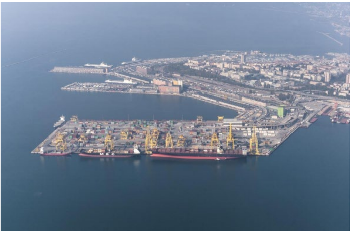
Slika 3. Luka Trst

Luka Trst predstavlja najveću teretnu luku u Italiji koja je smještena na samom sjeveru Italije i na samom sjevernom dijelu Jadranskog mora. Luka Trst osim toga se nalazi i u blizini luke Kopar, te je ona ujedno i najveća luka koja se nalazi na Jadranskom moru. Trst je osim toga i po svojoj površini najveća luka koja je korištena od strane Austrije koja je ujedno i zatvorena kopnom prema izlazu na more.