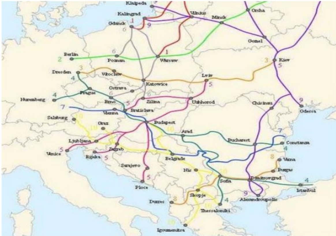
Zemljovid 3. Prometna povezanost luke Rijeka

Prometni pravac za tranziciju na tržište Srbije i Bosne i Hercegovine usmjerava se ka Paneuropskom koridoru X. Pa je tako luka priključena na cestu A7 koja onda ide svojim putem točno iznad samoga grada te se dalje priključuje na cestu E61 koja vodi prema Italiji i Sloveniji (Kos i Brčić, 2010).