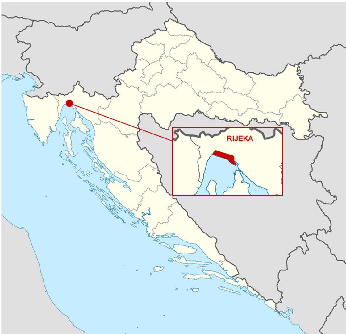
Zemljovid 2. Luka Rijeka

Riječka luka smještena je na sjevernom dijelu Jadranskog mora u Hrvatskoj, točnije na Kvarneru. Luka je okružena sa planinama koje se protežu sa njene istočne strane te je omeđena poluotokom Istra koja joj je smještena na zapadnoj strani. Riječka luka ima izuzetno povoljan geografski položaj iz razloga što ona predstavlja najkraću vezu između sjeverne Europe i sjeverne Afrike, isto tako ona predstavlja najkraću vezu između sjeverne Europe i Sueskog kanala.