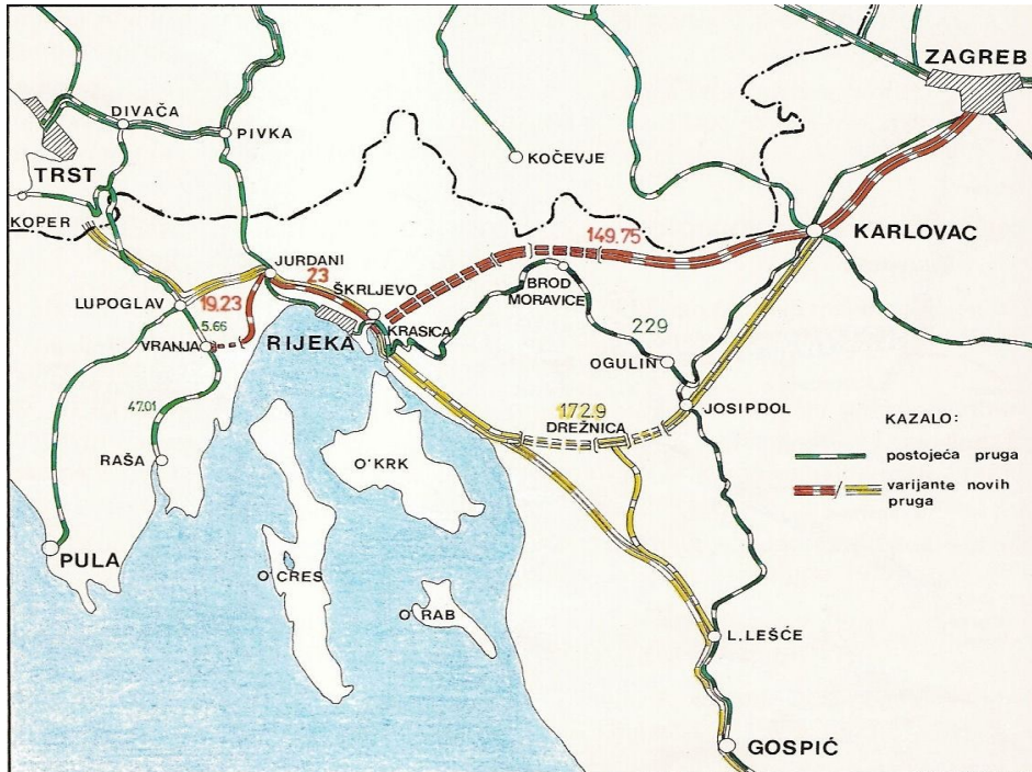
Slika 1. Kupska i Drežnička varijanta nove dvokolosične pruge Zagreb – Rijeka Izvor: Božičević, J.: "Prometna valorizacija Hrvatske", Zagreb 1992., str. 23.

visini najviše približava Kvarnerskom zaljevu, te se na taj način ostvaruje najkraća veza od Zagreba do Rijeke. Trasa bi išla od Karlovca dolinom rijeke Kupe do njenog izvora. Zatim bi prošla tunelom ispod Risnjaka dugim 25 kilometara čime bi se premostila planinska barijera do Krasice, kao najpovoljnije lokacije za krajnji teretni kolodvor nove pruge. Na taj način savladala bi se planinska zapreka koja razdvaja Panonsku nizinu od Jadrana, i to na mjestu gdje se dotiču Alpe s Dinarskim Gorjem. Duljina kupske trase iznosila bi 149,7 km te bi bila 78,9 km kraća u odnosu na postojeću trasu Zagreb – Rijeka. Pruga bi obuhvaćala 22 tunela ukupne duljine 51,73 km i veći broj vijadukata i mostova ukupne duljine 10,12 km. Najviša kota nivelete bila bi na 272 m.n.m. odnosno 564 metra niže od postojeće pruge (836 m.n.m.). Najveći uzdužni nagib iznosio bi sedam promila ( i = 7\% ), minimalni polumjer zavoja bio bi 3000 metara ( R_{\min} = 3000 \text{ m} ) a osovinsko opterećenje pruge bi iznosilo 225 kN.