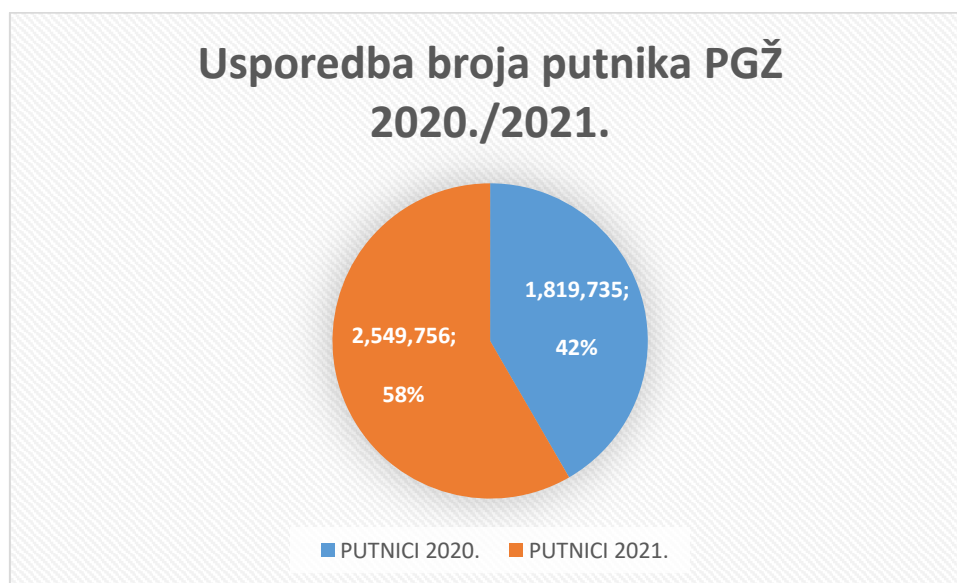
Grafikon 1. Jadrolinija-usporedba broja putnika PGŽ 2020./2021.

Izradio student prema: Agencija za obalni linijski pomorski promet, preuzeto 12.08.2022. sa: http://agencija-zolpp.hr/wp-content/uploads/2022/02/PROMET_PUTNIKA_I_VOZILA_2020-2021.pdf