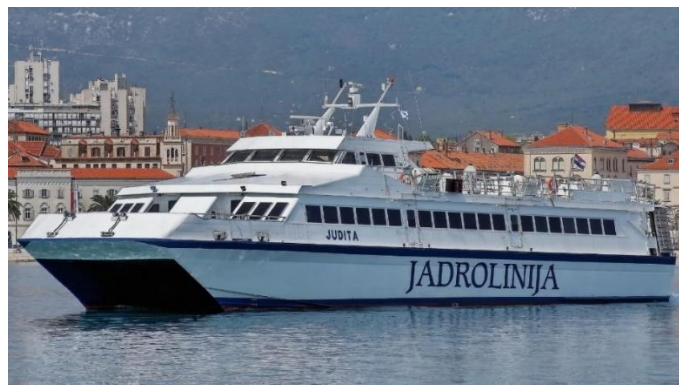
Slika 3. Vrlo brzi putnički brod