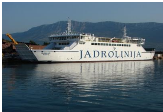
Slika 2. RO-RO putnički brod