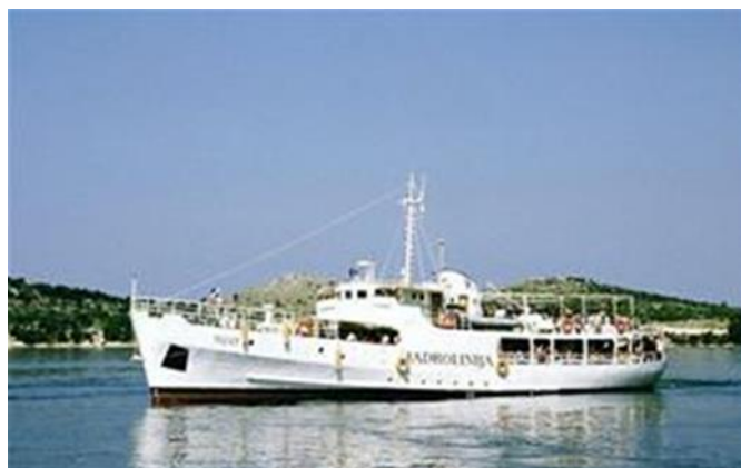
Slika 1. Klasični putnički brod