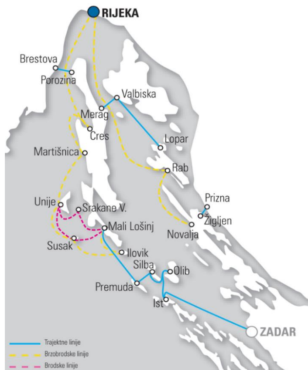
Slika 5. Riječko okružje Jadrolinije