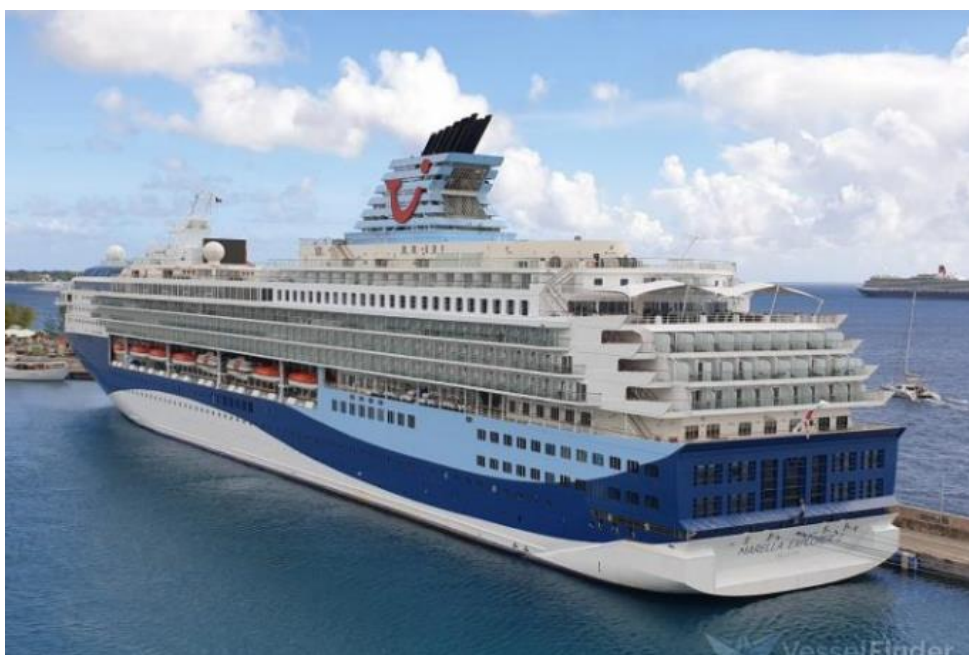
Slika 3. Brod za kružna putovanja