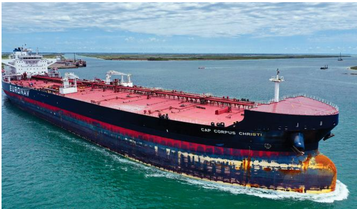
Slika 2. Tankerski brod

-tekuće kemikalije (na primjer amonijak i fosforne kiseline)