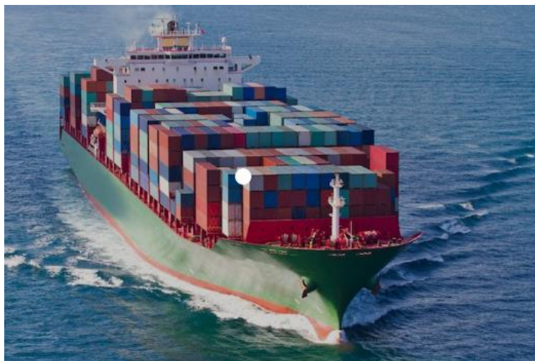
Slika 1. Kontejnerski brod

Do sredine 60-ih godina, brodovi za linijsku plovidbu su većinom bili višenamjenski, s dvije ili više paluba, imali su više skladišta i manje otvore na grotlu te s vlastitim teretnim uređajima za ukrcaj i iskrcaj. Još su se nazivali brodovima za generalni teret. Tada još nisu postojali specijalizirani brodovi za prijevoz pojedinih tereta, a sve je bilo podređeno ukrcaju što veće količine generalnog tereta. Neke verzije višenamjenskih brodova imale su ugrađene rashladne spremnike za voće, tankove za ulje i palube za prijevoz vozila.