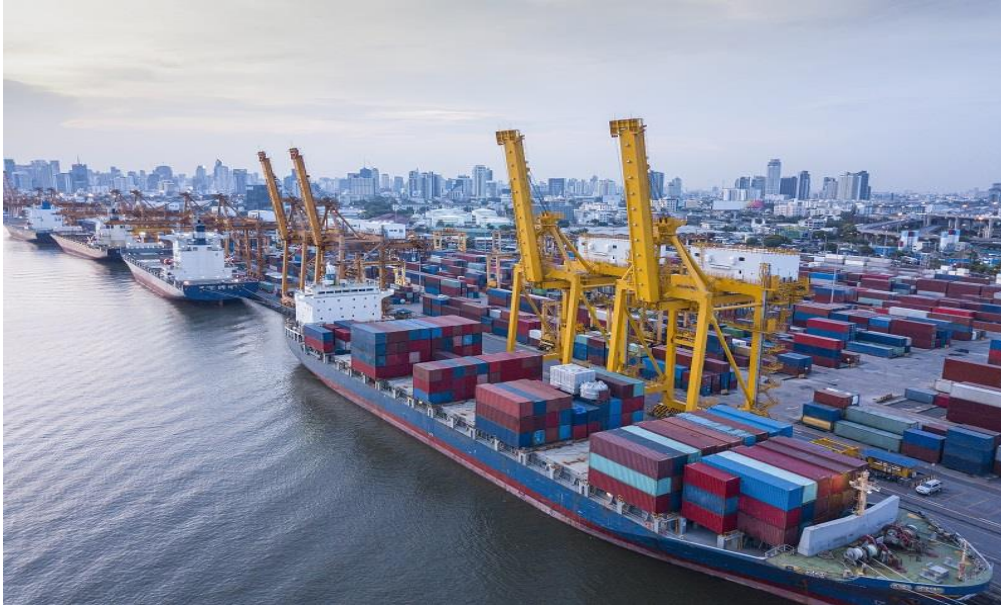
Slika 1. Kontejnerizacija

Nažalost, iako je to najpovoljniji način transporta tereta, isti ostavlja veliku štetu na okoliš u pogledu emisija stakleničkih plinova i onečišćenja mora.