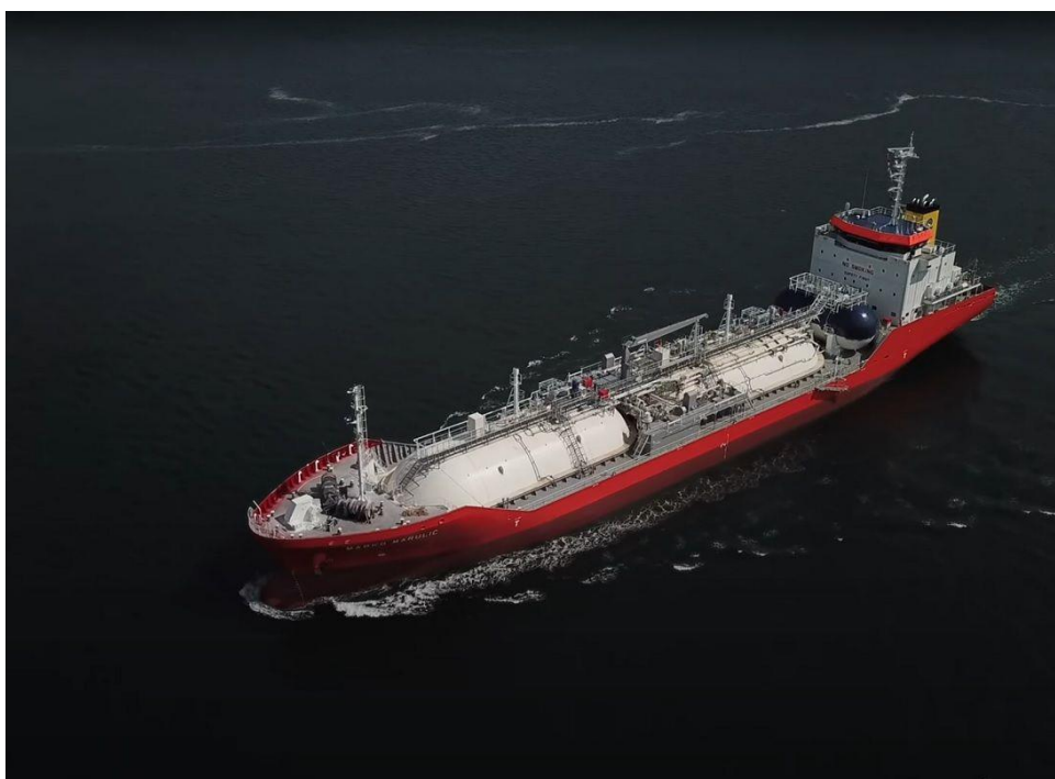
Slika 6. LPG brod „Marko Marulić“

Splitska tvrtka Jadroplov (koja je u većinskom vlasništvu RH) za prijevoz ovakvog tereta od 2022. godine koristi LPG brod „Marko Marulić“, koji je, ujedno, i prvi brod za prijevoz ukapljenog plina pod hrvatskom zastavom.