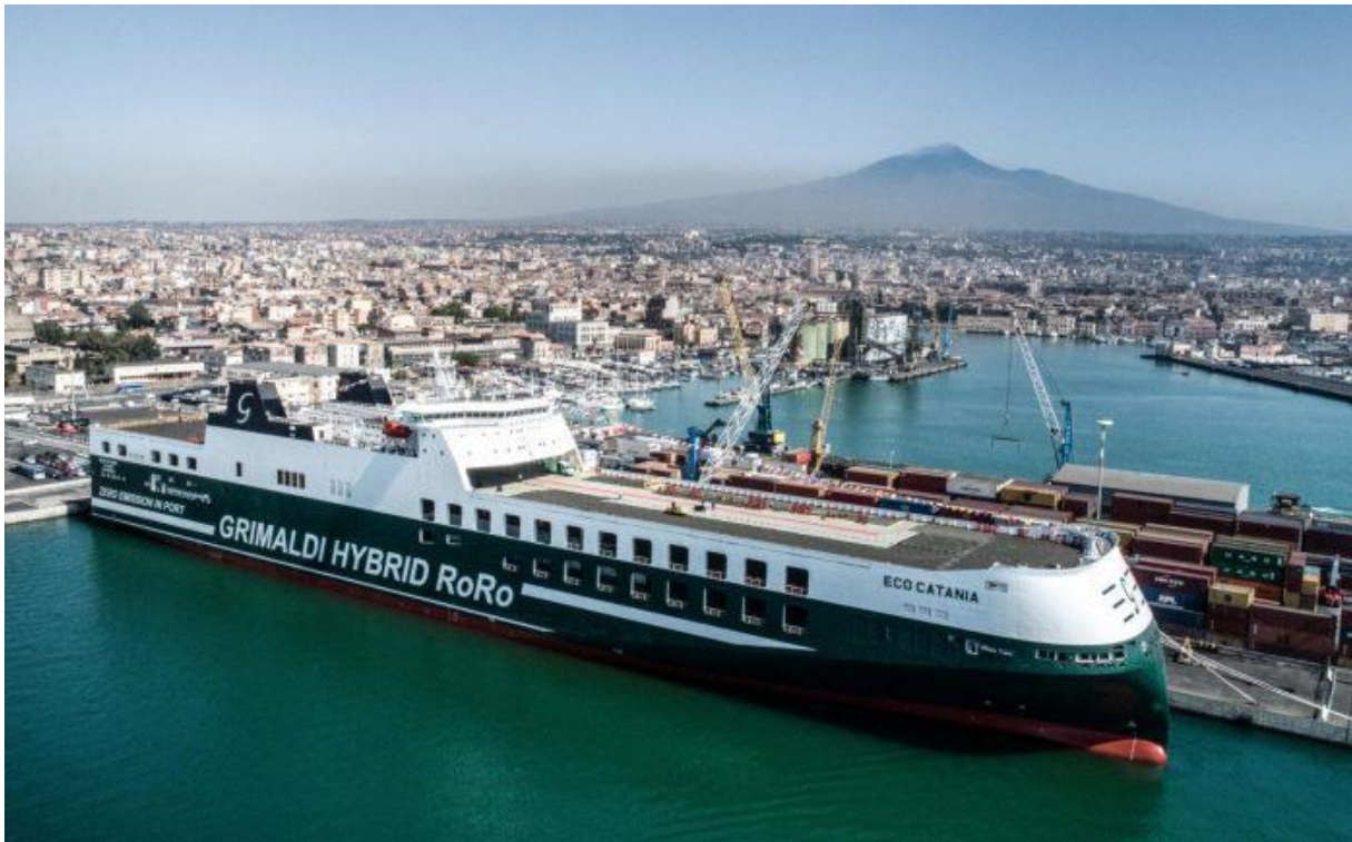
Slika 3. Primjer RO-RO broda