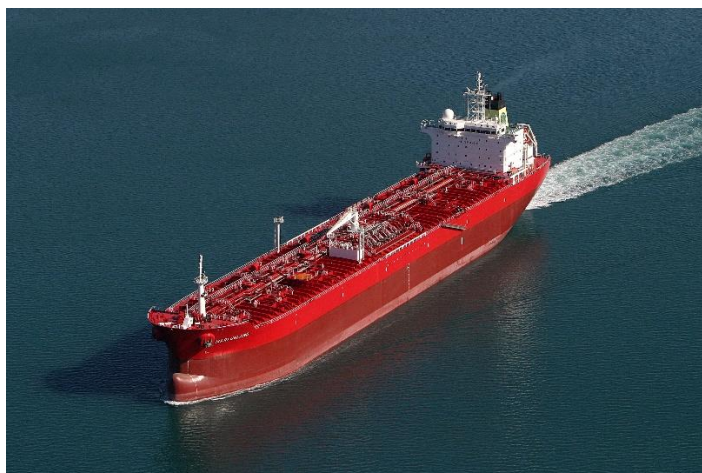
Slika 5. Primjer tankera za prijevoz nafte