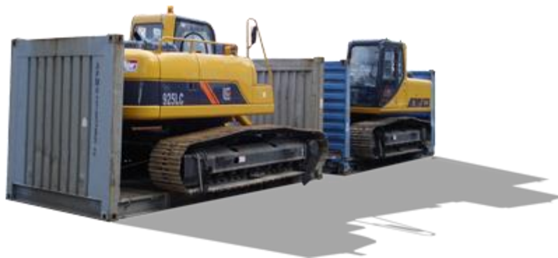
Slika 4. Primjer prijevoza vangabaritnog tereta

Vangabaritni tereti poznati su još i pod nazivom preveliki tereti. To su dakle svi oni tereti koji su dulji od 13,6 metara, a širina i visina prelaze 2,5 metara. „S obzirom na masu, ova kategorija uključuje teret koji nosi opterećenje na osovinaima vozila koje prelazi maksimalno dopušteno prema tehničkim zahtjevima.” 18 Kod prijevoza vangabaritnih tereta morem, isto kao i kod prijevoza teških tereta morem, jako je važno razlikovati vrste ovog tipa tereta kako bi se moglo s njim pravilno rukovati. Također potrebno je slijediti Kodeks o sigurnom slaganju i učvršćivanju tereta kako bi se osigurao pravilan prijevoz. Radi se o uputstvu za prijevoz teških i vangabaritnih tereta morem, a ta uputstva sadrže podatke o tome koja je maksimalna nosivost opreme prilikom pričvršćivanja tereta kao i način na koji se može utvrditi je li sistem dovoljan da spriječi pomicanje i klizanje tereta prilikom tansporta.