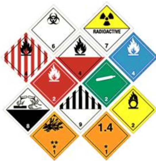
Slika 7. Oznake opasnih tvari

tvarima budu izvedeni na način koji osigurava zaštitu života i zdravlja ljudi, radnog okoliša, materijalnih dobara i prometne sigurnosti.” 32