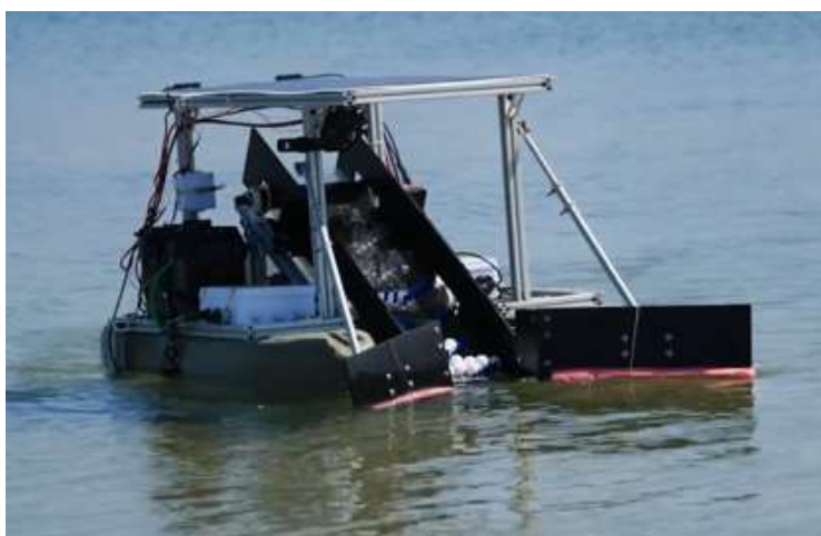
Slika 10. FRED

Plutajući robot za prikupljanje otpada (engl. Floating Robot for Eliminating Debris - FRED ), je stvorila neprofitna organizacija Clear Blue Sea koja je posvećena razvoju robotskih rješenja za uklanjanje plastičnog onečišćenja iz oceana, rijeka i vodnih putova (slika 10).