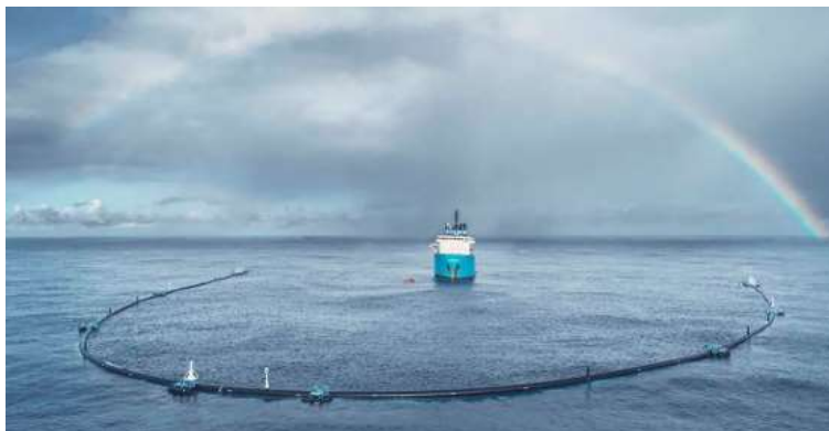
Slika 6. System001

Sustav 001 je pasivni skupljački aparat koji radi tako što se kreće u tandemu s oceanskim strujama, iskorištavajući obrasce kružnog kretanja vode, zvane vrtlozi koji uzorkuju nakupljanje smeća (slika 6).