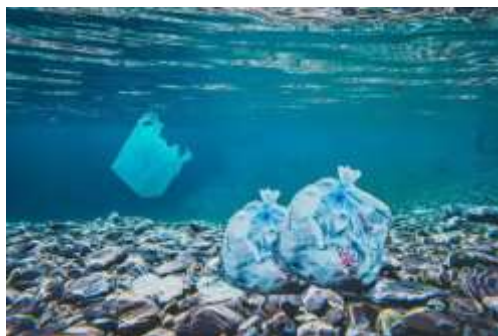
Slika 3. Otpad na morskom dnu