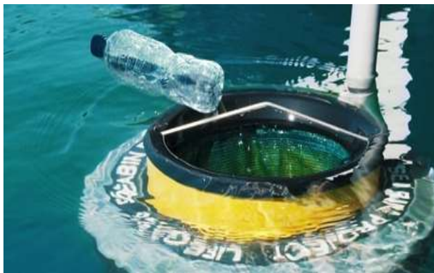
Slika 7. Seabin V5

Seabin djeluje kao "čistač otpada" koji pluta po površini mora te hvata plutajući otpad (plastiku), ulja i goriva iz onečišćenih mora i oceana. Seabin je kompaktan uređaj koji se obično postavlja u vodi u blizini obale ili u marinama (slika 7).