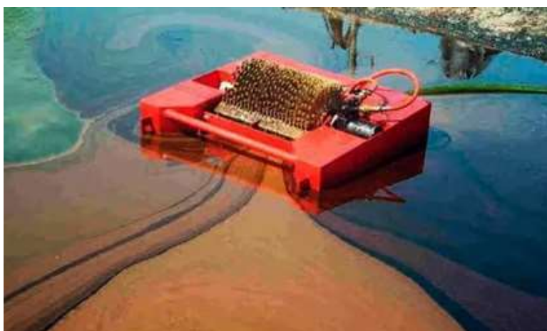
Slika 12. Skimmer

Skimmer za prikupljanje nafte je uređaj dizajniran za uklanjanje nafte i naftnih derivata iz vodene površine, kao što su mora, jezera, rijeke ili pruge za drenažu. Ovi uređaji su ključni u hitnim situacijama poput izlivanja nafte iz brodova ili naftnih bušotina, kako bi se spriječilo onečišćenje okoliša.