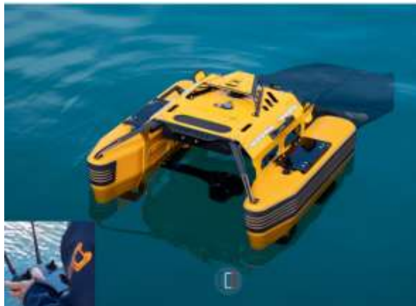
Slika 11. Jellyfishbot

Jellyfishbot, dostupno na: https://www.jellyfishbot.io/wp-content/uploads/2023/01/Jellyfishbot-Features.jpg (20.8.2023)