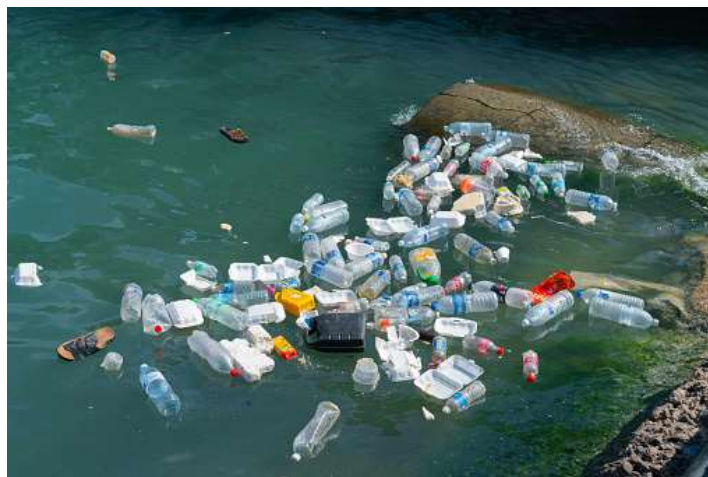
Slika 2. Plutajući otpad u moru