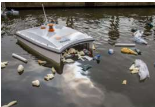
Slika 9. WasteShark A

Prvi svjetski autonomni robot za čišćenje otpada koji je ikada postavljen za rješavanje problema plastičnog onečišćenja u lukama, kanalima, marinama i unutarnjim vodama (slika 9).