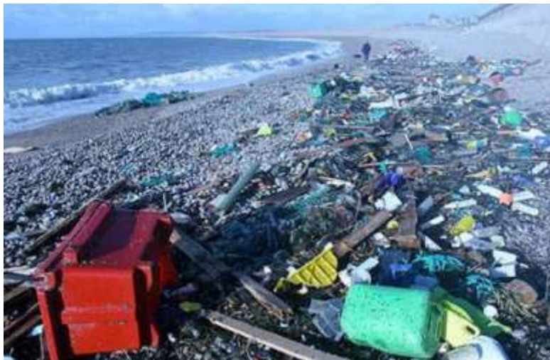
Slika 1. Otpad na plaži u Velikoj Britaniji

Iz tog razloga, količina otpada na obali (slika 1) predložena je kao glavni pokazatelj onečišćenja mora morskim otpadom koji se karakterizira kao „trendovi u količinama otpada izbačenog na obalu i/ili odloženog na obale, uključujući analizu njegovog sastava, prostornu distribuciju i, gdje je moguće, izvor.“ 10