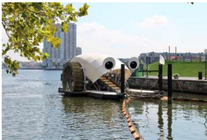
Slika 8. Mr. Trash Wheel

Mr. Trash Wheel samo je jedan od mnogih inovativnih uređaja i tehnika koji se koriste za uklanjanje otpada iz vode i zaštitu okoliša od onečišćenja.