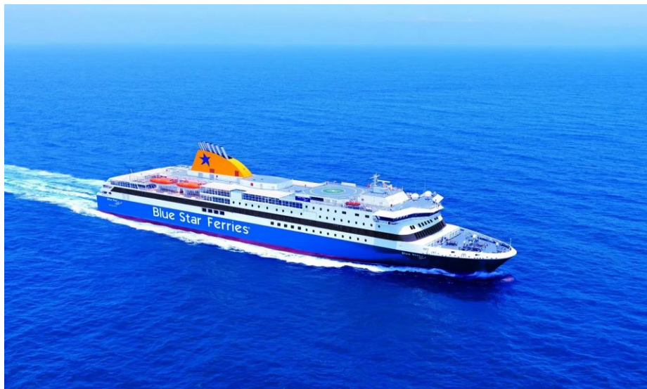
Slika 8: Brod u floti kompanije Blue Star Ferries