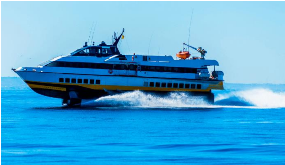
Slika 4. Hidrogliser

- Hidrogliseri: Hidrogliseri koriste hidrodinamičke foile kako bi se podigli iznad površine vode pri velikim brzinama. To smanjuje trenje i omogućuje im da klize iznad vode, što rezultira vrlo visokim brzinama i glatkom vožnjom. Hidrogliseri se često koriste za putovanje na moru s brzim prijevozom putnika.