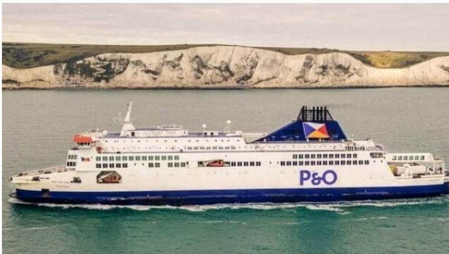
Slika 14: Brod u floti kompanije P & O

P & O Ferries i Irish Ferries upravljaju linijama od Dovera do Calaisa, dok DFDS nudi uslugu i do Calaisa i do Dunkerquea.