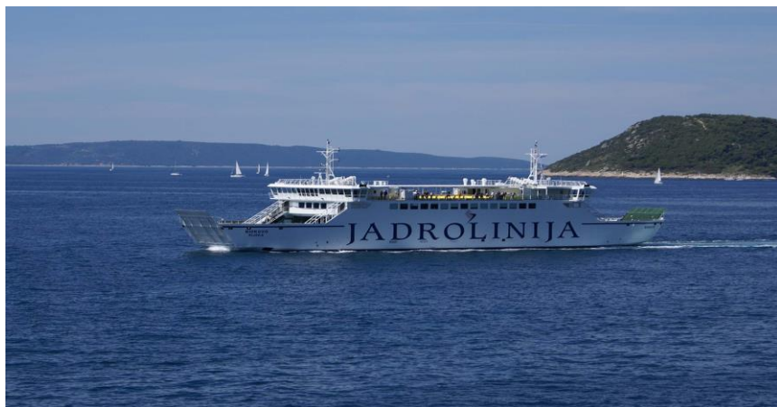
Slika 2. Ro – Ro Putnički brod

Različite rute: Ro-Ro putnički linijski brodovi obično imaju različite rute koje povezuju različite luke. To omogućuje putnicima da dosegnu različite destinacije na moru.