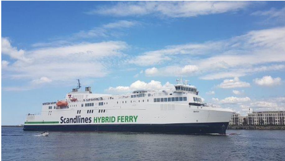
Slika 13: Brod u floti kompanije Scandlines