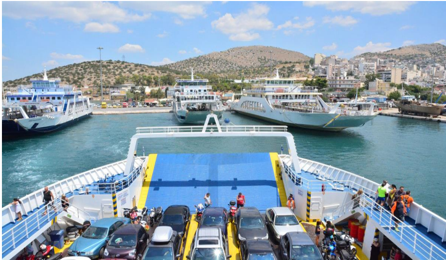
Slika 7: Luka Paloukia Salaminas