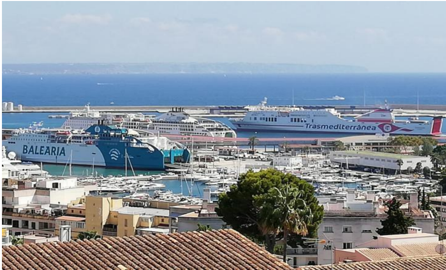
Slika 11. Luka Palma de Mallorca