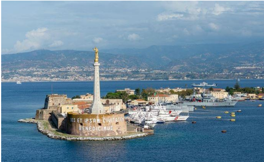
Slika 9. Luka Messina