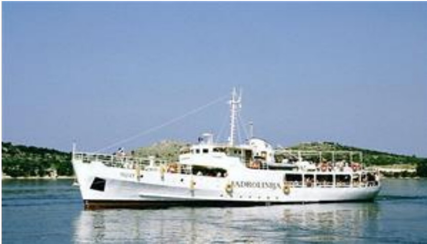
Slika 1. Klasični putnički brodovi