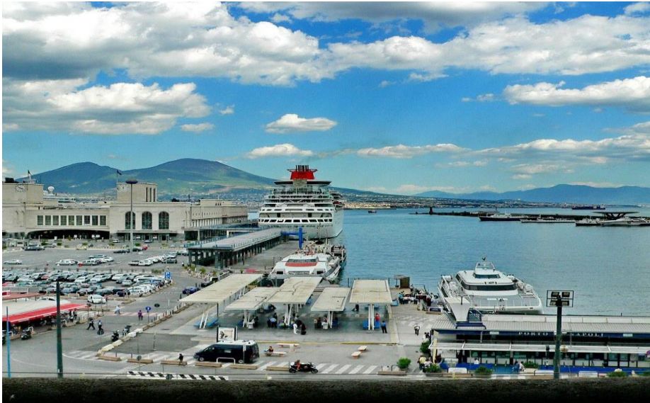
Slika 10. Luka Napoli