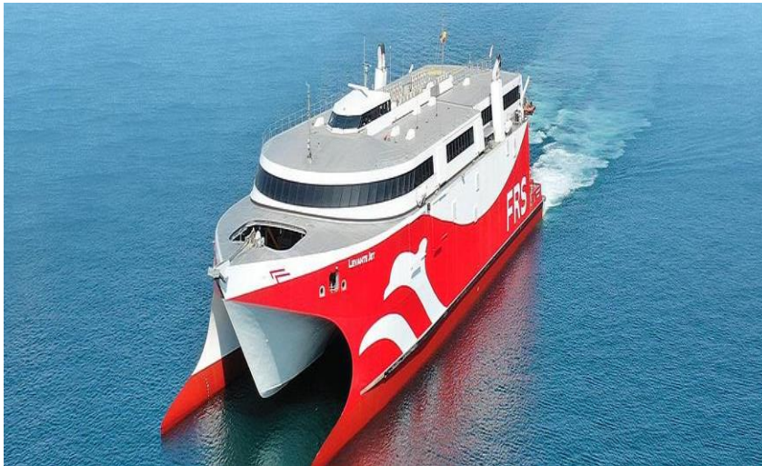
Slika 3. HSC

Vrlo brzi putnički brodovi, poznati i kao high-speed putnički brodovi, predstavljaju specijaliziranu kategoriju brodova dizajniranih za brza i učinkovita putovanja između različitih obala ili destinacija. To su brodovi kojima je maksimalna brzina, izražena u metrima po sekundi jednaka ili veća od 3,7 \nabla 0,1667 , gdje je \nabla deplasman na konstrukcijskoj vodenoj liniji, izražen u kubičnim metrima. Ovi brodovi koriste visoko razvijene tehnologije kako bi postigli znatno veće brzine od tradicionalnih putničkih brodova, često znatno smanjujući vremenske udaljenosti između luka. Osnovna karakteristika vrlo brzih putničkih brodova je njihova sposobnost postizanja iznimno velikih brzina na vodi. To se postiže posebnim oblikom trupa i naprednim pogonskim sustavima kao što su turbina na plin ili sustavi vodenih mlaznica (jet sustavi). Ova tehnologija omogućuje tim brodovima da postignu brzine koje znatno premašuju konvencionalne putničke brodove.