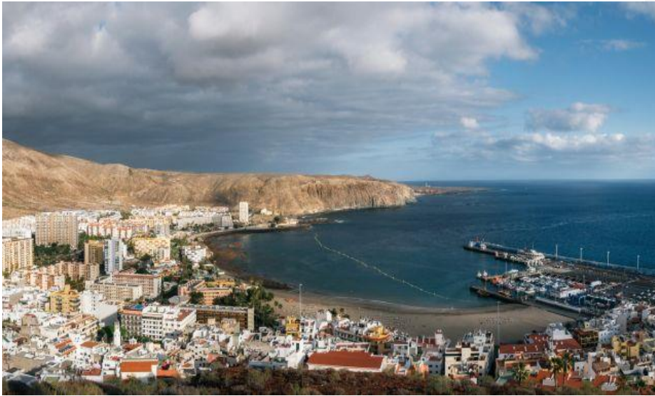
Slika 12. Luka Santa Cruz de Tenerife