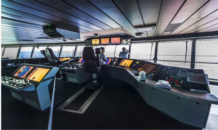
Slika 8 Komunikacijska oprema na krizerima