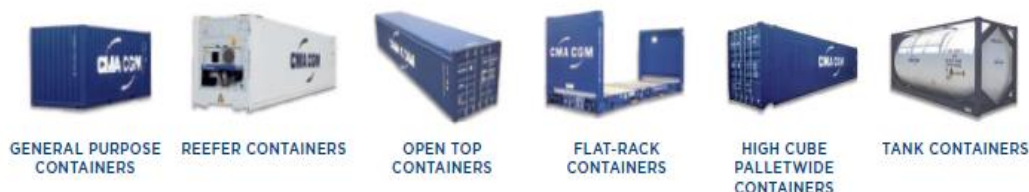
Slika 6. Vrste kontejnera

Kontejneri su standardizirane čelične kutije za prijevoz robe koja se može prevoziti brodom, kamionom ili vlakom koje su dovoljno otporne da mogu osigurati višestruku upotrebu. Olakšavaju prijevoz robe bez premještaja tereta jer na sva četiri kuta imaju utore za „ twist lockere “, zakretnu bravu dizajniranu prema ISO standardu za lakše rukovanje prilikom pretovara iz jednog oblika prijevoza u drugi. Kontejneri mogu biti univerzalni i posebni, različitih dimenzija itd.