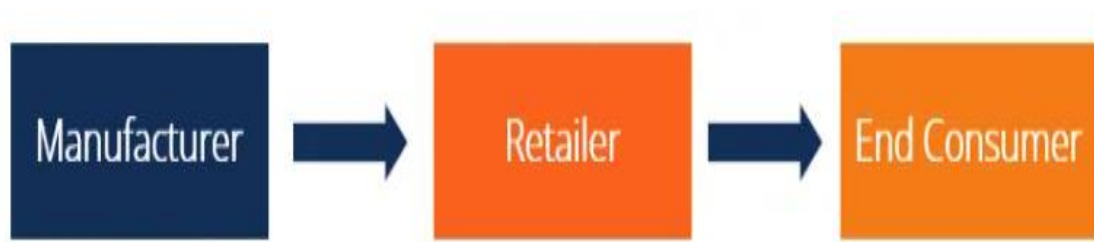
Shema 3: Kanal prve razine