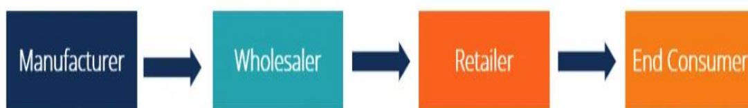
Shema 4. Kanal druge razine