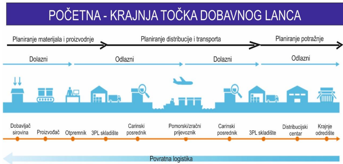
Schema 6: Dobavni lanac od početne do krajnje točke