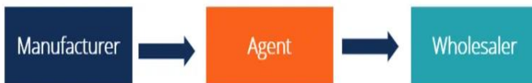
Shema 5: Kanal treće razine

Izvor: https://corporatefinanceinstitute.com/resources/knowledge/other/distribution-channel/