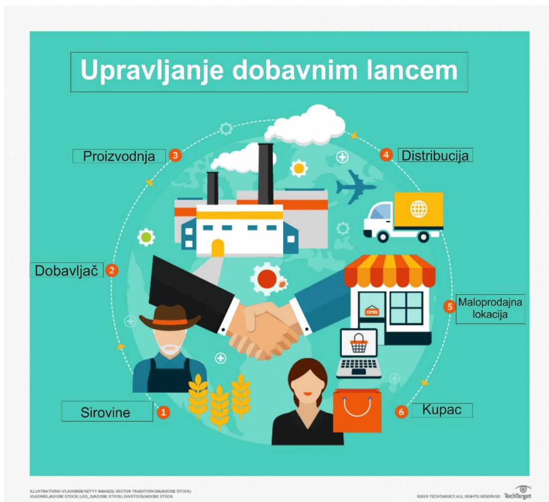
Schema 7: Aktivnosti i područja kojima upravlja SCM