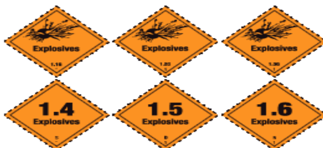
Slika 1 Oznake opasnih tvari klase 1.

eksplozivnim kemijskim razlaganjem oslobađati plinove ili energiju u obliku topline. 4 Tvari koje spadaju u klasu jedan su pirotehnička sredstva, vatromet, streljiva, itd.