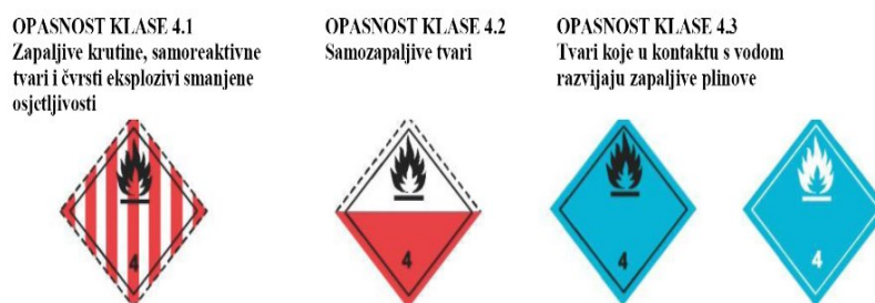
Slika 4 Oznake opasnih tvari klase 4.

Zapaljive krute tvari imaju svojstva zapaljivosti, hlapljivosti i izgaranja požara radi trenja prilikom prijevoza.