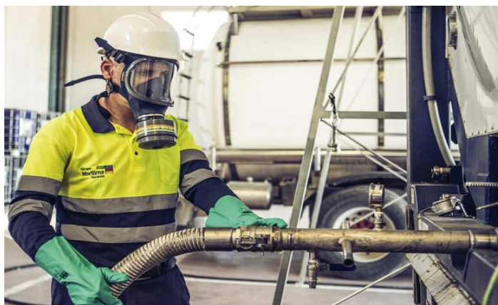
Slika 12 Potrebna zaštitna odjeća prilikom rukovanja opasnim teretom

Izvor: https://maritimasureste.com/en/logistics/dangerous-goods/ (17.08.2022.)