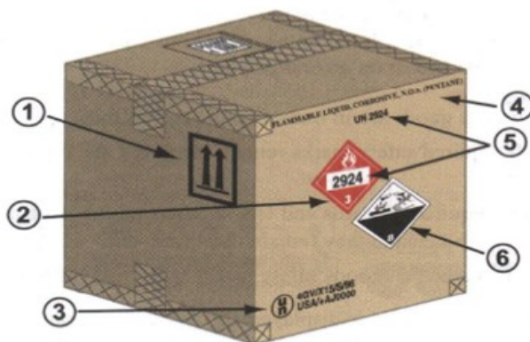
Slika 10 Označavanje opasnih tvari

Pod pakirnom skupinom I ubrajaju se tvari velike opasnosti, pod skupinom II tvari srednje opasnosti i skupina III predstavlja tvari male opasnosti. 33