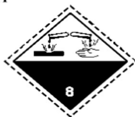
Slika 8 Oznaka opasnih tvari klasa 8.