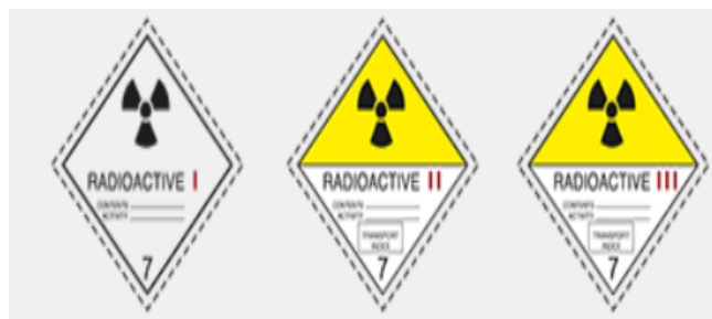
Slika 7 Oznake opasnih tvari klase 7.