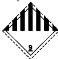
Slika 9 Oznaka opasnih tvari klasa 9.