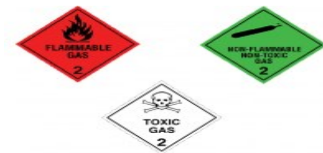
Slika 2 Oznake opasnih tvari klase 2.

Klasa 2 – pod klasu dva svrstavaju se plinovi, definirani kao tvari koje imaju temperaturu nižu od 50 Celzijevih stupnjeva ili na 50 Celzijevih stupnjeva tlak pare više od 3 bara i koji ako se pomiješaju sa zrakom mogu eksplodirati. 7