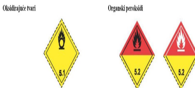
Slika 5 Oznake opasnih tvari klase 5.

Oksidirajuće tvari imaju svojstva izgaranja jer mogu ispuštati kisik, te prilikom ispuštanja dolazi do izgaranja drugih materijala, te nastaju katastrofalne posljedice. Reagiraju opasno s drugim tvarima. Tvari kao nitrati, klorati, kalcijev peroksid, kalcijev nitrat, itd.