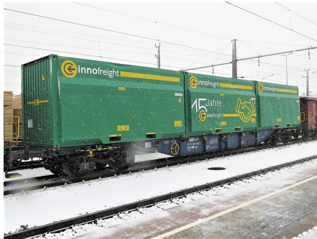
Slika 1. Teretni vagon