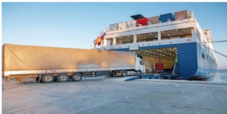
SLIKA 8 PRIKAZ RO - RO BRODA

Proces utovara na brod odvija se vlastitim kotačima tereta koji prelazi ukrcajnu rampu. Uloga rampe je da spoji brodsko skladište s obalom. Istovar je iduća faza koja se događa nakon što je roba transportirana morem, a preko iskrcajne rampe teret zatim ponovno prelazi vlastitim kotačima. RO-RO tehnologija koristi se za transport koji se odvija na trasi unutar dvije tisuće nautičkih milja i upravo zbog toga je karakteristična za transport zatvorenim morem.