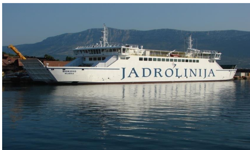
SLIKA 9 RO - RO PUTNIČKI BROD