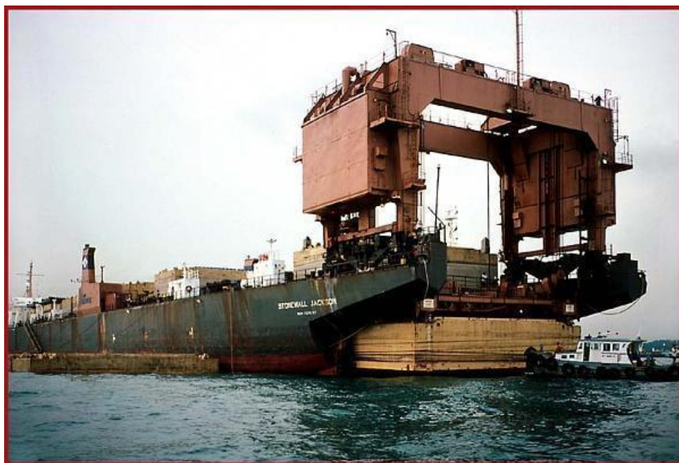
SLIKA 11 PRIKAZ LASH BRODA