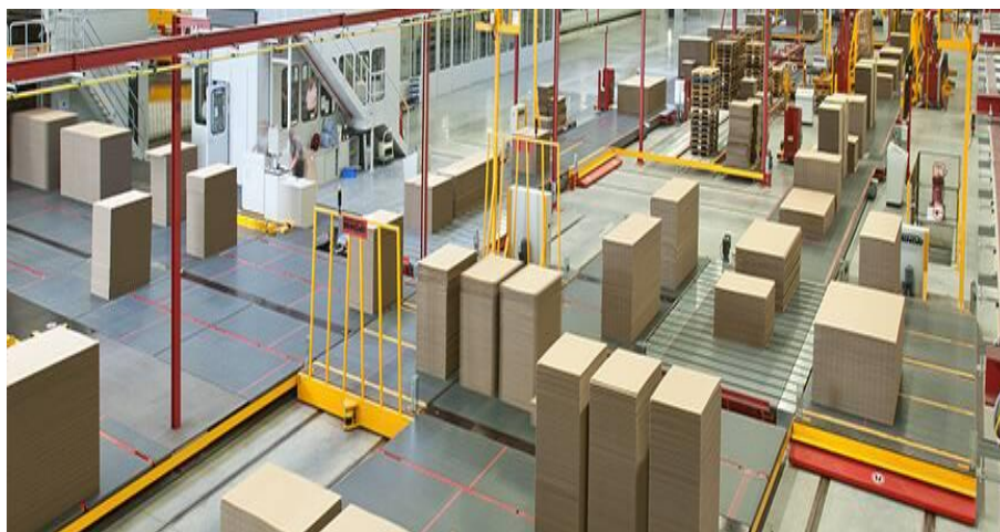
SLIKA 3 PRIKAZ SKLADIŠTA ZA ROBU