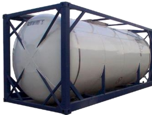
SLIKA 4 PRIMJER SPECIJALIZIRANOG KONTEJNERA

Sredstva suvremenih prometnih tehnologija koriste se za prijenos i prijevoz robe, prekrcaj robe, njeno skladištenje i daljnje očuvanje, prometna infrastruktura koja je objekt suvremenih prometnih tehnologija i kvaliteta organizacija rada. 16