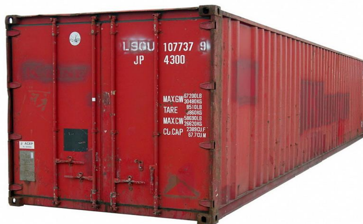
SLIKA 7 OSNOVNI OBLIK PAKIRANJA

Povijest kontejnerizacije ne seže daleko u prošlost, a nastanak kontejnerizacije je prekretnica na području poslovanja u transportnom sustavu. Pomorske luke na svom razvoju mogu zahvaliti upravo ovom obliku transportnog manipulacijskog sredstva. Utjecaj kontejnerizacije na gospodarstva zbog neometanog protoka robe i racionalizacije prostora je velik.