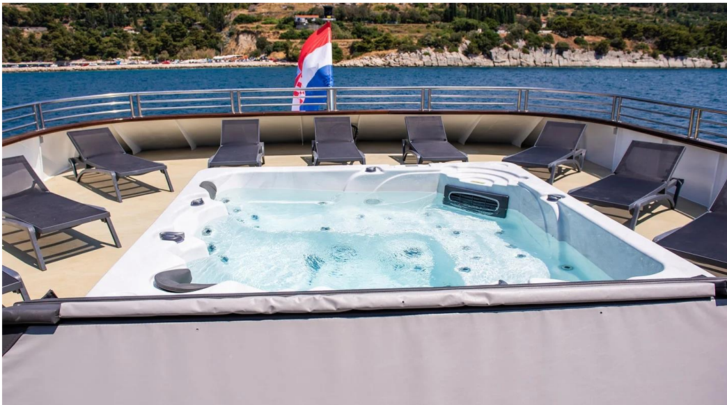
Slika 42: Sunčalište s jacuzzijem na mini kruzeru Alfa Mario