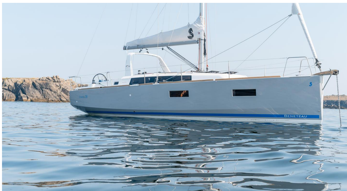
Slika 14: Oceanis 38 na sidru