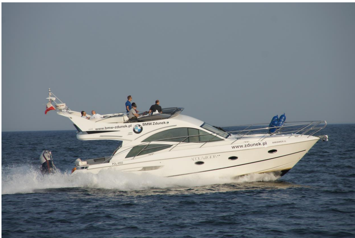
Slika 25: Jahta u plovidbi