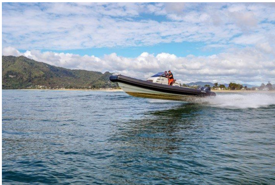
Slika 12: Brig Eagle 10 u području glisiranja