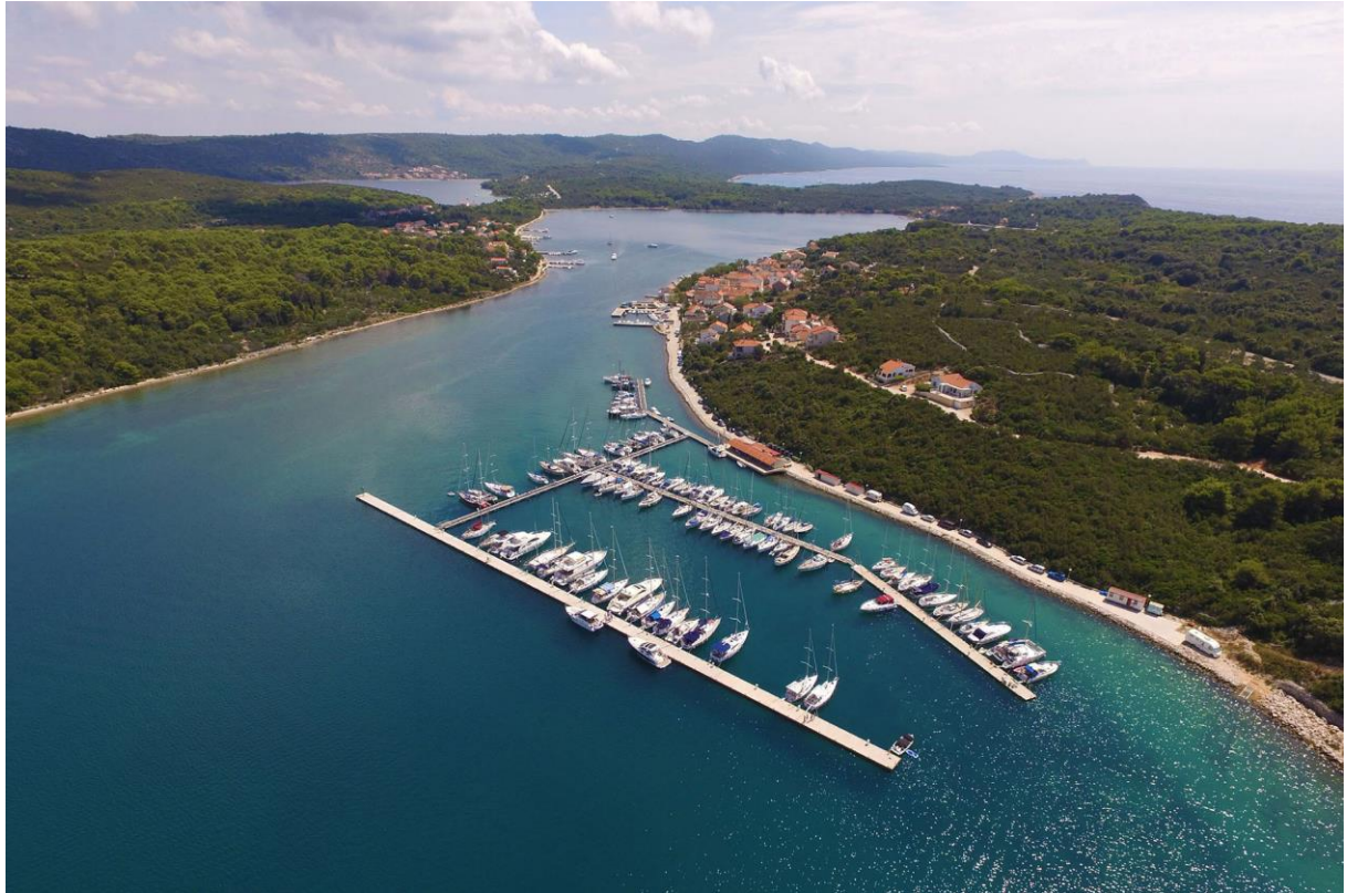
Slika 1: Marina Veli Rat