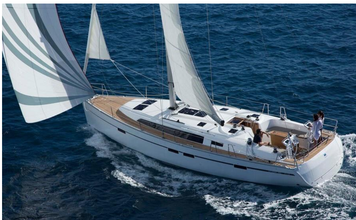
Slika 16: Bavaria 46 u plovidbi