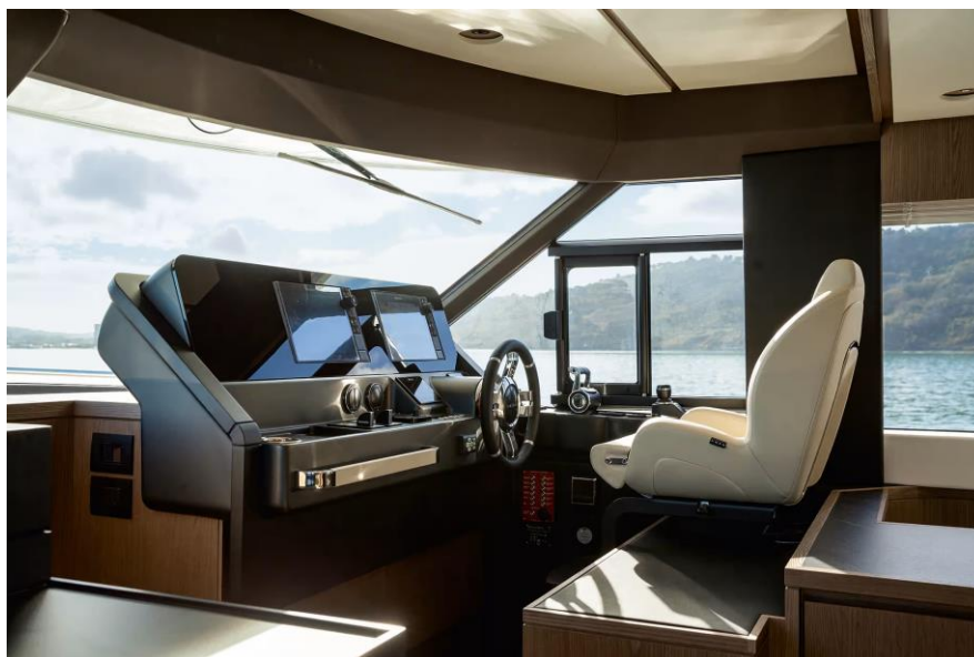
Slika 29: Unutarnja upravljačka ploča Azimuta 66

Unutarnja kormilarska stanica koja se nalazi nasuprot kuhinje je dosta visoka, ali je ta visina potrebna da se vidi preko jednako visoke upravljačke ploče s dva monitora. Odmah pored kormila se nalazi klizni prozor i to je odličan izbor iz razloga što se kormilo ne nalazi na sredini upravljačke ploče nego je pomaknuta uz rub do prozora gdje se nalazi i ručica za gas i način vožnje. Tako skiper može stajati na bočnoj palubi s otvorenim prozorom i kontrolirati pristajanje uz odličnu vidljivost.