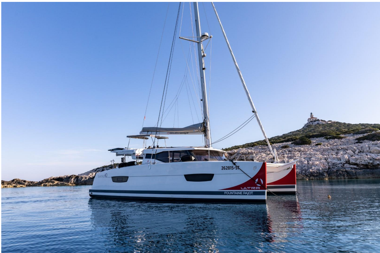
Slika 19: Lucia 40