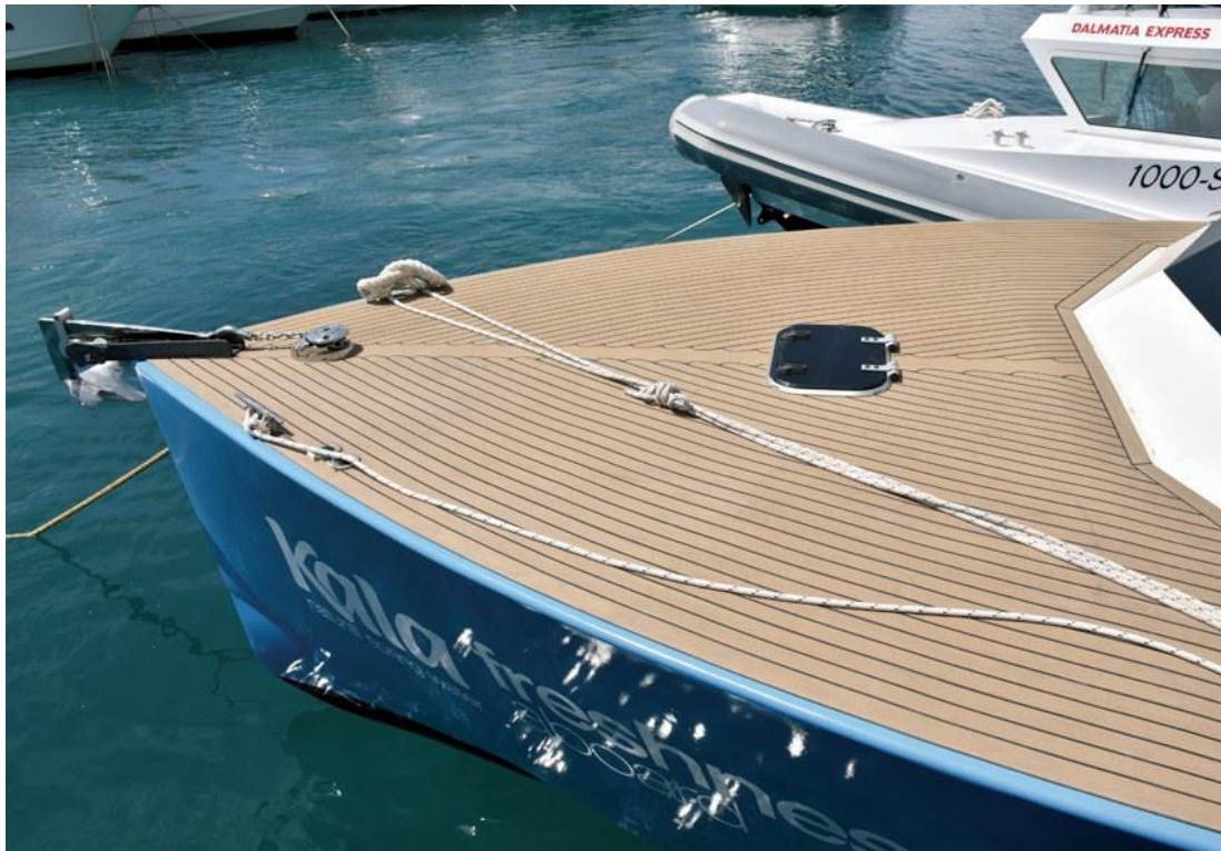
Slika 4: Pramac Colnaga 40