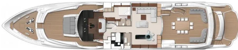
Slika 33: Tlocrt gornje palube Sunseekera 131

Na najgornjoj palubi se nalazi jacuzzi i dovoljno prostora za uživanje u večerama na zraku ili organiziranje zabava. Prostrana garaža može primiti tender do 6 metara duljine. Sunseeker ima duboki trup u obliku slova V, tako da ova velika luksuzna jahta s tri palube je jednako udobna pri brzini krstarenja od 10-tak čvorova gdje se može dohvatiti i 1 600 nautičkih milja, kao i pri brzini od 25 čvorova gdje pruža vrhunske performanse. Vrijeme gradnje nove Sunseeker 131 jahte traje oko godinu dana.