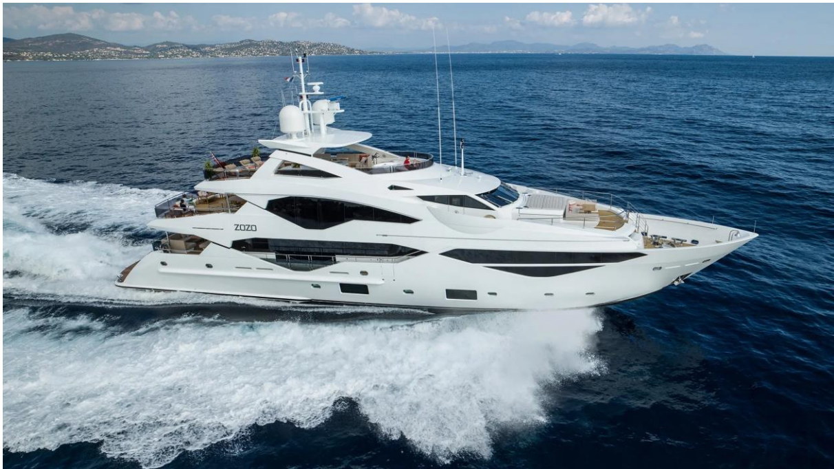
Slika 31: Sunseeker 131 u plovidbi