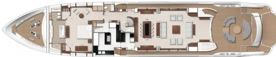
Slika 34: Tlocrt glavne palube Sunseekera 131