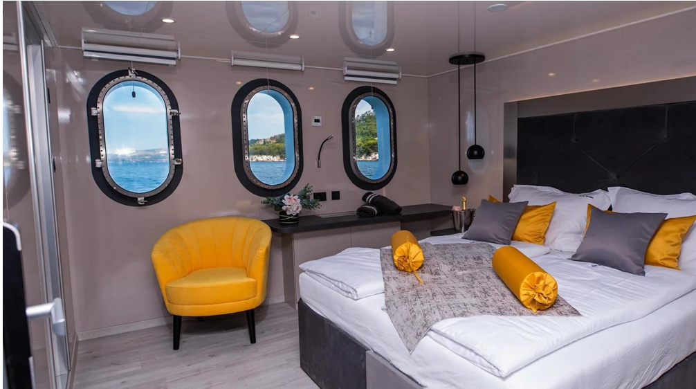
Slika 41: Izgled kabine na mini kruzeru Alfa Mario

bar s glasoviom kao i vrhunski bar s velikom ponudom pića. Od dodatnih pogodnosti Alfa Mario nudi korištenje jet skija, morskog boba, opreme za ronjenje, paddle i kajak. Glavni salon se nalazi na gornjoj palubi i dug je 25 metara. Putnici u salonu uživaju u ugodnoj atmosferi prilikom doručka, ručka i večere. Posadu Alfa Maria čine zapovjednik, prvi časnik, glavni kuhar, pomoćni kuhar, dva mornara, dva konobara i čistačica.