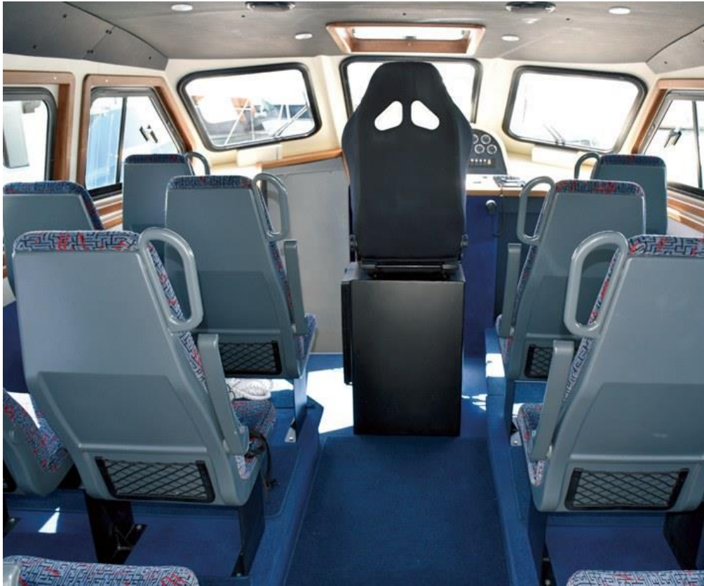
Slika 6: Sjedala u kabini

Kabina Colnaga 40 se odlično uklapa u liniju samog plovila. Na krmenom djelu se nalaze dvije klupe koje su postavljene uz bok broda, te se uz klupe na krmi još nalazi prostor za smještaj motora i spremište za palubnu opremu. U kabinu se ulazi kroz klizna vrata unutar koje se nalaze 12 avionskih sjedala za smještaj putnika i dva sjedala za članove posade.