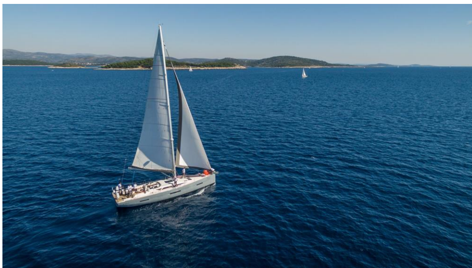
Slika 13: Jedrilica

Po broju kormila jedrilica može imati jedno ili dva.