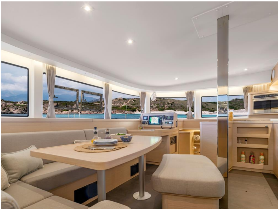
Slika 23: Unutrašnjost Lagoon 42