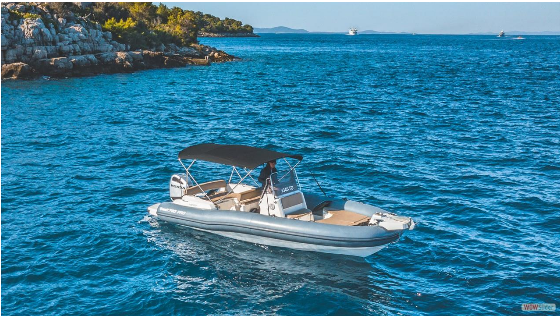
Slika 8: Gumenjak