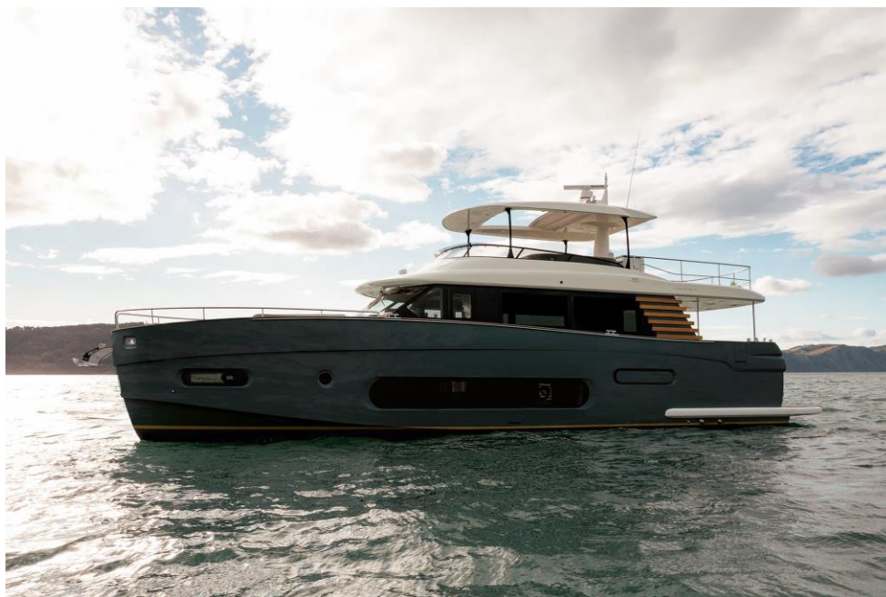
Slika 26: Azimut 66