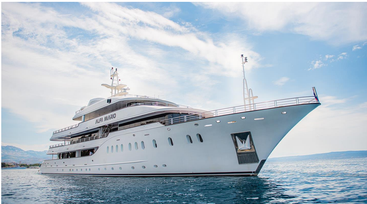
Slika 40: Mini kruzer Alfa Mario