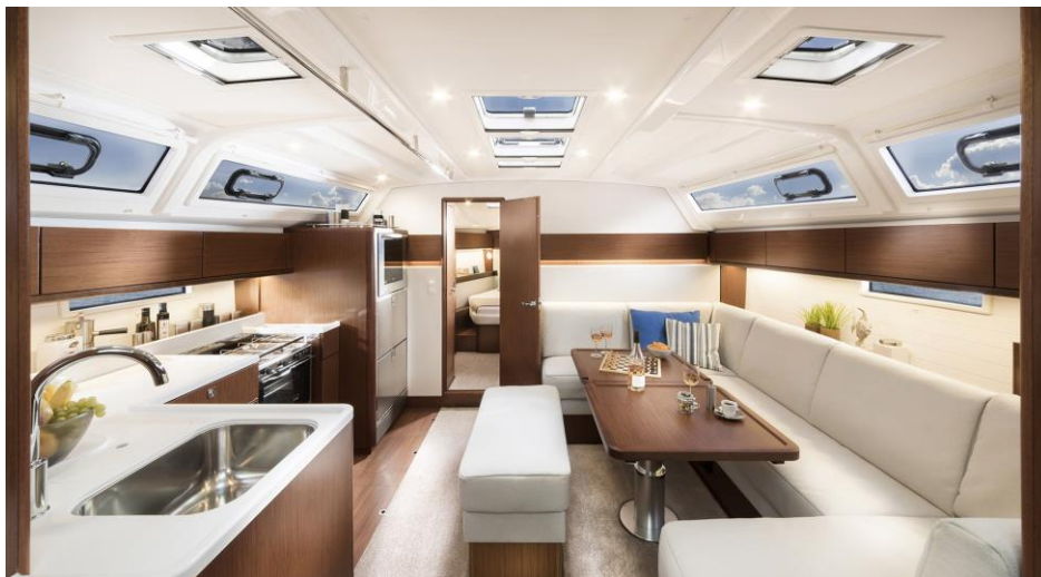
Slika 17: Unutrašnjost Bavarie 46

prostranu kabinu s tri ili 4 ležaja, ovisno o modelu. Bez problema se udobno može smjestiti osam ljudi. U kuhinji se nalaze dva manja hladnjaka, sudoper i štednjak s pećnicom.