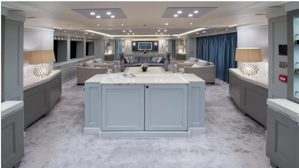
Slika 32: Glavni salon Sunseekera 131