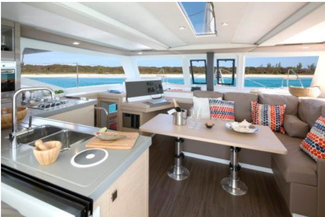
Slika 20: Salon Lucie 40

ukoliko se podiže glavno jedro, okreće ili namotava sve se može napraviti s krme. Unutar salona se nalazi kuhinja koja je okrenuta prema krmi s dva sudopera. Na desnoj strani salona se nalazi velika sofa sa stolom, a nasuprot sofe se nalazi navigacijska stanica. Na krovu salona nema prozora. Lucia 40 ima široku palubu, ali manjak rukohvata i to je problem u slučaju da je paluba mokra i skliska pa može doći do pada i zato je potrebno paziti gdje se hoda. Pramčana paluba ima dva spremišta ispod dnevnih ležaljki, jedan je spremnik za vodu, a drugi za sidreni lanac. Mreže na pramcu su manje nego kod sličnih katamarana drugih proizvođača jer se iskoristio maksimalno prostor za smještaj. Kabine za spavanje se nalaze okrenute prema krmi. Lucia 40 dolazi u nekoliko verzija: Maestro s dvije dvokrevetne kabine i dvije ili tri kupaonice, Quatour i Charter s četiri dvokrevetne kabine i s dvije ili četiri kupaonice. Lucia 40 je jedini katamaran na tržištu koji nudi mogućnost četiri kupaonice koji je manji od 12 metara.