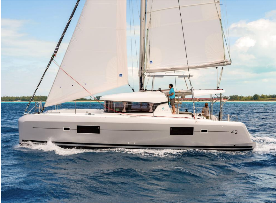
Slika 22: Lagoon 42