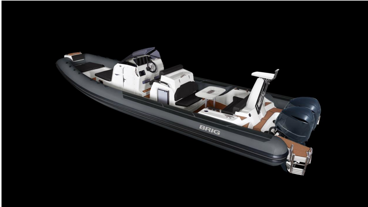
Slika 9: Brig Eagle 10

BRIG je ukrajinska tvornica za proizvodnju gumenjaka koja je smještena u Kharkivu. BRIG je jedan od svjetskih lidera u proizvodnji gumenjaka, te broj jedan u Europi.