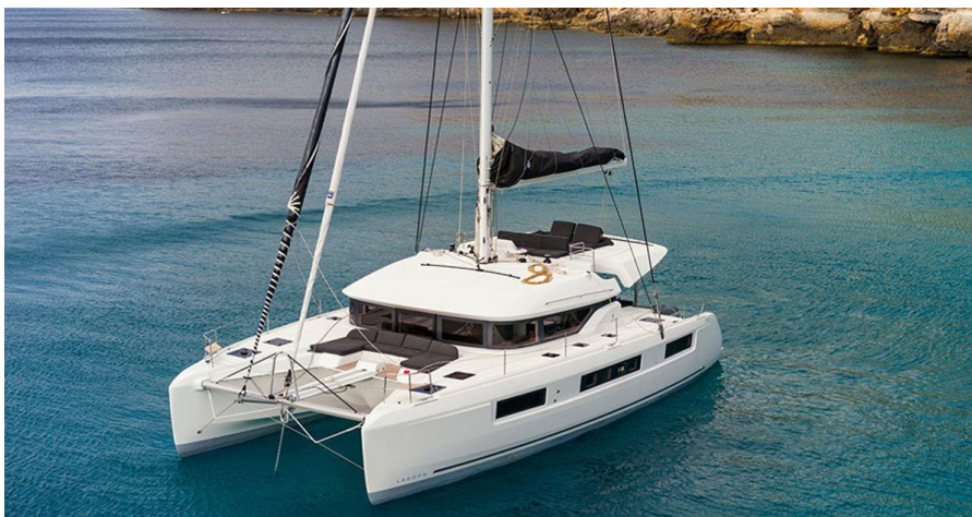
Slika 18: Katamaran