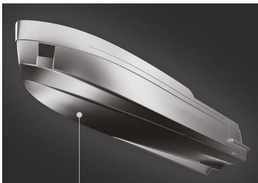
Slika 27: Poluglisirajući trup Azimuta 66

Posebnost Azimutovih jahti je poluglisirajući izgled trupa koji je visoko učinkovito dizajniran za smanjenje potrošnje goriva i emisija ugljikovog dioksida za 20 posto pri srednjim brzinama uspoređujući s plovilima iste duljine i težine s jednostavnim trupom. Ovakav trup omogućuje udobniju navigaciju pri različitim stanjima mora. Ovakav trup s okomitim pramcem minimalizira učinak valova te samim time je udobnija navigacija pri malim i većim brzinama.