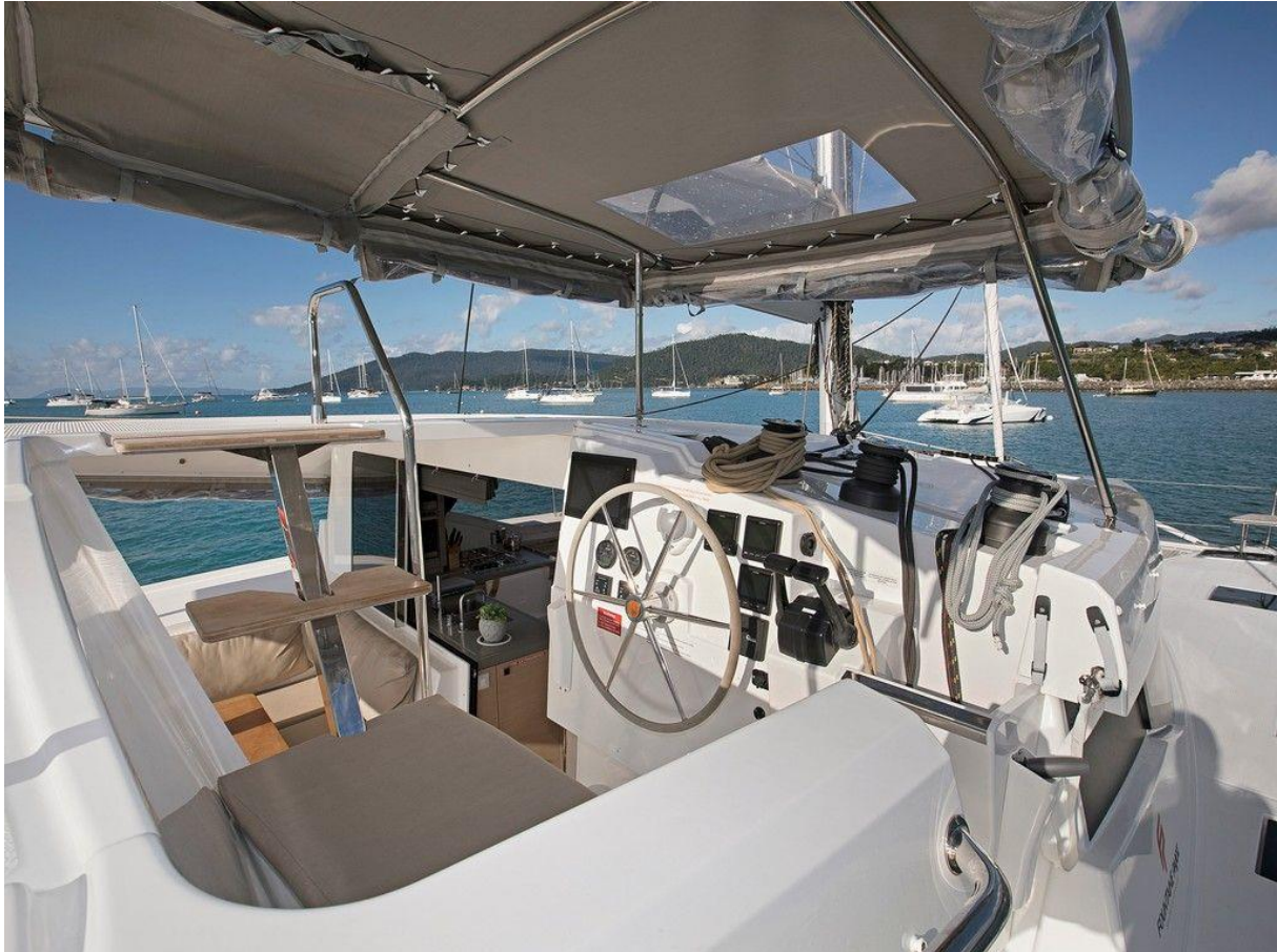
Slika 21: Pozicija kormila na Lucii 40

je pretežan, a zbog toga i mreža na pramcu je manja za uživanje u suncu i moru, preglednost s kormila prema krmi je dobra, ali se treba sagnuti da bi se bolje vidjelo zbog krmenog krova, još jedan problem je u tome što se kormilo nalazi na desnoj strani, što znači da prilikom plovidbe se desna strana vidi odlično, dok lijeva je problematična. Ne postoji nikakav prolaz ili stepenica da se s pramca popnete na krov salona, to je moguće samo s kormilarske pozicije.