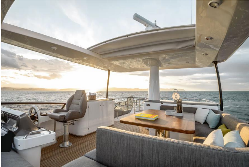
Slika 30: Otvorena gornja paluba Azimuta 66

Otvorena paluba koja se nalazi iznad salona na kojoj se nalazi vanjska upravljačka ploča počinje od sredine broda i ide sve do krmenog zrcala pružajući hladovinu otvorenom dijelu na krmi. Na samoj to otvorenoj palubi je tvrdi krov od stakloplastike koji služi za činiti sjenu skiperu tokom plovidbe. Uz upravljačku ploču na otvorenoj gornjoj palubi se nalazi sofa okrenuta prema krmi sa stolom od tikovine.