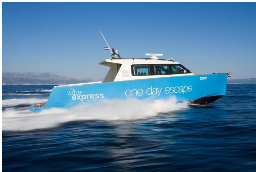
Slika 3: Colnago 40 u plovidbi