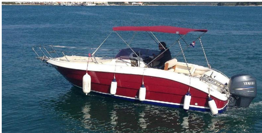
Slika 2: Gliser