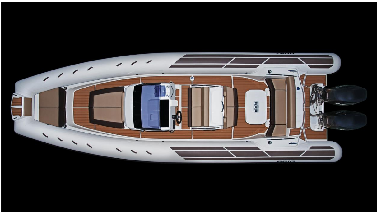
Slika 10: Brig Eagle 10 - ptičja perspektiva

Dimenzije Brig Eagle 10 pružaju mnogo izbora. Dovoljno je stabilan gumenjak za duža putovanja. Postavka s dva vanbrodska motora pruža uživanje u vožnji s brzinom preko 50 čvorova. Ovaj gumenjak ima duboki V-trup koji pruža iznimno suhu i glatku vožnju. Stabilniji je, lakši i manje ga je potrebno održavati od konkurenata. Ima udobna sjedala, preklopni stol i sunčalište, sudoper u kojem su smješteni hladnjak i štednjak, praktičnu krmenu platformu za kupanje sa sklopivim ljestvama i vanjskim tušem, te dobro opremljenu kabinu s bračnim krevetom. Još neke značajke ovog gumenjaka su: protuklizna površina palube, skladišni prostori na pramcu i krmi, ventilacija, prednji šperun, pramčani prsten za tegljenje, pramčane i krmene bitve, komplet za popravak komora, upravljačka konzola, navigacijska svjetla, dvije kaljužne pumpe, spremnik za baterije te kompas.