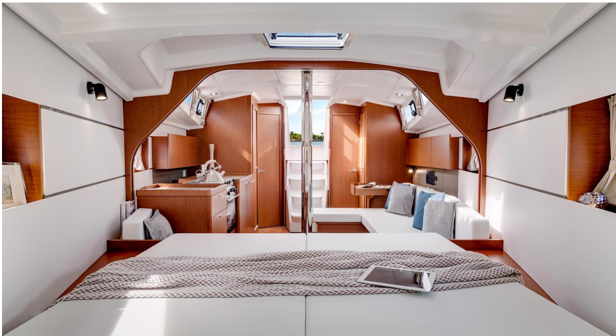
Slika 15: Izgled unutrašnjosti Oceanisa 38

zrcalom. Nizak krov kabine daje lijep profil, dok u unutrašnjosti kabine ima dovoljno mjesta za glavu. Oceanis 38 ima dva kormila te bez problema hvata more bez obzira na kut nagiba. Trup je izrađen od poliestera. Paluba je napravljena od materijala Saerfoam što povećava čvrstoću i smanjuje težinu, nakon čega se učvršćuje za trup ljepljivom i vijcima. Kobilica je od lijevanog željeza, a kormila od nehrđajućeg čelika. Dva kormila za upravljanje se nalaze na krmenoj palubi, a na krmenom zrcalu se nalazi platforma za kupanje koje se može podizati i spuštati. Bočne palube su dovoljno široke za prolazak od krme prema pramcu, a na krovu kabine se nalaze i rukohvati. Oceanis 38 Daysailer ima samo jednu kabinu te u prostoru kuhinje samo sudoper, dok Weekender i Cruiser imaju dvije ili tri kabine te kuhinju s štednjakom i pećnicom, mikrovalnom pećnicom i hladnjakom.