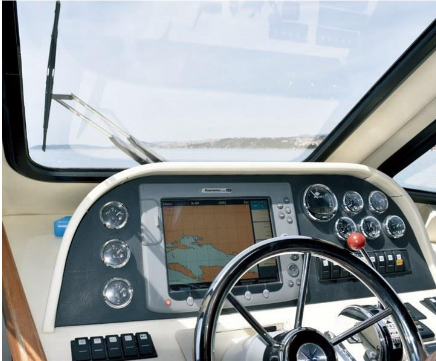
Slika 7: Upravljačka ploča Colnaga 40