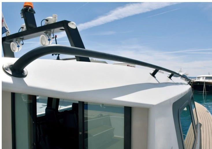
Slika 5: Rukohvati na krovu kabine

Na vrhu pramca se nalazi sidro i sidreno vitlo, a do sidrenog spremišta se dolazi kroz kabinu jer nema otvora na pramcu. Cijeli pramac je jedna velika ravna površina s malom bokaportom i dvije bitve za vez broda. Sve gazne površine na brodu su pokrivene umjetnom tikovinom. Bočni prolazi koji vode do kabine su dovoljno široki za prolaz, ali pošto nema ograde, za siguran prolaz na krovu kabine se nalaze rukohvati.