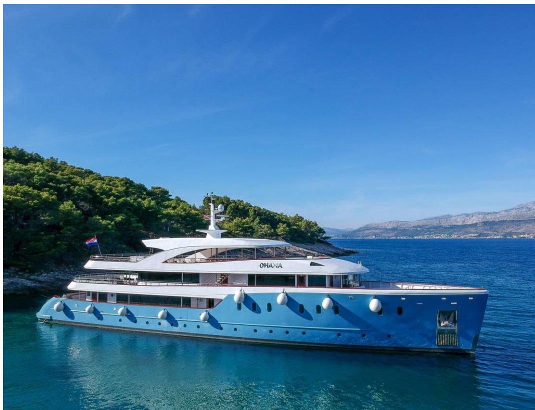
Slika 37: Mini kruzer Ohana

Paluba za sunčanje je opremljena ležaljka i jacuzzijem. Mini kruzer Ohana je opremljen s 16 kabina s bračnim krevetom i dvije kabine za tri osobe. Svaka kabina ima privatni toalet s tuš kabinom.