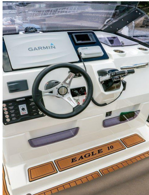
Slika 11: Upravljačka konzola Brig Eagle 10

obalne straže. Kretanje unatrag će donijeti malo mora na krmenu palubu, ali zbog dva vanbrodska motora manevriranje je izvrsno te se zbog toga može okrenuti u mjestu. Ovaj gumenjak može služiti i za ribarske aktivnosti kao i za skupine za ronjenje.