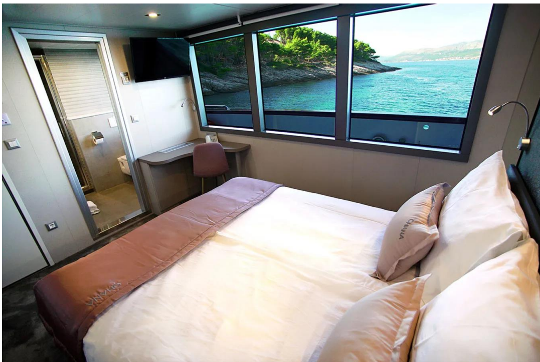
Slika 39: Kabina na mini kruzeru Ohana