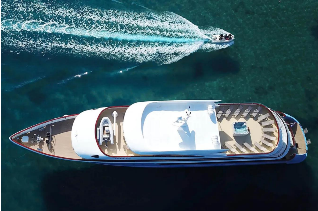
Slika 38: Mini kruzer Ohana iz ptičje perspektive