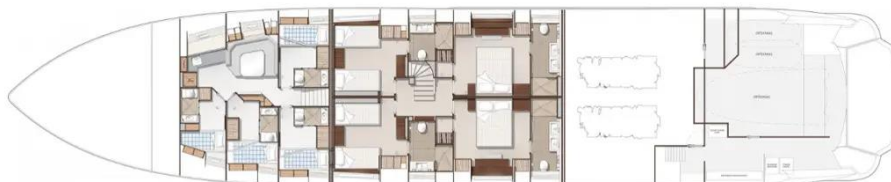
Slika 35: Tlocrt donje palube Sunseekera 131