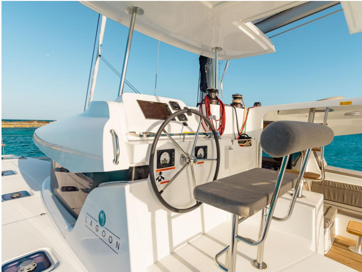
Slika 24: Kormilarska stanica Lagoon 42

Preglednost s kormilarske stanice je dobra, iako se nalazi na lijevoj strani broda. Problem kormilarske stanice je niska pozicija sjedenja pa treba stajati na nogama tokom plovidbe za bolju preglednost.