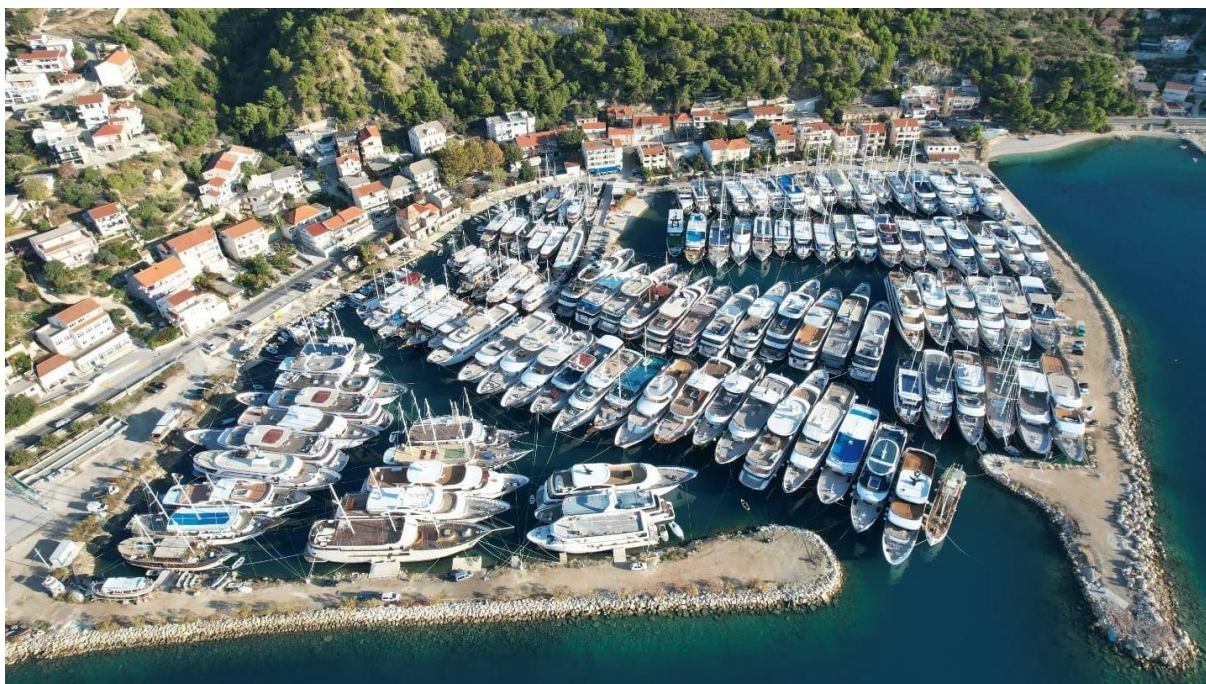
Slika 36: Luka u Krilu Jesenicama