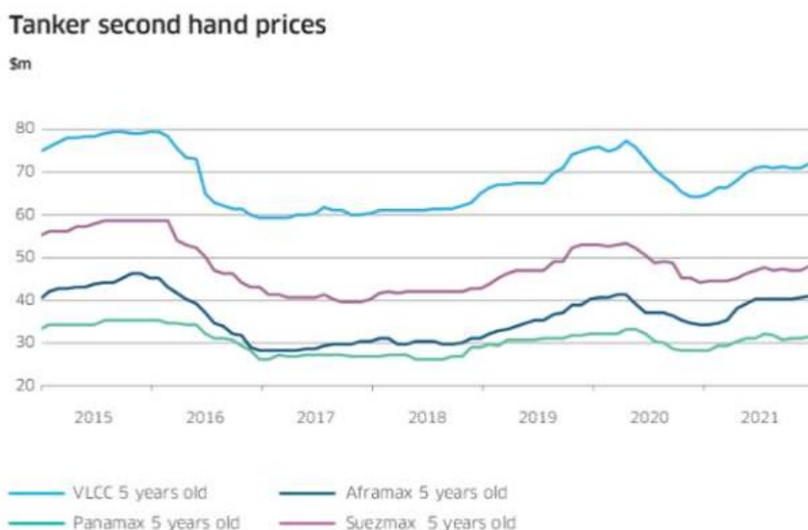
Slika 4. Grafički prikaz kretanja cijena polovnih tankera