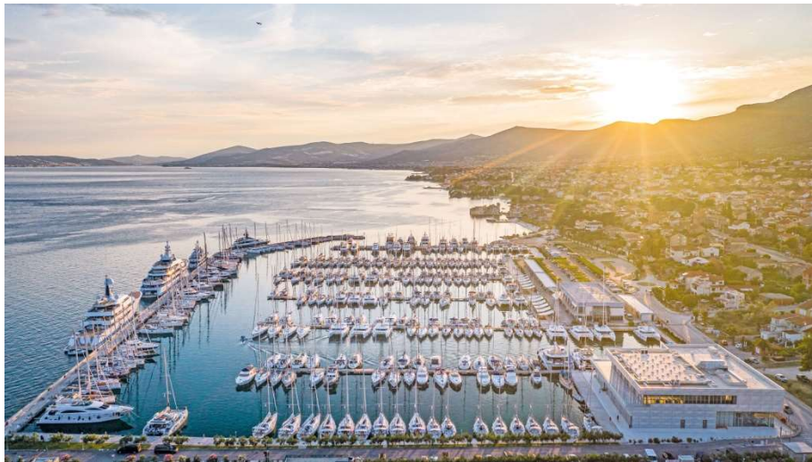
Slika 2. Marina Kaštela – primjer otvorenog tipa marine

Ovisno o položaju akvatorija razlikuju se: otvoreni, poluuvučeni i potpuno uvučeni tip marine. Svaki tip marine prilagođava se okolnom terenu i uvjetima izgradnje. Otvoreni tip marine je potpuno otvoren i nema zaklon u obliku kopnenog dijela obale. Poluuvučeni tip ima djelomično zaklonjen ulaz u marinu, dok uvučeni tip marine ima potpuno zaklonjenu marinu čime je i utjecaj vjetrova i valova znatno manji.