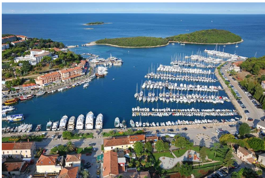
Slika 3. Marina Vrsar – primjer poluuvučenog tipa marine