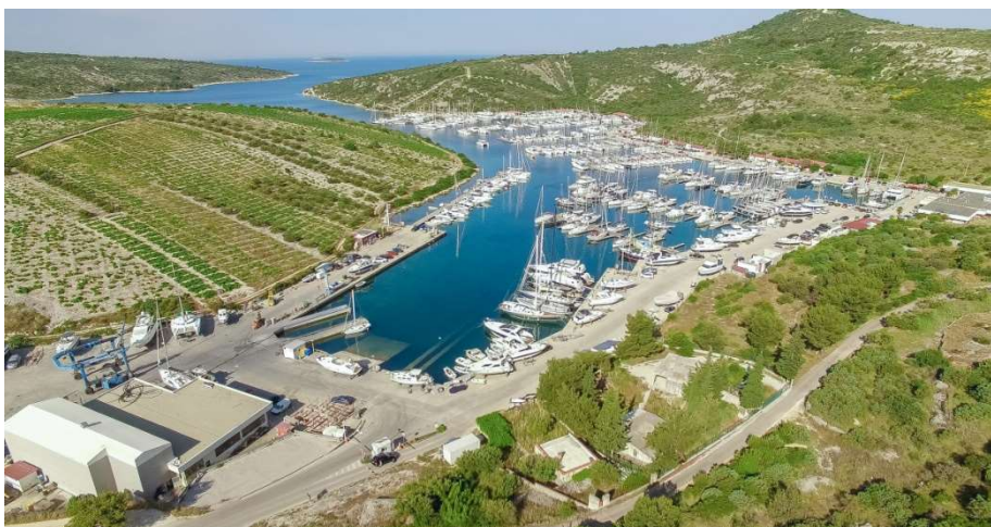
Slika 4. Marina Kremik – primjer potpuno uvučene marine