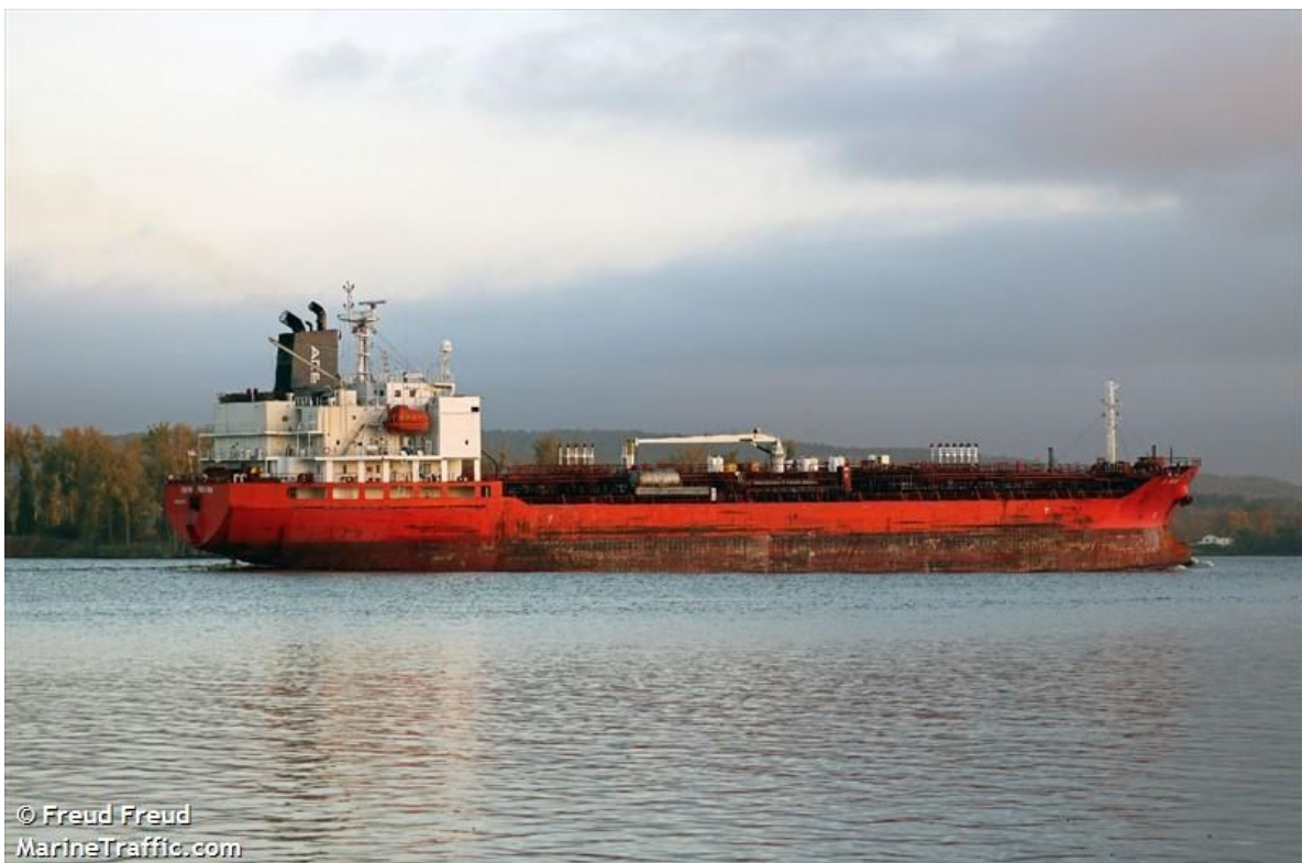
Slika 4: Tip 3 broda

Izgrađeni su s odgovarajućim mjerama zadržavanja radi sprječavanja curenja ili izlivanja i imaju odgovarajuće sustave za rukovanje teretom. Brod veći od 225 metara po cijeloj dužini dvostruka oplata. Od 125 do 225 m moraju izdržati oštećenja po cijeloj dužini osim stroja. Manji brodovi od 125 metara po cijeloj dužini osim iza strojarnice. Sposobnost izdržavanja naplavlivanja strojarnice treba odrediti odgovorni klasifikacijski zavod. Još se može reći da brodovi za prijevoz kemikalija nazivaju parcel tankeri ili višenamjenski tankeri. To su specijalizirani brodovi dizajnirani za prijevoz više vrsta tekućih kemijskih tereta istovremeno te ih karakterizira velik broj tankova