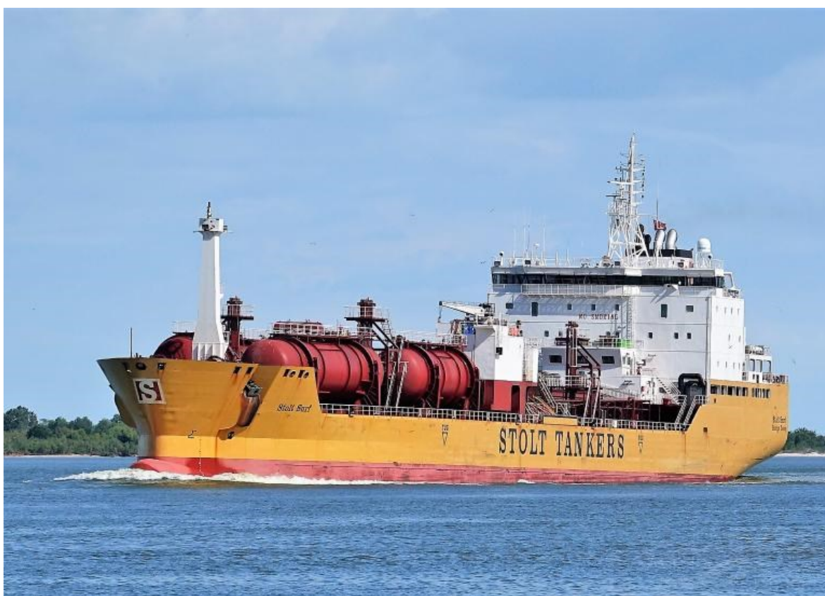
Slika 2: Tip 1 broda

uključuju tvari koje su otrovne, vrlo reaktivne ili predstavljaju značajan rizik za okoliš. Tankeri tipa 1 izgrađeni su s naprednim strukturnim i operativnim značajkama kako bi se osigurao siguran prijevoz takvih tereta. Ovi tankeri obično imaju visok stupanj segregacije i opremljeni su specijaliziranim sustavima za rukovanje teretom, nadzor i hitno reagiranje. Udaljenost između tanka i brodske oplate ne smije biti manji od omjera B/5, gdje je B širina broda, ili 760 mm. Volumen tankova na ovom tipu broda je 1250 m 3 . Maksimalna visina dvostrukog dna B/15.