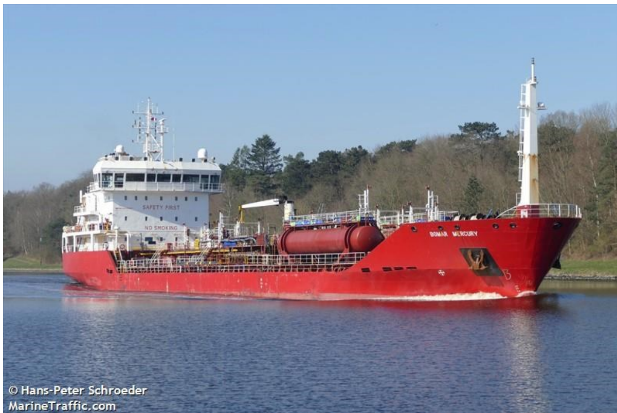
Slika 3:Tip 2 broda