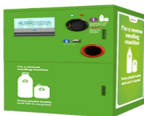
Slika 2. Povratak automatom