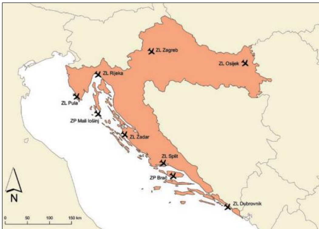
Slika 3. Zračne luke i zračna pristaništa u RH

Na sljedećoj slici su prikazane zračne luke i zračna pristaništa u RH. Kao što je ranije spomenuto, RH ima 7 zračnih luka raspoređenih u kopnenom i jadranskom dijelu te 2 zračna pristaništa koja se nalaze na otocima.