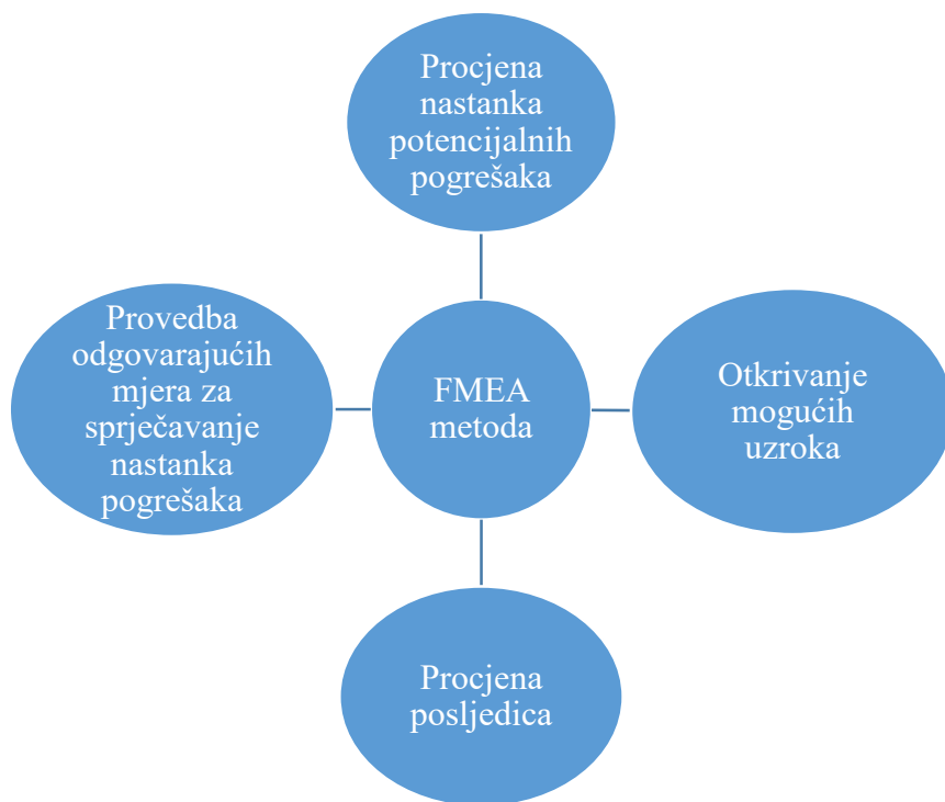
Slika 1. Zadaci FMEA metode