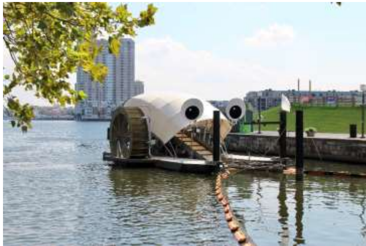
Slika 8. Mr. Trash Wheel

Mr. Trash Wheel samo je jedan od mnogih inovativnih uređaja i tehnika koji se koriste za uklanjanje otpada iz vode i zaštitu okoliša od onečišćenja.