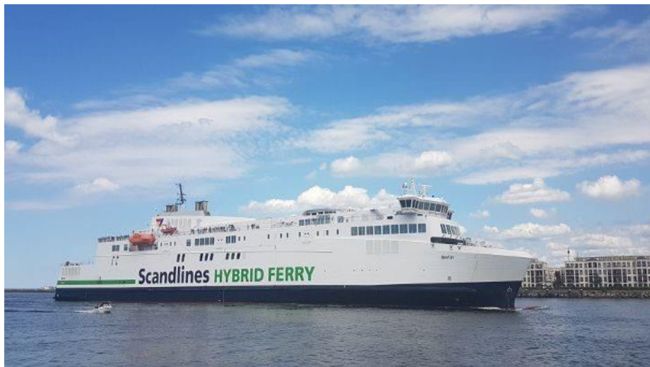
Slika 13: Brod u floti kompanije Scandlines