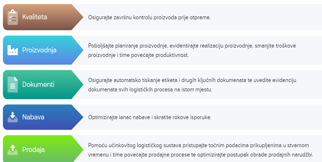
Slika 2. Operacije skladišta

Glavna svrha WMS-a je osigurati da se roba i materijali kreću kroz skladište na najefikasniji i najisplativiji način. Ovaj sustav upravlja različitim funkcijama koje omogućuju ovo kretanje, kao što su praćenje inventara, komisioniranje (sastavljanje narudžbi), primanje i skladištenje. WMS povezuje dvije različite sfere koje obično nisu povezane - jednu koja se odnosi na tehnologiju, logiku i softver te drugu koja obuhvaća fizičke radne aktivnosti poput upravljanja viličarima i transportnih traka.