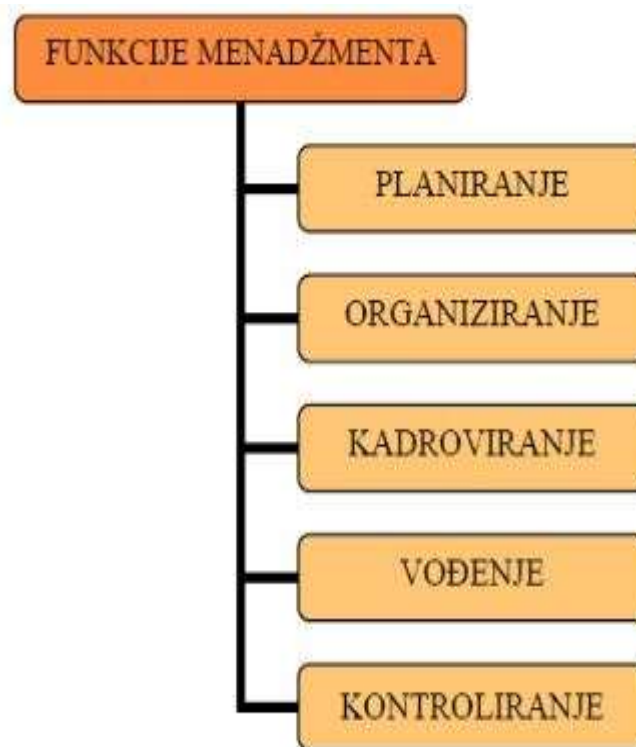
Slika 1. Funkcije menadžmenta

Generalno je prihvaćeno da je menadžment svojevrsna znanost ali i umjetnost upravljanja. Menadžeri odnosno direktori svoje zadatke obavljaju na jedan poseban osoban stil koji se zasniva na osobnim idealima odnosno stavovima. Prvu podjelu menadžmenta predstavio je francuski rudarski inženjer Henri Fayol za kojeg se tvrdi da je tvorac klasične teze menadžmenta. Dotični je rasporedio segmente menadžmenta smislenim rasporedom prema pojedinim osnovnim komponentama menadžmenta kao što su kontroliranje, vođenje, planiranje, kadroviranje i organiziranje.