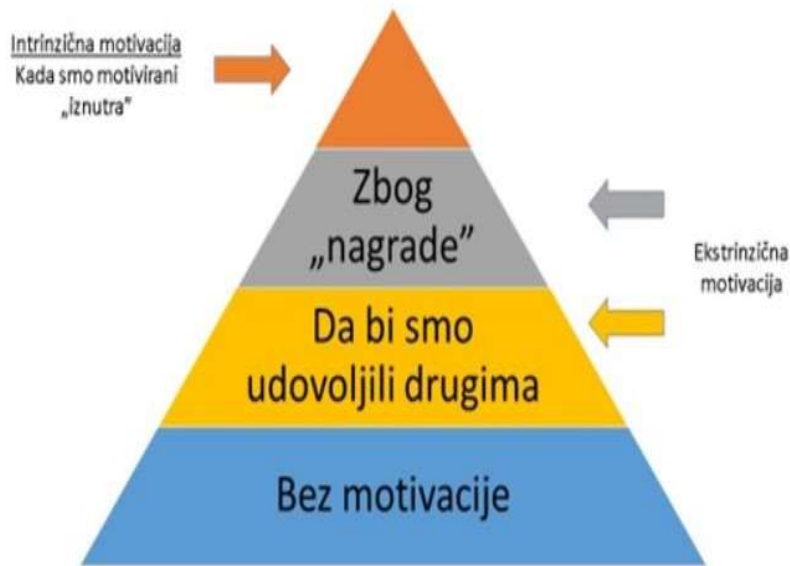
Slika 5. Motivacija; [11].