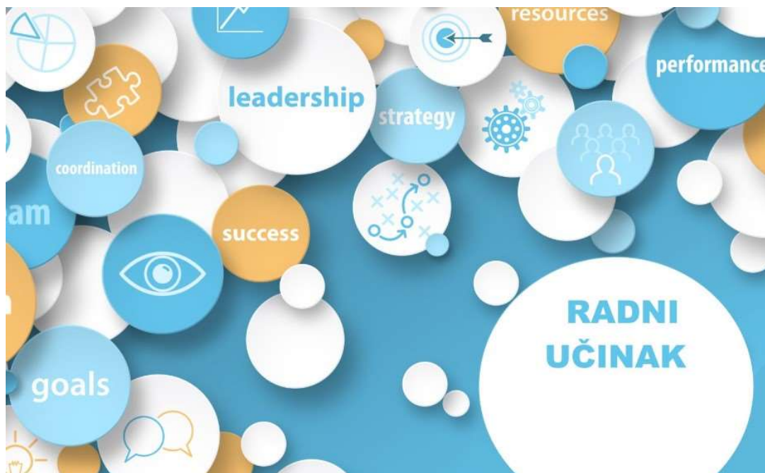
Slika 6. Radni učinak; [14].