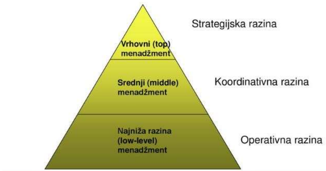
Slika 2. Razine upravljanja; [6].