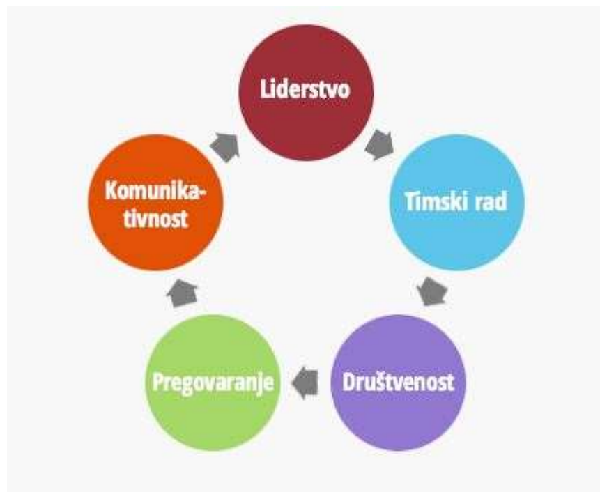
Slika 4. Rad s ljudima; [8].