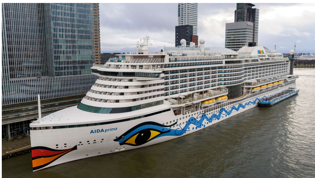
Slika 4. Prikaz opskrbe putničkog broda AIDAprima sa 140mt B100 biodizela u luci Rotterdam

Neke brodarske kompanije već neko vrijeme koriste biogoriva kao izvor energije, ali još uvijek većina tih brodova nije potpuno prešla na biogoriva. Nekoliko je razloga za to, ali glavni bi razlog bio da većina tih brodova u početku nije bila namijenjena za korištenje biogoriva. Takvi brodovi su bili namijenjeni za fosilna goriva, a kako ne bi morali radit preinake na njima koriste mješavinu fosilnog goriva i biogoriva. Najčešće mješavine koja se koristi je B30, što znači da u mješavini ima 30% biogoriva i 70% fosilnog goriva. Norwegian cruise line holdings LTD je jedan od predvodnika korištenja ove vrste goriva. Trenutačno eksperimentalno koristit ove mješavine biogoriva na 20% brodova svoje flote i tvrde da će do 2030. godine testirati ove mješavine na svim njihovim brodovima. Već spomenuti Carnival Corporation ujedno vlasnik Holland America Line i AIDA Cruises ipak čini najveći utjecaj u globalizaciji korištenja biogoriva, počevši od toga da su 2022. godine u svojoj floti imali prvi veliki putnički brod koji je bio opskrbljen B100 biogorivom. Tako je AIDAprima postala prvi brod s potpuno alternativnim izvorom energije, kombinirajući LNG i biogoriva.