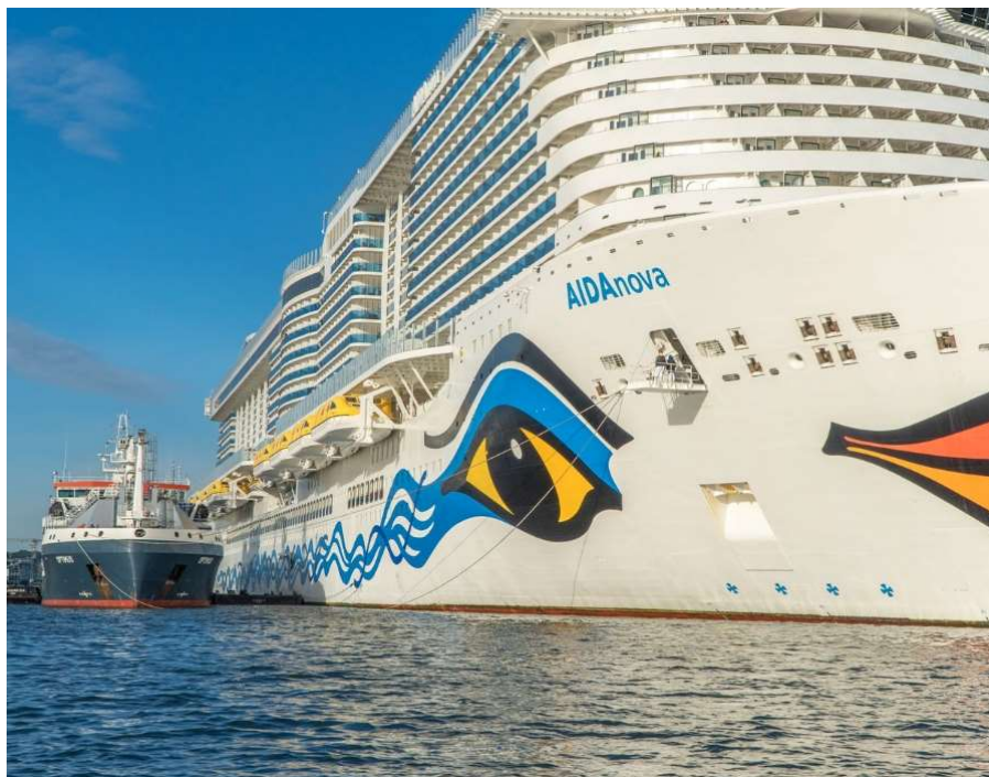
Slika 1. Prikaz opskrbe LNG-om putničkog broda AIDAnova

Zatim se 2018. godine pojavljuje AIDAnova koja donosi nešto zaista revolucionarno u svijetu putničkog prijevoza. AIDAnova je prvi putnički brod pogonjen u potpunosti LNG-om u luci, ali i na otvorenom moru. Ovo je bio iznimno veliki poduhvat i veliki izazov za brodogradilište MEYER WERFT jer su morali proizvesti prvi brod ove vrste. Gotovo deset godina se usavršavala tehnologija i konstrukcija ovog broda. Brod porivnu silu stvara pomoću četiri Caterpillar hibridna motora na dva goriva, LNG i klasično dizel gorivo. Ovo je naravno velika prednost jer time omogućava da brod nije ovisan samo o jednoj vrsti goriva. Iako se mogu koristiti dva različita goriva, motori ne gube na snazi neovisno o kojem se gorivu radi. Svaki od ova četiri motora isporučuju 20998 konjskih snaga što je ukupno 83970 konjskih snaga ili 61760 kW. Promjena goriva koje motori koriste moguće je i bez prekida rada stroja čak i dok je stroj pod opterećenjem. Jedini manji problem dolazi kod samog paljenja, radi niske kvalitete zapaljivosti prirodnog plina pri početnom zapaljenju potrebno je dodati manju količinu dizela kako bi se stvorila početna iskra.