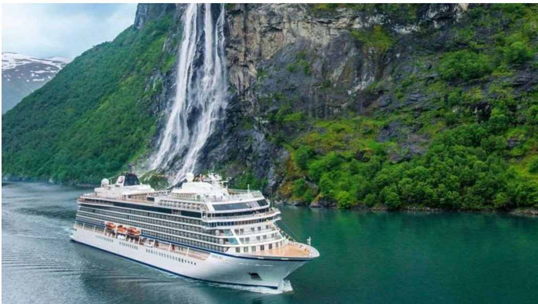
Slika 2. Putnički brod Viking Neptun

Primjer broda koji koristi gorive ćelije na bazi vodika kao djelomični izvor energije je Viking Neptun . Na ovom brodu je jedna takva tako zvana baterija snage oko 100 kW koja radi kao PEM gorivi članak. PEM gorivi članak je skraćenica za engleski naziv Proton exchange membrane fuel cell . To su gorive ćelije s polimerskom membranom s platinom i služi kao elektrolit za izmjenu električnog naboja. Platina se koristi ovdje kao katalizator, točnije kako bi ubrzao kemijsku reakciju jer za sada nema drugih katalizatora koji djeluju toliko učinkovito na temperaturama od 80°C. S desne i lijeve strane membrane nalaze se elektrode anoda ili negativna strana, i katoda ili pozitivna strana. Prema anodi struji vodik, a prema katodi struji mlaz zraka s minimalnom zasićenošću od 21% kisika. Tokom ovog procesa dolazi do oksidacije na katodi i odvajanja elektrona od jezgre atoma vodika. Elektroni vodika zatim vodičem iz anode odlaze do potrošača, a protoni kroz elektrolitsku membranu prelaze u katodu i tamo se vezuju na molekule kisika. Rezultat ove elektrokemijske reakcije je topla voda. Važna prednost ove tehnologije je da u odnosu na druge gorive članke ima veliku snagu po jedinici volumena, a glavna mana da je ovaj sustav osjetljiv na ugljični monoksid i sumpor.