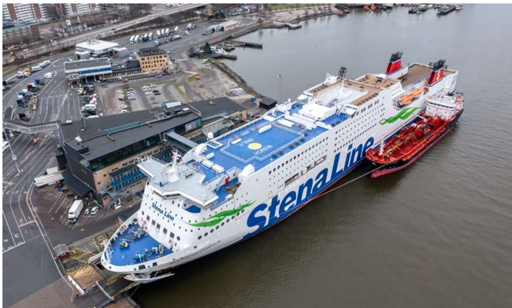
Slika 3. Prikaz opskrbe metanolom putničkog broda STENA GERMANICA