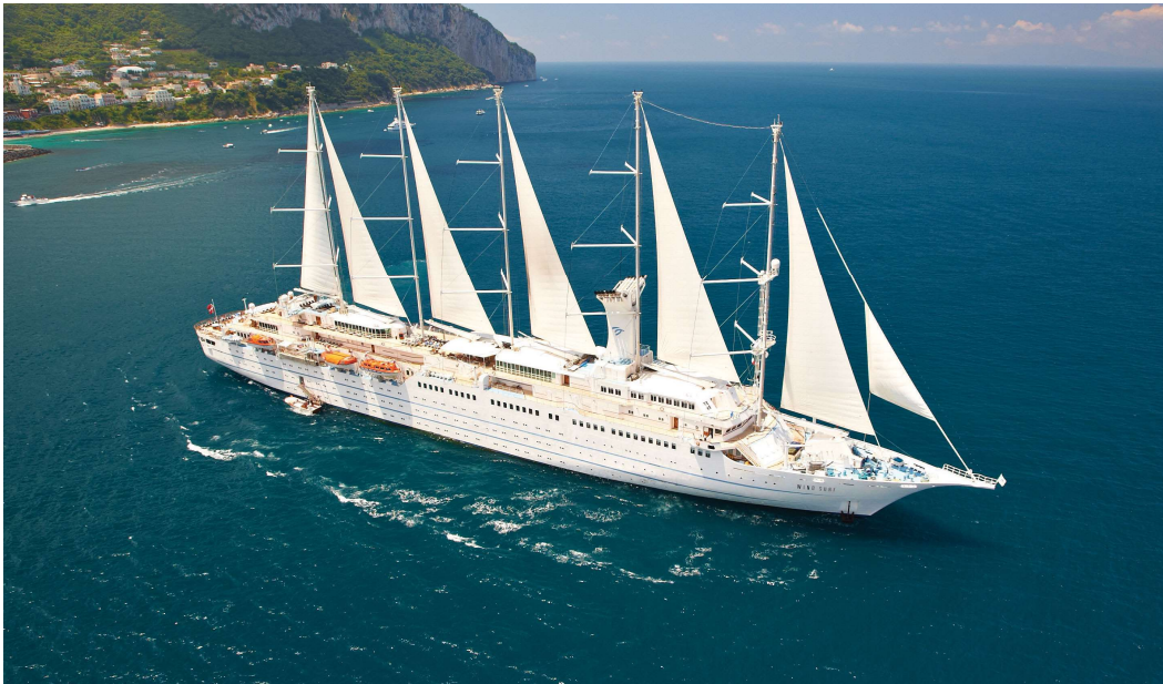
Slika 7. Putnički brod Wind Surf

motore s unutarnjim izgaranjem kao rezervu. Jedna od takvih kompanija je Windstar Cruises , koji u svojoj floti posjeduju tri putnička broda sa jedrima. Najveći u floti je Wind Surf s dužinom preko svega 187 metara i kapacitetom od 386 putnika.