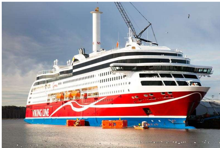
Slika 6. Instalacija Flettnerovog rotora na putnički brod Viking Grace

Prvi putnički brod koji je eksperimentalno isprobao ovu tehnologiju 2018. godine bio je trajekt Viking Grace . Ovaj brod nije izvorno koristio ovu tehnologiju već je naknadno ugrađena na njega, te je bilo potrebno dobiti nove svjedodžbe za brod. Na brod je postavljen samo jedan Norsepower rotor visine 24 metra i promjera 4 metra. Provedeno je istraživanje od strane tri nezavisna istraživačka tijela ( ABB, Chalmers University, and NAPA ) i analiza Norsepower -a. Sve četiri studije potvrdile su smanjenu potrošnju snage od 207-315 kW što je ekvivalentno 231 do 315 tona goriva godišnje, što je u okvirima postavljenog cilja projekta.