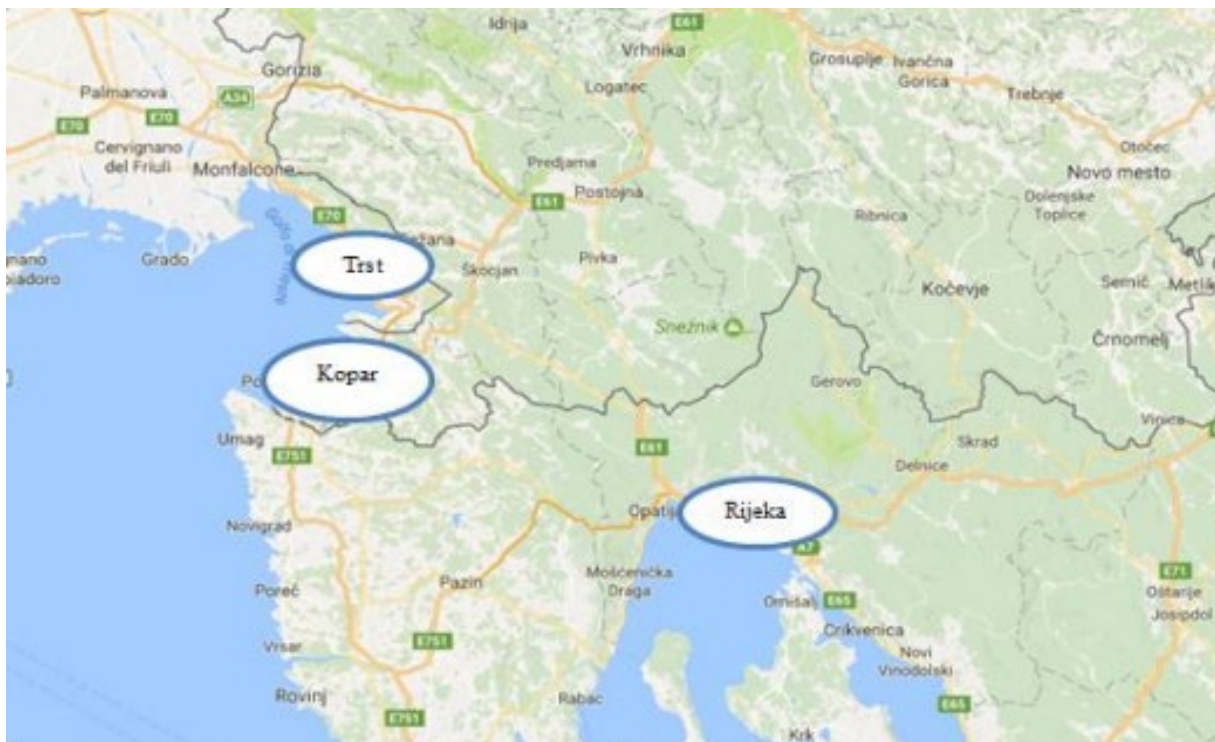
Zemljovid 1. Položaj luke Rijeka, Kopar i Trst