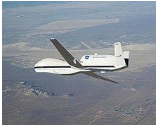
Slika 8. Obilježja QR – 4 Global Hawk