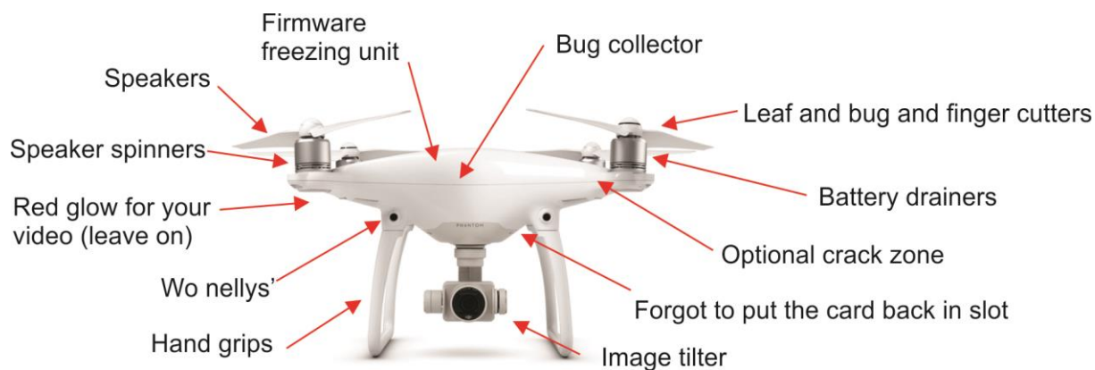
Slika 4. Glavni dijelovi drona