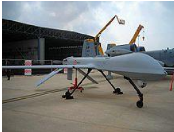
Slika 7. MQ-1 Predator bespilotne letjelice