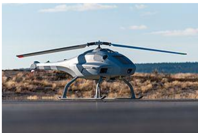
Slika 12. Saab Skeldar