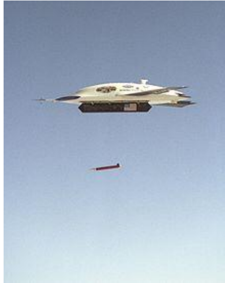
Slika 9. X- 45 bespilotne letjelice