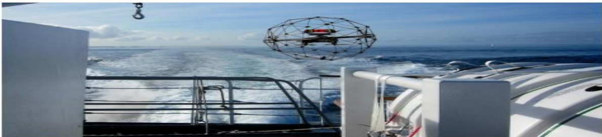
Slika 10. Prikaz BL u letu iznad brodske palube

Za prikupljanje podataka o kitovima razvijena je bespilotna letjelica SnotBot. Bespilotna letjelica SnotBot se koristi za prikupljanje kitove sline kada dišu na površini mora. SnotBot uređaji mogu prenijeti prikupljene uzorke istraživačima na brodovima koji su na udobnoj udaljenosti od kitova. Pametnim i povezanim tehnologijama ćemo se koristiti kada preuzimamo podatke s bespilotnih letjelica na uređaje koji pokreću algoritme, a koji mogu prepoznati određenog kita i procijeniti njegovo zdravstveno stanje u stvarnom vremenu.