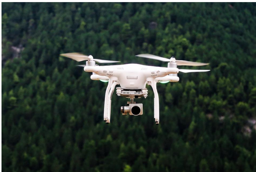
Slika 3. Беспilotna letjelica

Rezultati dostignuti letjelicama koje su sposobne za letenje pokazuju da se granice brzine približavaju trostrukoj brzini zvuka i da se poboljšavaju sve ostale karakteristike svih vrsta letjelica. Najbolje letjelice današnjice identično kao i oni najbolji koji su se pojavljivali kroz povijest služe na čast i ponos svojim zrakoplovstvom i onim državama koje su ih dizajnirale, konstruirale i proizvele. Kao i uvijek te letjelice predstavljaju tehnički najsavršenije vrste letjelica u čiji su ustroj ugrađeni najkompleksniji i najubojitiji sustav. Svojim pilotima one i dalje daju dobar osjećaj zračne premoći koju moraju osigurati. Bez sumnje i u budućnosti će višenamjenske letjelice predstavljati vrhunac zračne avijacije. Ono što će se promijeniti je činjenica da će u budućnosti njima više neće upravljati piloti u njihovim kabinama. Tako je došlo do razvoja bespilotnih letjelica koje su već istisnule zrakoplove s ljudskom posadom ubuduće se slijediti njihova potpuna afirmacija u jurišnim zadaćama s korištenjem visoko preciznog naoružanja čija se nosivost povećati a kao završni stupanj evolucije uslijediti će pojava bespilotnih letjelica za zaštitu zračnog prostora, ali ne u takvoj bliskoj budućnosti.