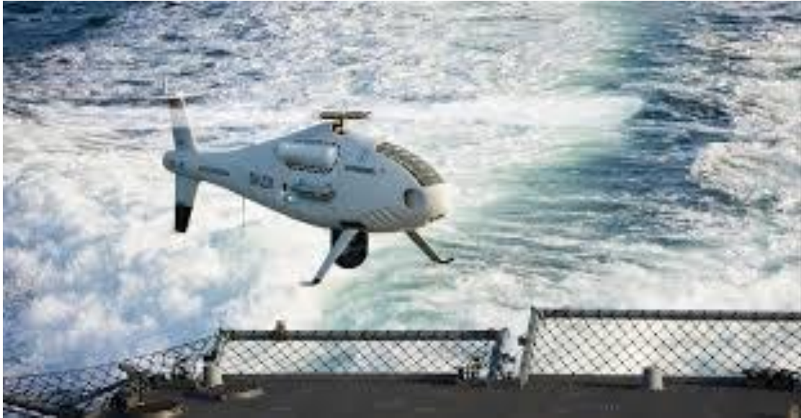
Slika 11. Pomorski nadzor putem dronova