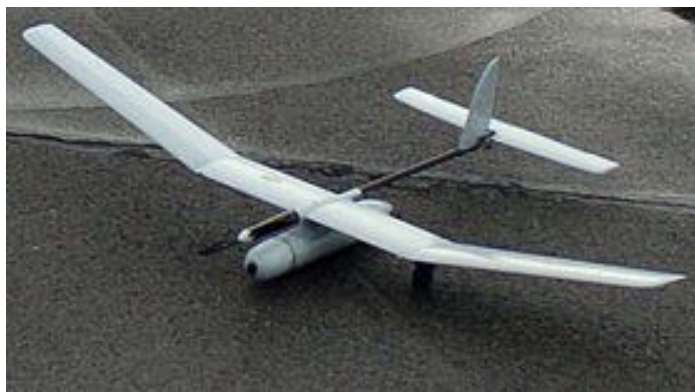
Slika 5. Elbit Skylark