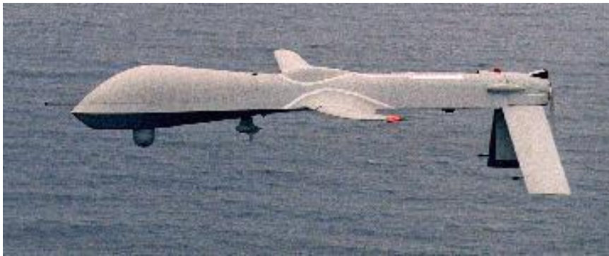
Slika 6. Obilježja RQ-1 Predator