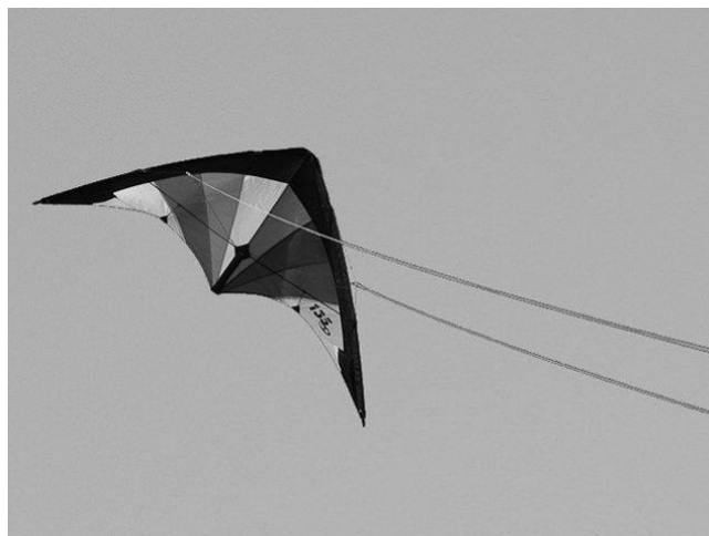
Slika 2. Kineski zmaj – letjelica

Kina je domovina zmajeva – letjelica koje su izumljene prije 2500 godina. Najstariji kineski zmajevi – letjelice su bili od bambusa i drva. Također su izrađeni od svile i papira. U raznim se razdobljima zmajevi – letjelice izrađivani od različitog materijala, a imali su različite oblike i imena. Prvenstveno su se koristili u vojne svrhe kao što su trigonometrijska mjerenja udaljenosti, određivanje smjera vjetra ili odašiljanja poruka. Također su služile kao sredstvo komuniciranja. No protekom vremena zmajevi- letjelice se počinju koristiti za zabavu. Zmaj – letjelica postaje poznat cijelom svijetu . Nizozemski trgovci su imali važnu ulogu pri uvozu zmajeva – letjelica u Europu. Nakon 13. stoljeća korištenje zmajeva – letjelica se proširuje na zemlje Europske unije.