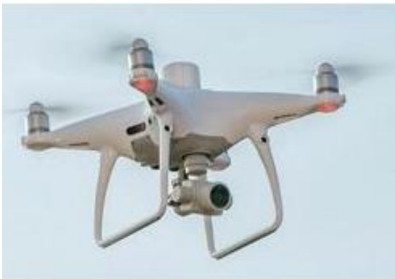
Slika 1. Dron

U nedavnoj prošlosti dronovi su se najčešće povezivali s vojskom, gdje su prvenstveno koristili za protuavionske ciljne vježbe, za prikupljanje obavještajnih podataka te kao platforme za naoružanje. Danas se dronovi koriste i za pretraživanje i spašavanje, nadzor, praćenja prometa, nadgledanja vremena, usluge dostave, prijevoza ranjenika i bolesnika, poljoprivredi, meteoroloških motrenja, geodetsku izmjeru, arheološke i dr. svrhe.