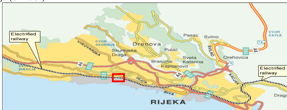
Slika 3. Željeznički sustav grada i luke Rijeka

Željeznica i željeznički kolodvor Rijeka nisu adekvatno opremljeni za prihvatanje tereta, no ulaskom u Europske integracije transport tereta željeznicom postat će primarni način transporta tereta. Željeznička pruga koja prolazi kroz Rijeku je elektrificirana jednostručna pruga smještena u neposrednoj blizini centra grada i lučkog područja (Slika 3.)