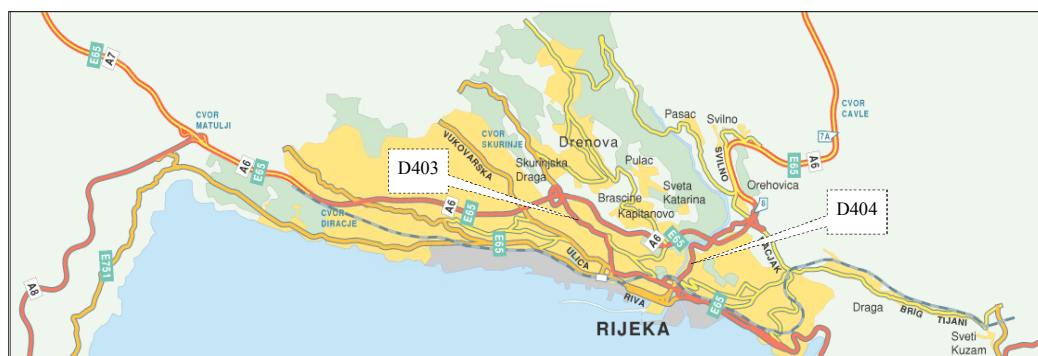
Slika 2. Kartografski prikaz cesta u zaleđu luke Rijeka

Značajnu ulogu u riječkom cestovnom čvoru imaju dvije prometnice, inače kategorizirane kao ceste od državnog značaja, ali koje imaju vrlo važnu ulogu u odvijanju ukupnog gradskog prometa te u rasterećenju gradskih ulica od teretnog prometa i dijela tranzita. To su ceste D403 i D 404, kao dvije brze spojne ceste koje vode od obilaznice – gradske autoceste – do lučkih bazena.