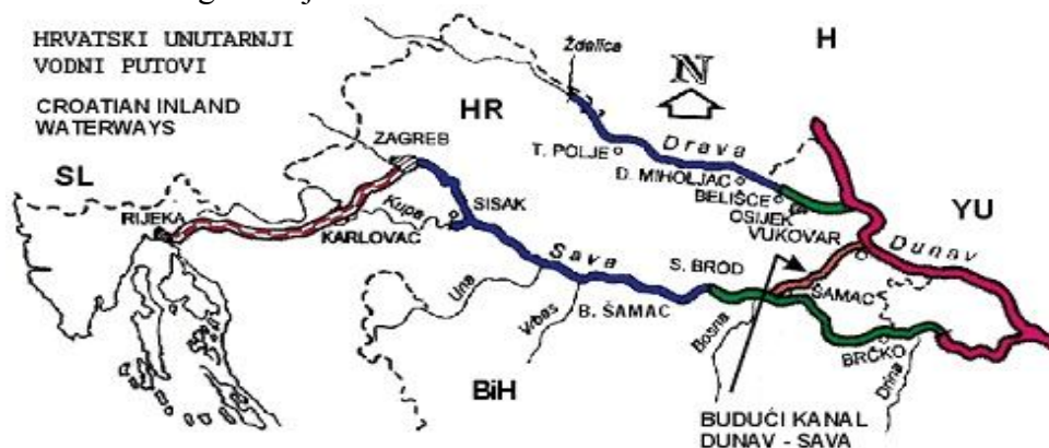
Slika 4. Hrvatski unutarnji vodni putovi

Hrvatski unutarnji vodni putovi dio su VII. Dunavskoga koridora. Njihova ukupna duljina, koja obuhvaća i planirani višenamjenski kanal Dunav – Sava, iznosi 805,2 km, od čega je 601,2 km integrirano u mrežu europskih vodnih putova od međunarodnog značaja.