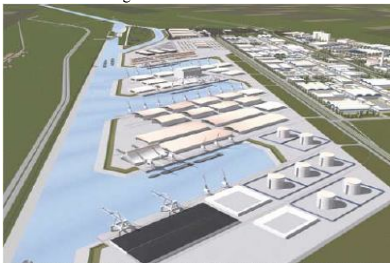
Slika 1.: Budući izgled luke Vukovar