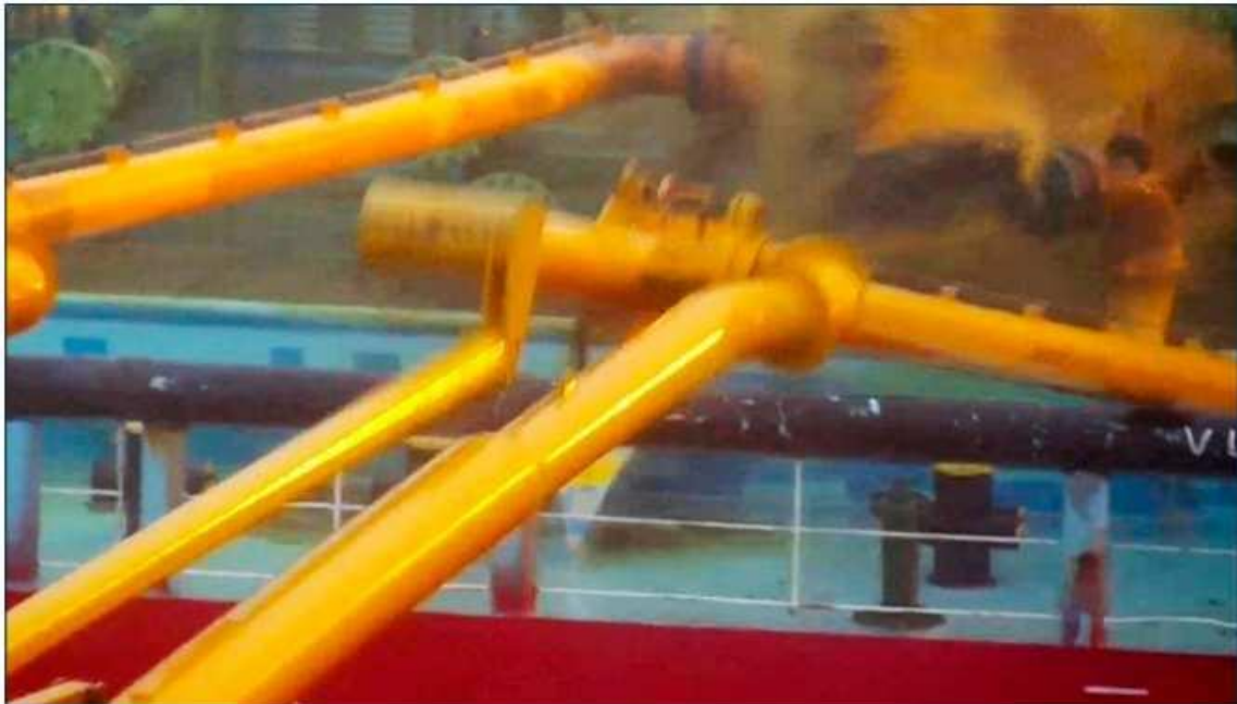
Slika 4 Fotografija s nadzornih kamera koja prikazuje pucanje prekrcajnih ruku

od pristaništa, ali brod je još uvijek bio usidren. Zvao je operatere terminala, ali nije uspio ući kontakt s njima. Umjesto toga, naredio je posadi da prereže četiri pramčana konopa. Operateri s terminala su čuli poziv gospodara, ali su bili prezauzeti hitnim zaustavljanjem operacije ukrcaja da bi odgovorili na poziv [9]. Dok se brodom manevriralo od pristaništa, špringovi su se olabavili, a operateri terminala su ih otpustili. Četiri krmena konopa za privez su istekla, sve dok više nije ostalo konopa na skladišnim bubnjevima na vitlima. U 09:41, brod se udaljio od pristaništa, a zapovjednik je obavijestio vlasti da je namjeravao nastaviti do sidrišta kako bi procijenio situaciju