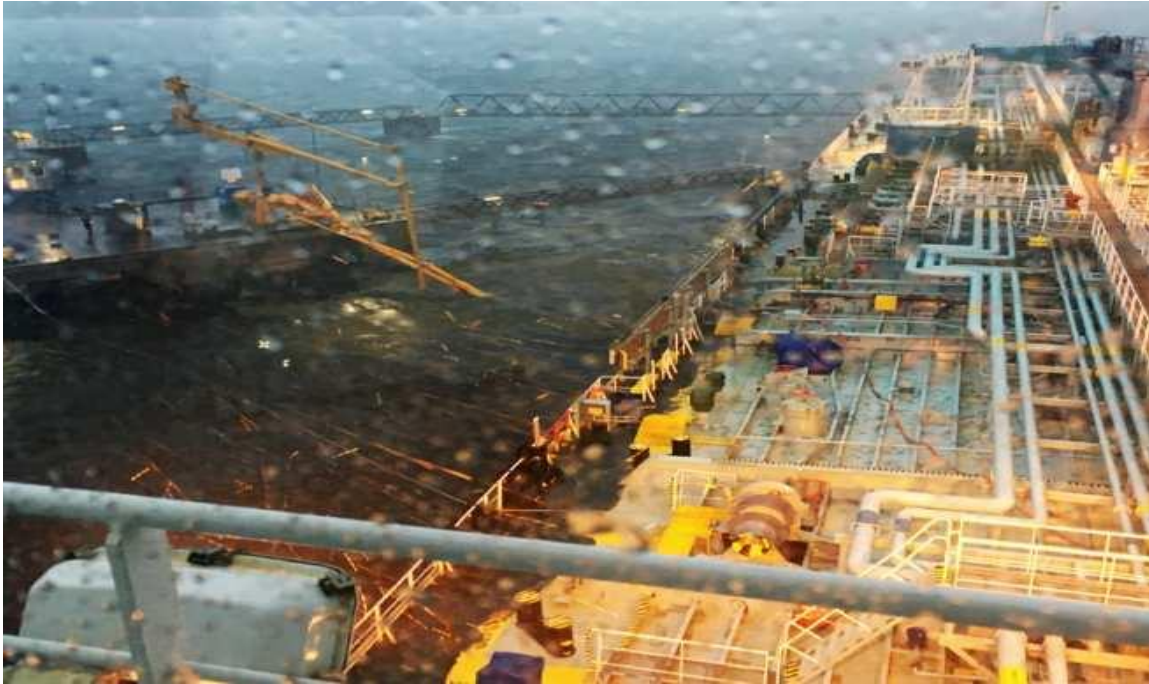
Slika 5 Pogled sa zapovjedničkog mosta u 0930