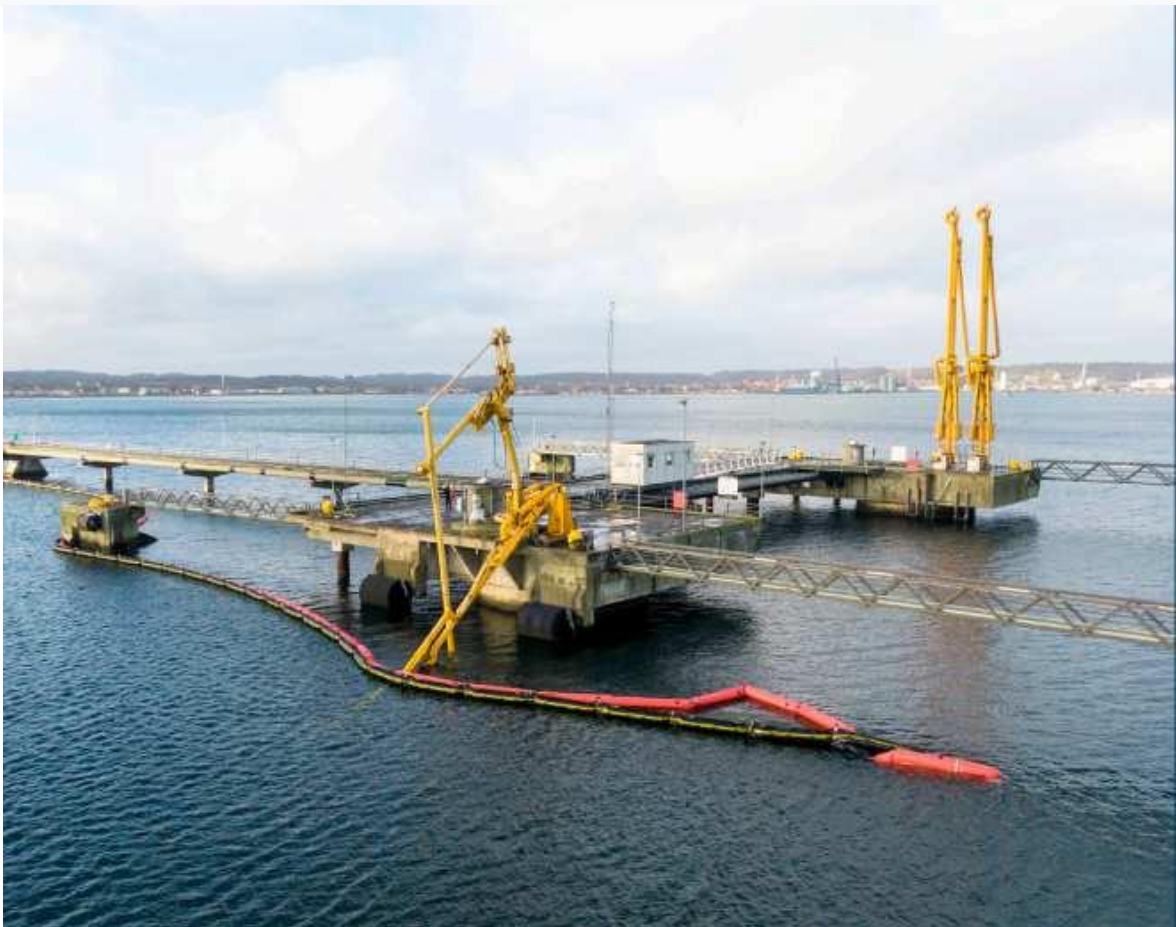
Slika 3 Ensted terminal nakon nesreće

karticu za razmjenu informacija, između ostalog o gazu broda, raspored priveza broda i karakteristike upravljanja brodom. Dodatno, zapovjednik i peljar su planirali prilazak i pristajanje na južnom molu terminala. Bilo je dogovoreno da će dva tegljača pomagati tijekom pristajanja; jedan bi tegljač bio na krmi, a drugi bi gurao na desnom pramcu [9]. Dogovorili su i shemu veza od 12 konopa: dva pramčana konopa, dva krmena konopa, dva pramčana bočna konopa, dva krmena bočna konopa, dva pramčana špringa i dva krmena špringa. Peljar je obavijestio zapovjednika da je struja uz unutrašnjost fjorda zanemariva. STONE I je zatim nastavio do naftnog terminala Ensted (slika 3)