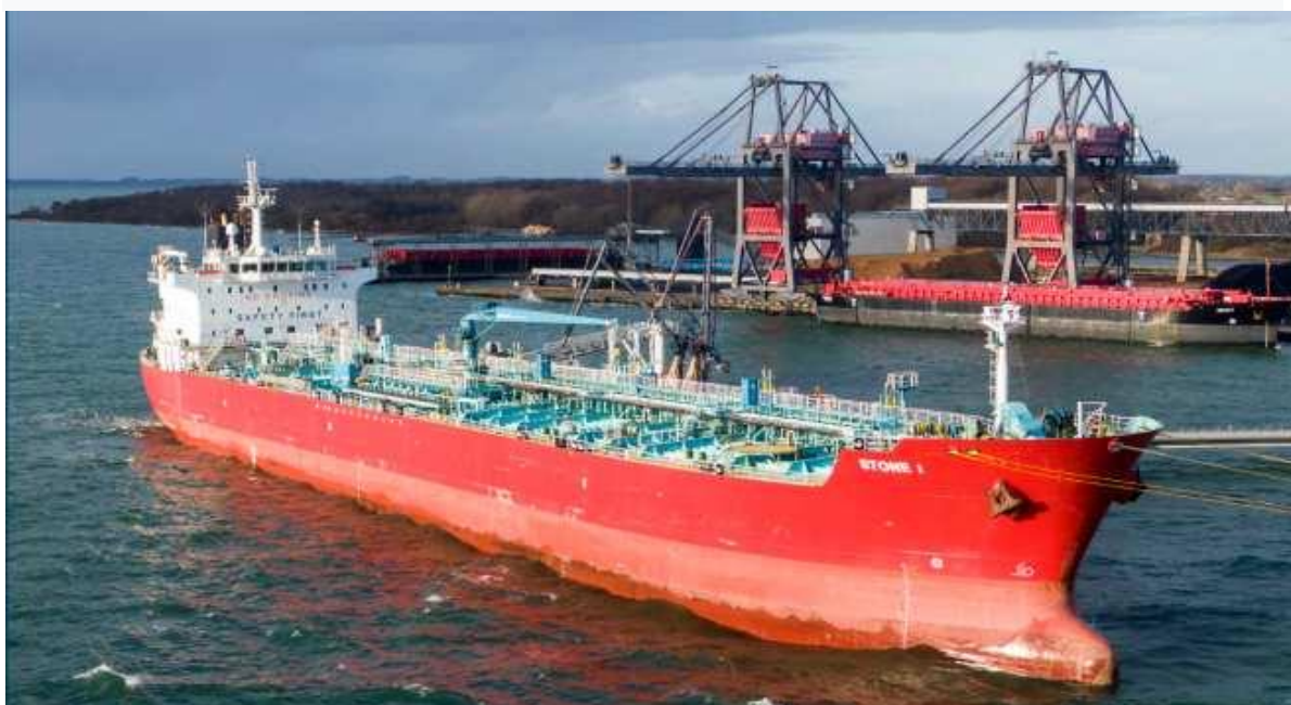
Slika 2 Brod STONE I

STONE I (slika 2) bio je registrirani tanker za kemijske/naftne proizvode Marshall Islanda koji je primarno plovio između luka u sjevernoj Europi. 2. siječnja 2020. brod je isplovio iz luke Hamburg u balastu i krenuo je prema naftnom terminalu Ensted u fjordu Aabenraa, Danska, gdje je brod trebao ukrcati vakuumsko plinsko ulje 4. siječnja 2020. bio je prvi posjet naftnom terminalu Ensted za posadu na STONE I. Ujutro 3. siječnja 2020, STONE I stigao je na sidrište ispred naftnog terminala Ensted čekajući vez [9]. Zapovjednik i njegovi časnici pregledali su vremensku prognozu i nisu očekivali loše vremenske uvjete tijekom boravka u luci.