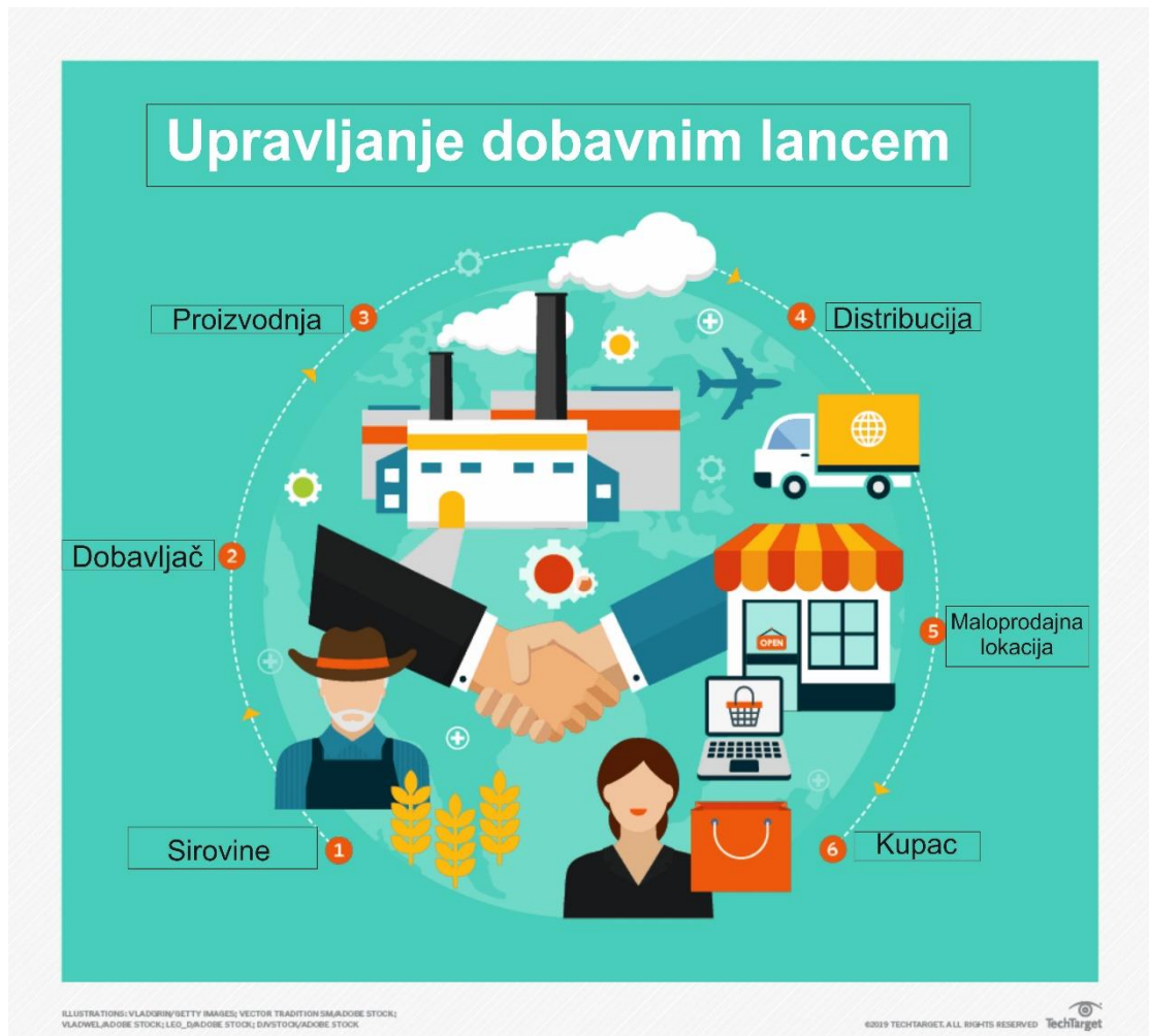
Shema 7: Aktivnosti i područja kojima upravlja SCM