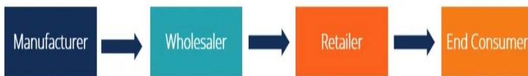
Shema 4. Kanal druge razine

Izvor: https://corporatefinanceinstitute.com/resources/knowledge/other/distribution-channel/