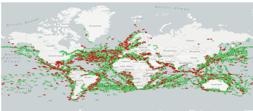
Slika 3. Prijevoz tereta teretnim brodovima

Prijevoz tereta teretnim brodom izrazito je siguran način prijevoza s obzirom da je krađa tereta takvim prijevozom teško ostvariva. 21