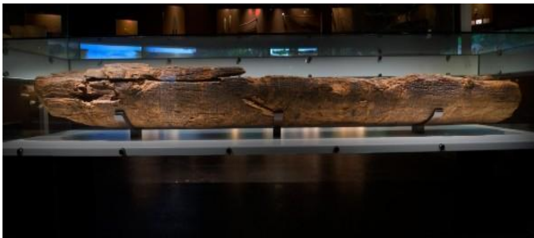
Slika 2. Kanu pronađen u Pessi

Prva poznata vodena plovila izrađena su prije oko 10 000 godina. Tadašnja plovila s obzirom na dostupnu tehnologiju imala su veliki broj ograničenja i najčešće su bila korištena za ribolov. Najstariji kanui, koji su pronađeni od strane arheologa, najčešće su bili napravljeni, to jest, izrezani iz crnogoričnih stabala pomoću alata napravljenih od kamena. Kanu, pronađen u Pessi, smatra se najstarijim vodenim plovilom ikada pronađenim. Na početku pronalaska arheolozi su imali određene sumnje da je taj pronalazak bio stvarno najstarije vodeno plovilo na svijetu, ali nakon što su napravili identičnu repliku zaključili su da je imao upravo tu svrhu, prevoziti ljude po vodama. Pronađen je 1955. godine izgradnjom autoceste. Dugačak je 3 metra i širok 44 centimetara. 17