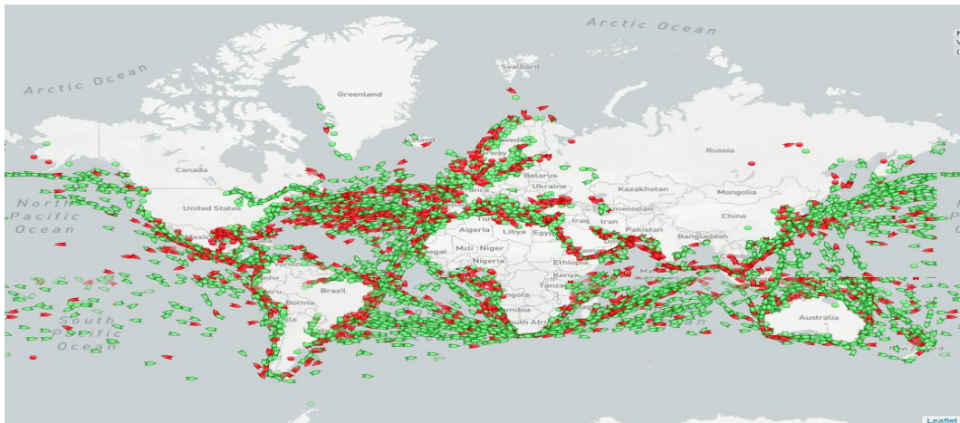
Slika 3. Prijevoz tereta teretnim brodovima

Prijevoz tereta teretnim brodom izrazito je siguran način prijevoza s obzirom da je krađa tereta takvim prijevozom teško ostvariva. 21