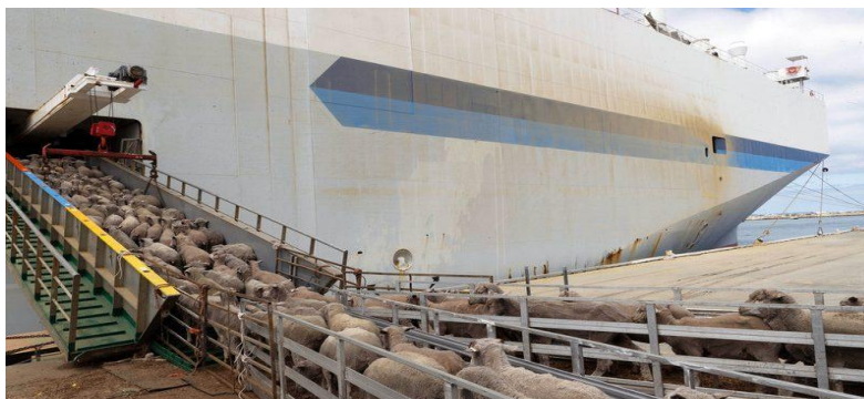
Slika 8. Prijevoz živih životinja

odgovara za gubitak, oštećenje ili zakašnjenje u predaji koji su posljedica posebnih rizika svojstvenih toj vrsti prijevoza. 92 Može se zaključiti da je prijevoz takvog tereta zaista složen posebice u pravnome svijetu, a odgovornost se teško procjenjuje.