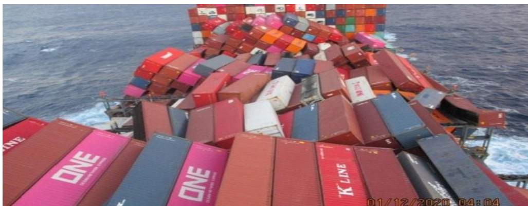
Slika 5. Štete na teretu

Šteta može nastati kao izravna posljedica štetnoga događaja (izravna, direktna šteta) i kao posljedica štetnoga događaja, ali uz sudjelovanje nekoga drugoga događaja ili posebnih okolnosti vezanih uz osobu ili stvar (posredna, indirektna šteta). 66