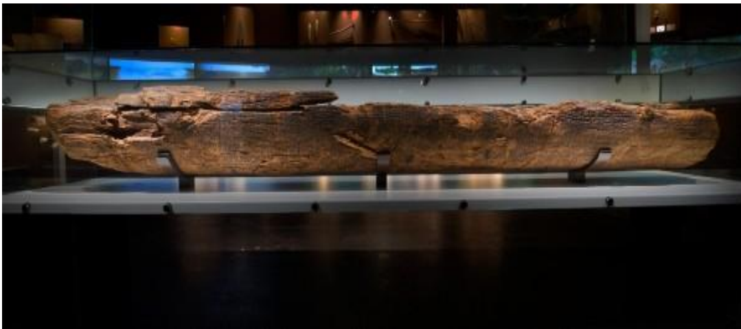
Slika 2. Kanu pronađen u Pessi

Prva poznata vodena plovila izrađena su prije oko 10 000 godina. Tadašnja plovila s obzirom na dostupnu tehnologiju imala su veliki broj ograničenja i najčešće su bila korištena za ribolov. Najstariji kanui, koji su pronađeni od strane arheologa, najčešće su bili napravljeni, to jest, izrezani iz crnogoričnih stabala pomoću alata napravljenih od kamena. Kanu, pronađen u Pessi, smatra se najstarijim vodenim plovilom ikada pronađenim. Na početku pronalaska arheolozi su imali određene sumnje da je taj pronalazak bio stvarno najstarije vodeno plovilo na svijetu, ali nakon što su napravili identičnu repliku zaključili su da je imao upravo tu svrhu, prevoziti ljude po vodama. Pronađen je 1955. godine izgradnjom autoceste. Dugačak je 3 metra i širok 44 centimetara. 17