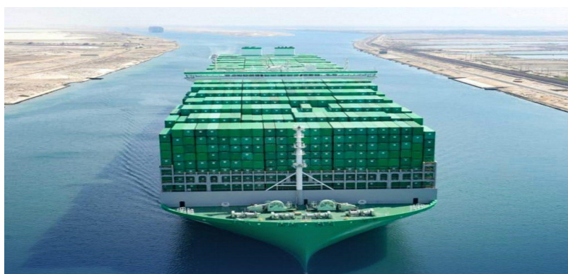
Slika 9. Kontejneri

Ovdje se teret skladišti i prevozi u transportnim kontejnerima različitih veličina. Vrsta tereta koji se prevozi određuje vrstu kontejnera u kojem će biti pohranjen. S obzirom na vrstu tereta koju prevoze kontejneri mogu se podijeliti na univerzalne kontejnere koji prevoze teret u određenoj vrsti ambalaže poput bačava, kutija, sanduka i vreća ili specijalne kontejnere koji su namijenjeni za prijevoz jedne vrste tereta odnosno istovrsnog tereta. Kontejneri su vremenski otporni te omogućuju brzo rukovanje teretom. Također pružaju sigurnost očuvanja tereta zbog svoje građe.