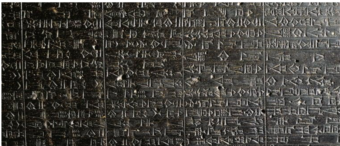
Slika 4. Hamurabijev zakonik

krivnje. U Italiji odgovornost prijevoznika je određena Trgovačkim zakonom iz 1882.godine. Njemačko pravo regulirano je svojim starim Trgovačkim zakonom iz 1861. godine. Zakon iz 1861. navodi skrivene mane broda kao višu silu koje se i dan danas koriste. Novi njemački Trgovački zakon zamjenjuje strogu odgovornost prijevoznika s pojmom dužna pažnja. Razvoj i ekspanzija pomorske trgovine počele su zahtijevati brz protok što je dovelo do razvoja linijske plovidbe a potom i teretnice. 39 Izrazito stroga odgovornost počinje gubiti na značenju još od Građanskog zakonika koji je dopuštao slobodu ugovaranja. Ogromni problemi počinju nastajati jer prijevoznici počinju zloupotrebljavati te unose u teretnice klauzule koje ih potpuno oslobađaju od bilo kakve odgovornosti. Prijašnju strogu odgovornost, koja je postojala gotova pa i dva tisućljeća, zamjenjuje se gotovo potpunom neodgovornošću. Gotovo pa svaka država je prihvaćala takve klauzule. Neke od država su Njemačka, Belgija, Rumunjska, Grčka, Nizozemska.... Na Jadranu su austrougarski sudovi potpuno priznavali valjanost klauzula neodgovornosti. 40