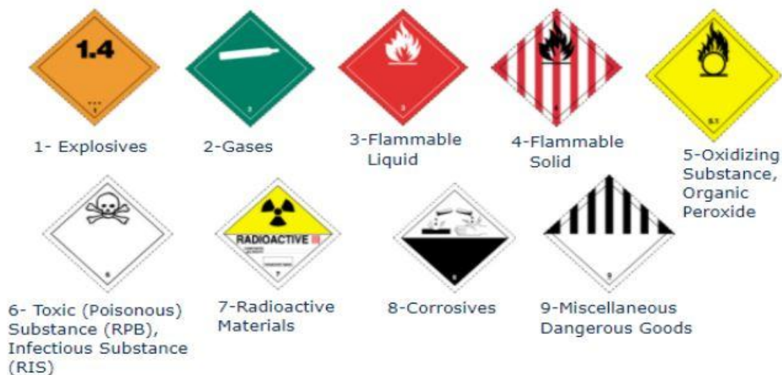
Slika 1. Oznake klasa opasnih tereta