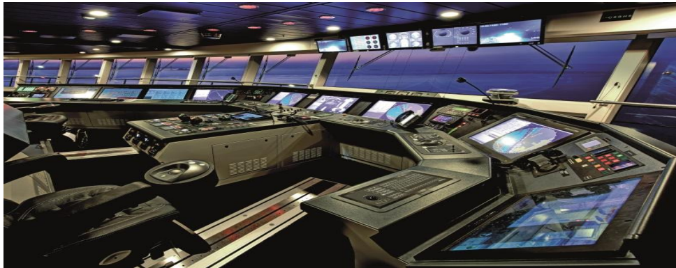
Slika 7. Navigacijski uređaji

radnjama njegovih djelatnika. Prijevoznik neće odgovarati ako osobe koje za njega rade postupaju izvan svog radnog zadatka. 75