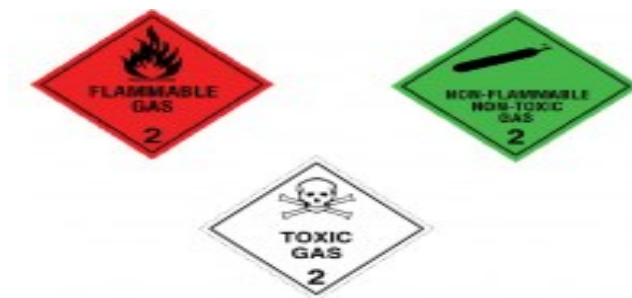
Slika 2 Oznake opasnih tvari klase 2.

Klasa 2 – pod klasu dva svrstavaju se plinovi, definirani kao tvari koje imaju temperaturu nižu od 50 Celzijevih stupnjeva ili na 50 Celzijevih stupnjeva tlak pare više od 3 bara i koji ako se pomiješaju sa zrakom mogu eksplodirati. 7