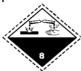
Slika 8 Oznaka opasnih tvari klasa 8.

Izvor: https://narodne-novine.nn.hr/clanci/medunarodni/full/2019_05_5_40.html (27.07.2022.)