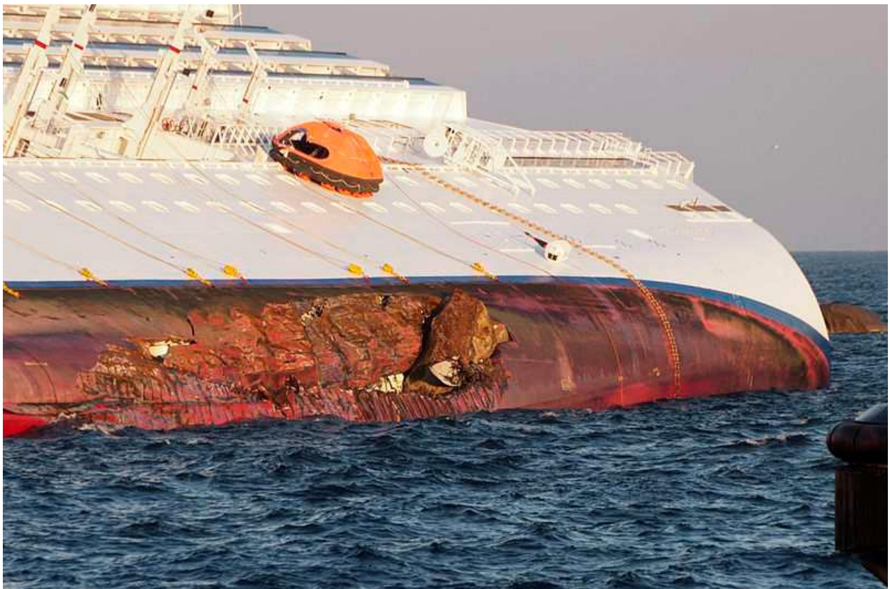
Slika 2. Prikaz Nasukanog broda Costa Concordije