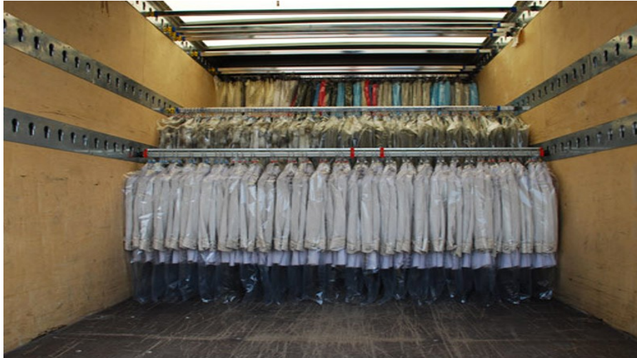
Slika 10. Prijevoz tekstila