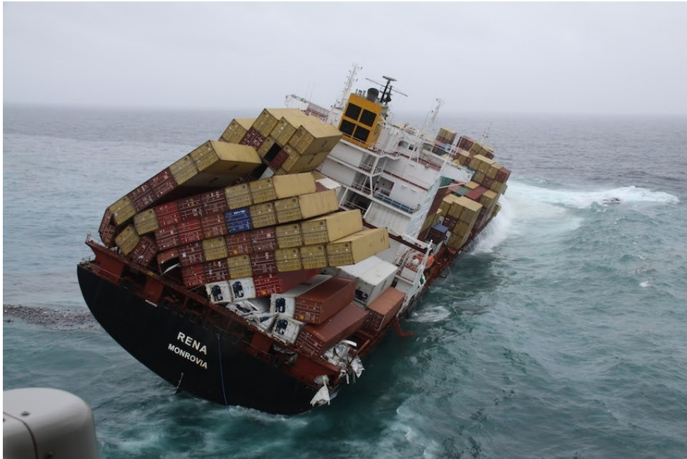
Slika 16. Šteta tereta u moru

Iako je za štetu odgovorna osoba koja je štetu i prouzročila, na brodaru je da tokom ukrcaja i iskrcaja obavlja stalni nadzor kako bi se štete mogle na vrijeme uočiti i spriječiti.