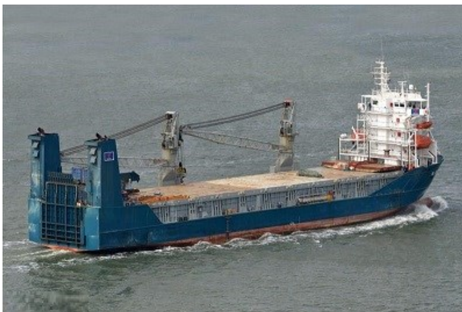
Slika 12. RO – LO brod

Pored klasičnih RO – RO, i LO – LO tehnologija prijevoza koje ću se dotaknuti u nastavku, postoji i kombinacija tih dviju tehnologija pod nazvom RO – LO, iliti Roll on – Roll off/ Lift on – Lift off , koja je kombinacija vertikalnog i horizontalnog iskrcaja i ukrcaja na specijalnim izrađenim brodovima koji sadrže tehnološke i tehničke značajke RO – RO i LO – LO brodova. Karakteristika RO – LO brodova je istovremeni ukrcaj i iskrcaj tereta, a ovisno o strukturi tereta odlučuje se koja će se tehnologija prijevoza koristiti u brodskom prostoru. S obzirom da je ove brodove teže i zahtjevnije napraviti, uveliko su skuplji od RO – RO i LO – LO brodova.