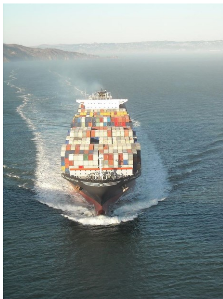
Slika 9. Kontejnerski brod MSC Charleston u plovidbi

Kontejner može sadržavati prazan prostor koji se pušta na kraju punjenja zbog kontroliranja i ograničenja težine. Ovisno o tipu robe koja se prevozi bira se odgovarajuća ambalaža. Na primjer u slučaju prijevoza tereta koji može sadržavati vlagu važno je da se papirom koji skuplja vlagu omotaju sve strane kontejnera te se dodatno ugrade vrećice za apsorpiranje vlage u kuteve kontejnera.