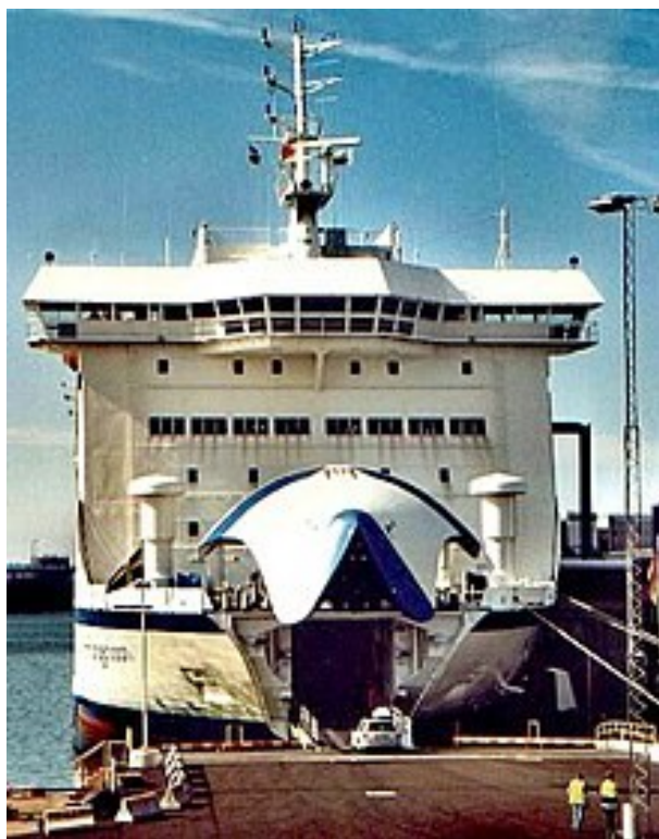
Slika 11. RO – RO brod