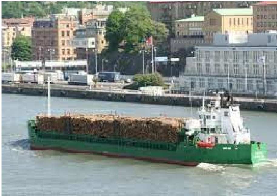
Slika 6. Prijevoz drveta morem

slaganja u kontejnere za razliku od tvrde drvene građe jer su dimenzije paketa standardizirane. Kontejneri s drvnom građom ukrcavaju se na način da se upotrijebe lučke prikolice ili kamioni s kojima se drvo prevozi uz sami bok broda te se pomoću dizalica vrši ukrcavanje kontejnera na teretni brod. Prije nego što se ukrcava teret na palubu, bitno je da su sve palubne površine čiste, da su sva skladišta zatvorena, stupovi za učvršćavanje postavljeni, te cjevovodi i ventili zaštićeni. Teret se slaže viličarima te je vrlo važno da je drvo složeno tako da ne izaziva smetnje u navigiranju. S obzirom na vanjske utjecaje, ističe se važnost pakiranja kako bi se proizvod maksimalno zaštitio. Iako se drvo najčešće prevozi klasičnim brodovima za generalni teret, drvo se danas može prevoziti svim teretnim brodovima.