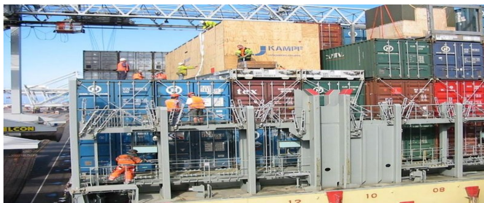
Slika 8. Pričvršćivanje kontejnera

Kontejnerski brodovi razlikuju se od brodova za generalni teret prvenstveno po konstrukciji. Razlikuju se i skladišta, koja u slučaju kontejnerskih brodova sadrže posebne ćelije za svaki kontejner. Najveći tehnički problem s kojim se suočavaju kontejnerski brodovi je problem strukture, gdje u usporedbi s konvencionalnim brodovima koji imaju prostranu i čvrstu palubu, kontejnerski brodovi glede slobodnog prostora imaju samo uske dijelove smještene između ćelijskih skladišta i bokova broda. Kontejnerski je brod jednostavne strukture. Ne sadrži međupalublja, kao ni posebne otvore na palubi i dizalice. Uzimajući u obzir da se prekrcaj pretežito obavlja uz pomoć dizalica na lučkim obalama, posjeduje vlastitu opremu za prekrcaj samo u iznimnim slučajevima. Većinski dio kontejnerskih brodova za pogon koristi dizelske motore, gdje se kao najveći i najsnažniji ističe dizelski motor ugrađen u brod Emma Mærsk, mase 2300 tona i pogonske snage od čak 109 000 konjskih snaga.