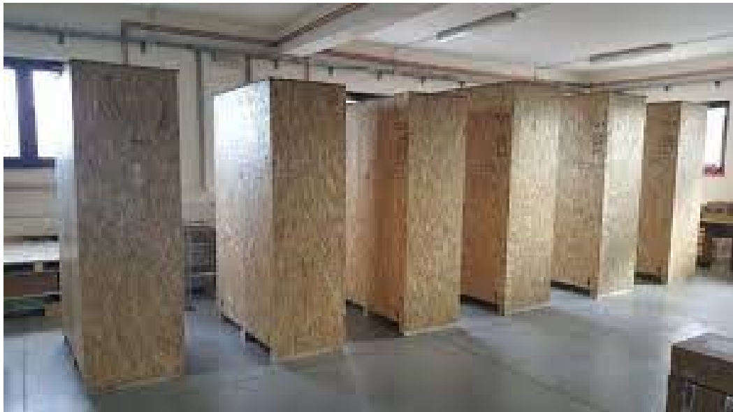
Slika 3. Sanduci za brodski transport

brodu odvajaju jedna od druge na način da se zadnji sloj drveta jedne partije oboja vodenom bojom. Kvalitetno drvo pakira se oblogama od papira ili hasure. Kako bi se teret mogao bezbrižno složiti u što kraćem vremenu potrebno je izvesti pripremne radove. Skladišta se moraju očistiti te treba ukloniti ostatke prijašnjeg tereta. Nakon pranja morskom vodom može doći do stvaranja vlage te je s toga potrebno skladišta prati slatkom vodom. Da bi se skladište potpuno osušilo potrebno je otprilike 12 do 24 sata. Zbog iskrcavanja nekih specifičnih tereta, može doći do neugodnih mirisa te se zbog toga nakon sušenja skladište mora poprskati vapnenom vodom. Jedna od važnijih stavki prije krcanja novog tereta je kontrola protupožarnih uređaja u skladištima.