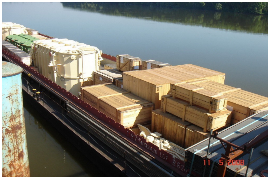
Slika 7. Prijevoz kombiniranog tereta