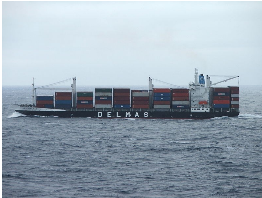
Slika 13. Prijevoz tereta LO – LO brodom „Flora Delmas“