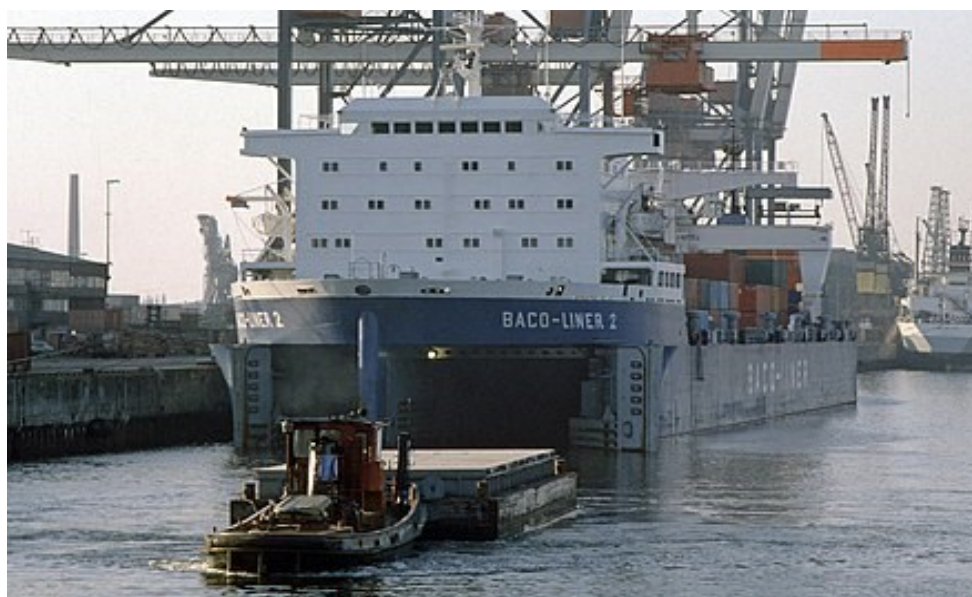
Slika 15. BACAT brod