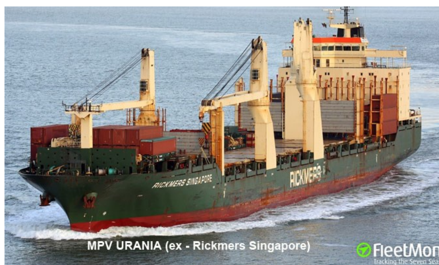
Slika 2. Brod za prijevoz generalnog tereta

Brod namijenjen prijevozu generalnog tereta osnovno je plovilo koje može prevoziti pakiranu i paletiziranu robu. Pri usporedbi generalnog i zbirnog tereta, razlika je u tome što se generalni teret može pojedinačno prevoziti. U generalni teret može se svrstati teret koji se sastoji od robe koja se čuva u kutijama, odnosno tereti koji se mogu prevoziti u spremnicima kao primjerice tehnološka oprema, kućanski aparati, predmeti od plastike, odjeća, namještaj. Brodovi za generalni teret se u današnje vrijeme ne koriste učestalo, osim ako se radi o kraćim putovanjima. Kroz povijest brodovi za prijevoz generalnog tereta su posjedovali specifičan izgled: dizalice za iskrcaj te ukrcaj tereta, stroj na sredini broda, te razne samarice. Samarice su se uglavnom koristile za prekrcaj generalnog tereta, no kako se u današnje vrijeme takav teret počeo pakirati u spremnike – kontejnere, tako se i ovaj sustav prestao koristiti.