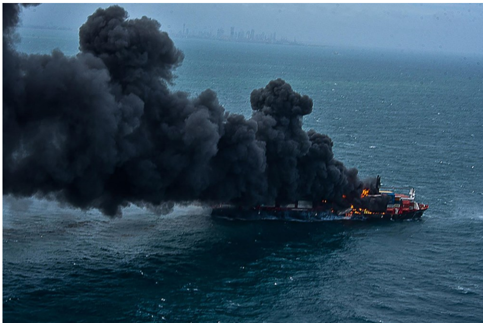
Slika 17. Požar na kontejnerskom brodu