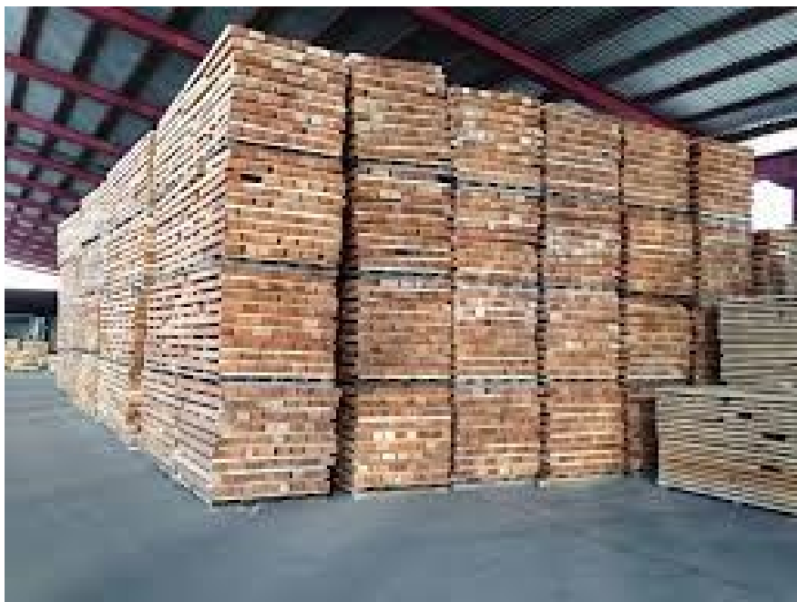
Slika 4. Ukrcaj drva na brod