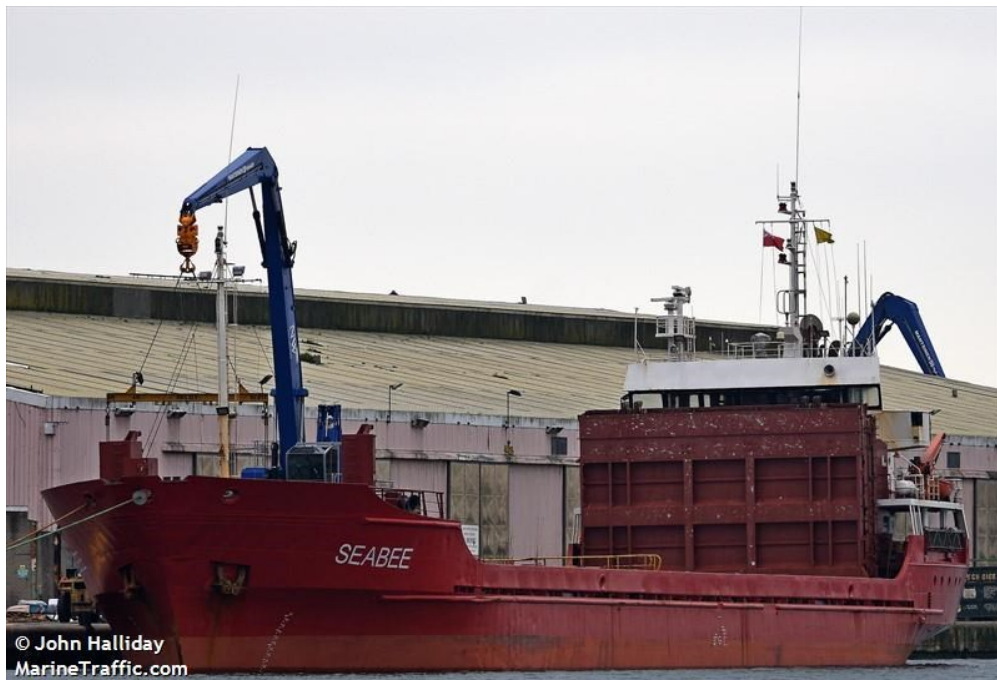
Slika 14. SEA BEE brod