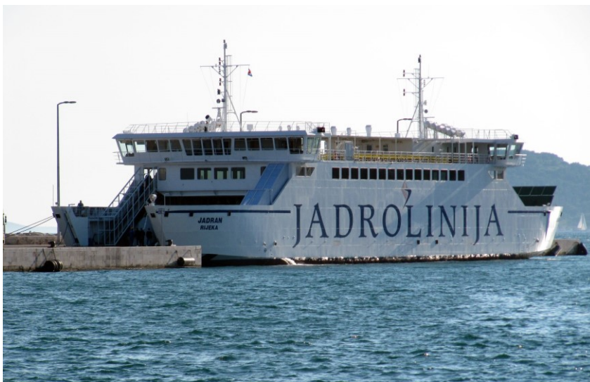
Slika 1 RO - RO putnički brod za srednje udaljenosti

plovidbe na kratke udaljenosti od svega nekoliko nautičkih milja, te imaju kapacitet od oko 80 vozila i oko 400-600 putnika. RO-RO brodovi za srednje udaljenosti do 50 nautičkih milja, prilagođeni su za plovidbe u trajanju od svega 15 do 60 minuta. Kapacitet im nadilazi brojku od 80 vozila i 600 putnika. RO-RO brodovi za najveće udaljenosti više od 50 nautičkih milja se ponajviše izgrađuju za definirane relacije o čemu im ovise i obilježja tokom izgradnje te način gradnje. Prijevozni kapacitet ovakvih brodova je najveći, a dostiže čak 1400 vozila i više od 2000 putnika. 20