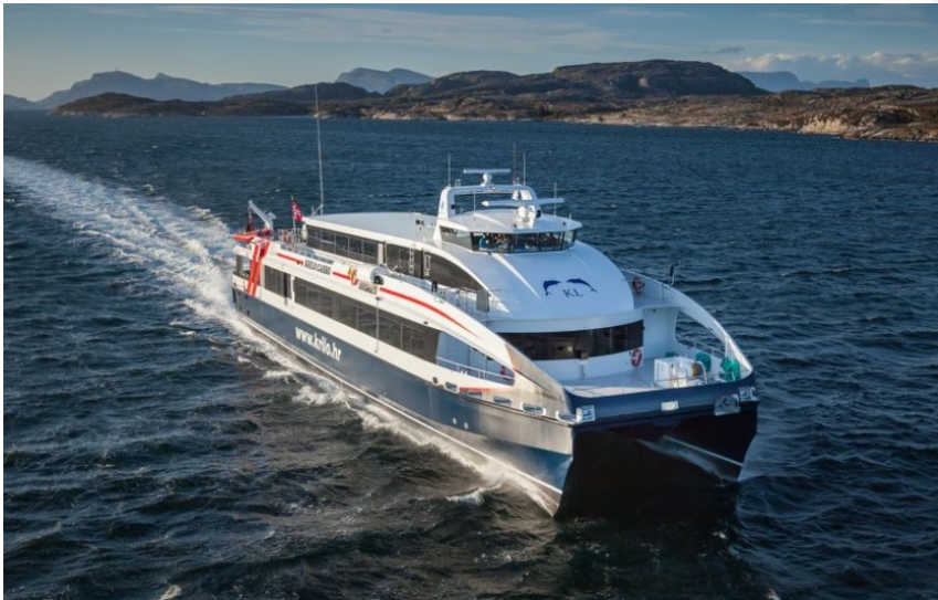
Slika 2 Putnički brod velikih brzina (katamaran)

odgovaraju na kapacitetne potrebe prijevoza putnika i vozila u Hrvatskoj, predviđanja za izgradnju velikog broja putničkih brodova velikih brzina moguća su jedino u vidu zamjene klasičnih brodova i to jedino pod uvjetima smanjivanja nabavne cijene i potrošnje goriva 22 . Bitno je za istaknuti da su putnički RO/RO brodovi uz mostove jedini način prijevoza svih roba teretnim vozilima na ruti kopno-otoci i obrnuto, 23 što povratno govori o neophodnosti postojanja linijskog pomorskog prometa za razvoj i funkcioniranje.