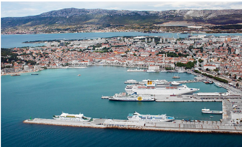
Slika 3 Luka Split

Svaka od navedenih luka ima linije koje povezuju kopno sa otocima. U luci Rijeka i luci Ploče najveći postotak prometa odnosi se na prijevoz tereta, dok su dalmatinske luke posvećene putničkom prometu i turizmu koji je vrlo važan segment pomorskog prometa.