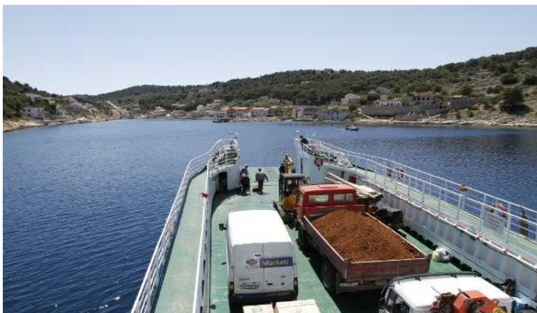
Slika 6 Prijevoz građevinskog materijala

proizvoda, vodiči po otoku, degustacije hrane i pića i time se se povećava zarada i postoji veća šansa za proširivanje poslovanja, te na kraju i ponude koja ponovno privlači posjetitelje.