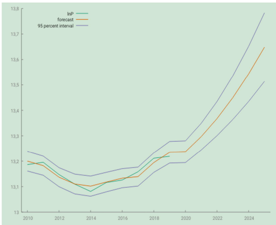
Grafikon 1. Stvarne i predviđene vrijednosti prometa sjevernojadranskih luka u razdoblju od 2010. do 2019., odnosno 2025. godine