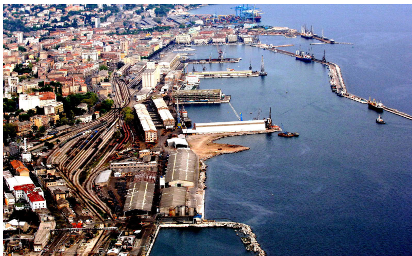
Slika 1. Luka Rijeka