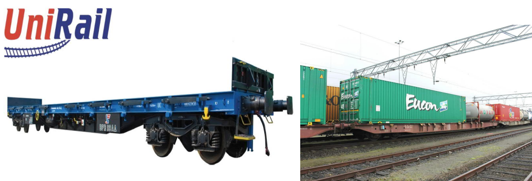
Slika 8. Vlak RGS-Z i SGGNSS serije

Izvor: https://rocky-rail.com/ (02.09.2022.)