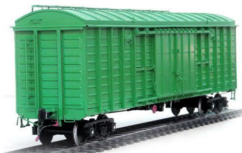
Slika 3. Natkriveni vagon