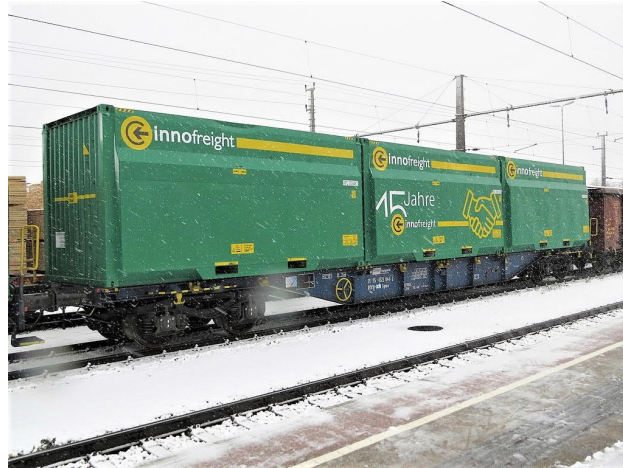
Slika 1. Teretni vagon