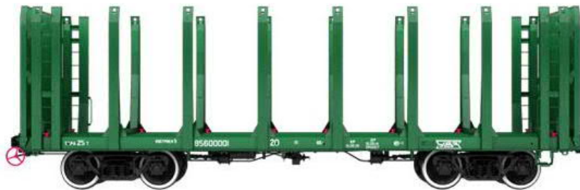
Slika 5. Platforma