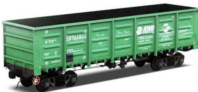
Slika 4. Otvoreni vagon