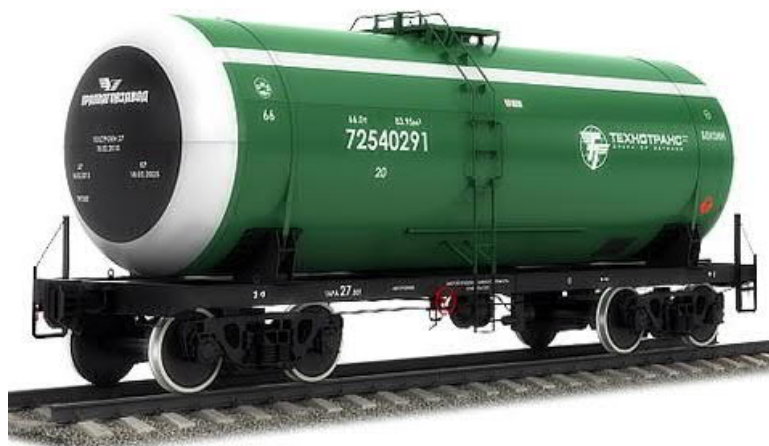
Slika 7. Vagon cisterna