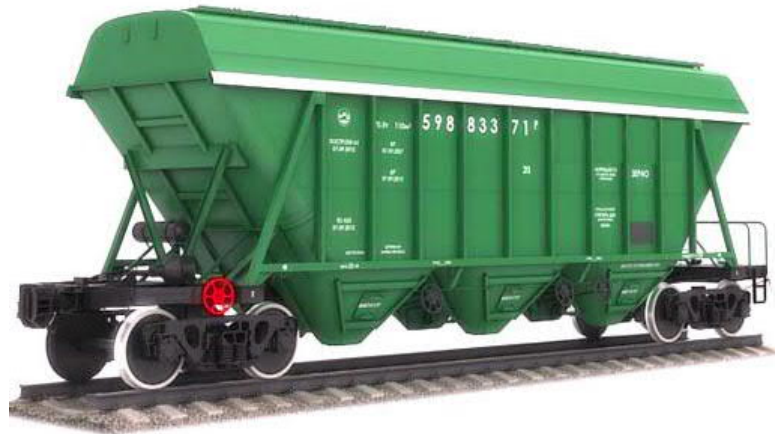
Slika 6. Hopper