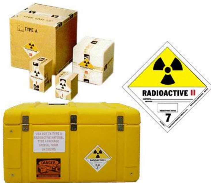
Slika 2. Prikaz pakiranja opasnih tvari

Za većinu zračnih pošiljaka opasne robe potrebna je ambalaža prema UN specifikaciji ili pakiranje usmjereno na učinkovitost (POP). POP 10 je pakiranje koje mora proći nekoliko testova kako bi se osiguralo da su paketi dovoljno čvrsti da izdrže udarce, opterećenja i promjene atmosferskog tlaka s kojima se inače susreću tijekom transporta.