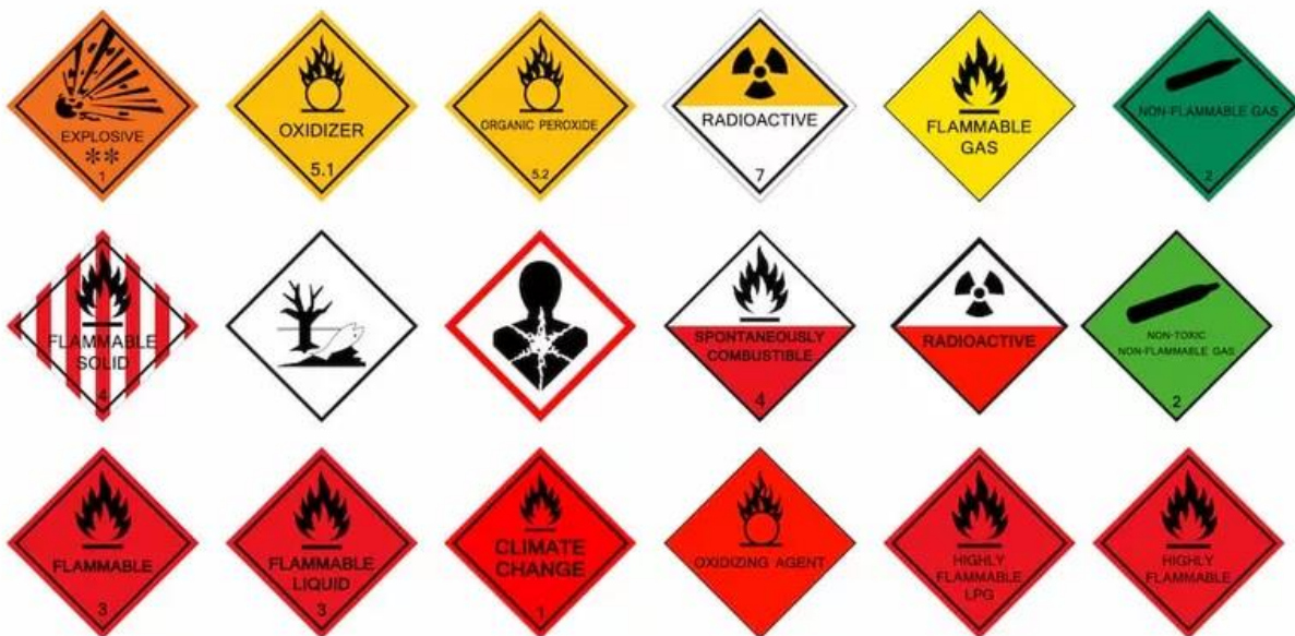
Slika 1. Prikaz oznaka opasnih tvari

Uzimajući u obzir ukupnu količinu tereta, koji se prevozi cestovnim prijevozom u Hrvatskoj, postotak opasnih tvari uključenih u to procjenjuje se na oko 10%. Promet ove vrste podrazumijeva nužnost implementacije inovativnih tehnologija, čija je temeljna zadaća povećanje sigurnosti prometa. Cestovni promet, koji postaje sve popularniji, igra presudnu ulogu.