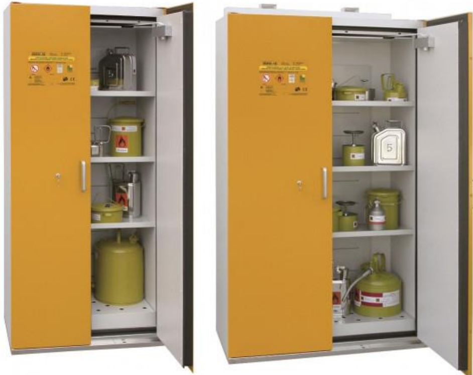
Slika 3. Prikaz ormara za skladištenje opasnih tvari