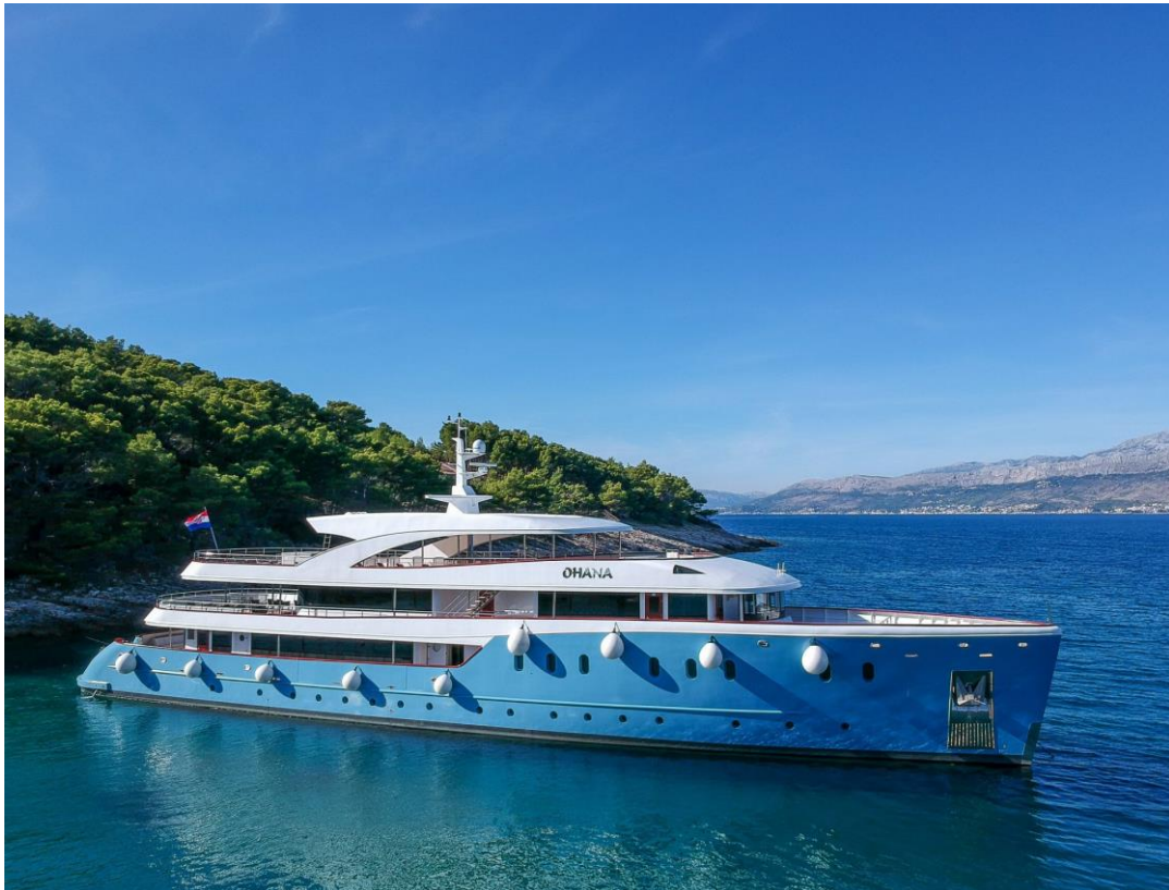
Slika 37: Mini kruzer Ohana

Paluba za sunčanje je opremljena ležaljnkama i jacuzzijem. Mini kruzer Ohana je opremljen s 16 kabina s bračnim krevetom i dvije kabine za tri osobe. Svaka kabina ima privatni toalet s tuš kabinom.