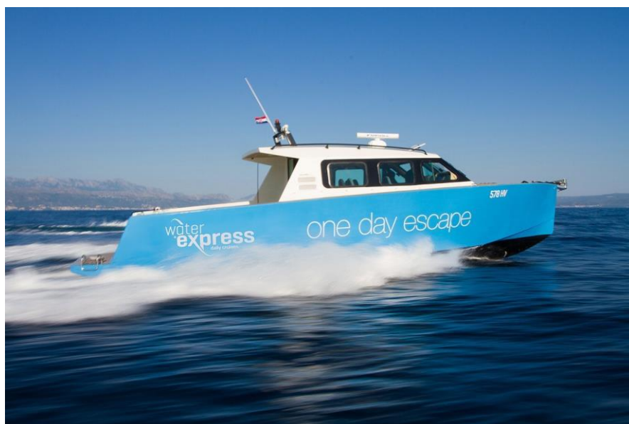
Slika 3: Colnago 40 u plovidbi