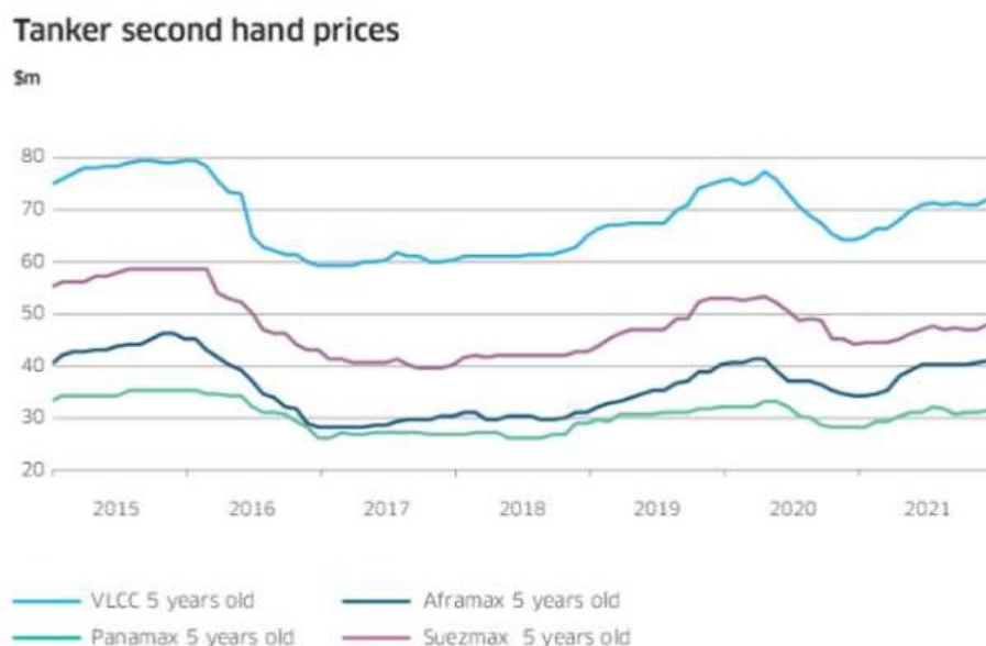
Slika 4. Grafički prikaz kretanja cijena polovnih tankera