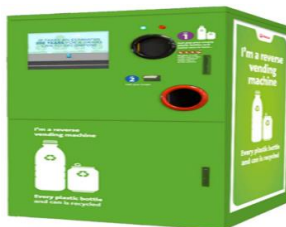
Slika 2. Povratak automatom