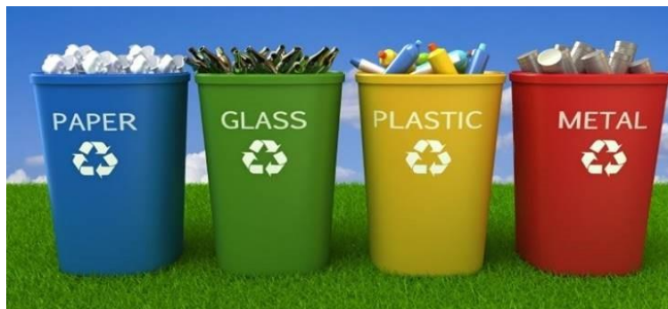
Slika 1. Kontejneri za sakupljanje ambalažiranog otpada