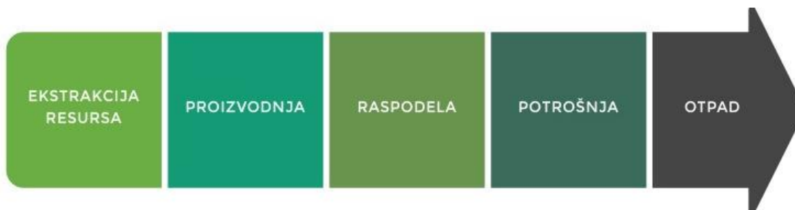
Slika 2. Prikaz linearne ekonomije

Ukoliko bi se promatrao razvoj ekonomije zadnjih stotinjak godina moguće je uvidjeti kako je vladao „jednosmjerni“ model koji se odnosio na proizvodnju te na potrošnju. U navedenom pogledu uočava se kako je roba bila ta koja se proizvodi konkretno od sirovina. Prikaz linearne ekonomije je na sljedećoj slici.