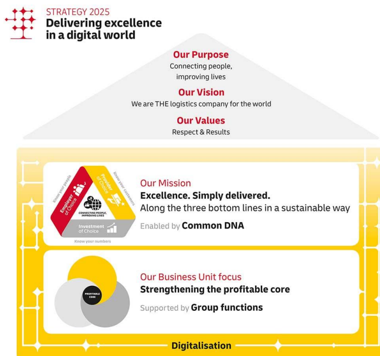
Slika 4. Prikaz strategije 2025

svijetu” tvrtka postavlja temelje za nastavak uspješne putanje rasta i nakon 2020. godine četiri najvažnija trenda koji su posljednjih godina utjecali na logistiku također će oblikovati industriju koja ide naprijed: globalizacija, digitalizacija, e-commerce i održivost. Strategija 2025 je odgovor grupe na ovo. Tvrtka će nadograditi ove trendove kako bi iskoristila potencijal za profitabilni dugoročni rast u svojem osnovnom logističkom poslovanju, istodobno pojačavajući digitalnu transformaciju koja je već u tijeku u cijeloj grupi. Svi su napori usmjereni na utvrđena tri područja strategije 2020., koja je temelj strategije 2025. U skladu s tim, DHL grupa želi u svim svojim aktivnostima smatrati se poslodavcem, pružateljem i investicijom prvog izbora.