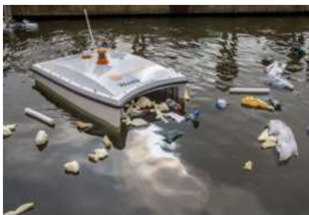
Slika 9. WasteShark A

Prvi svjetski autonomni robot za čišćenje otpada koji je ikada postavljen za rješavanje problema plastičnog onečišćenja u lukama, kanalima, marinama i unutarnjim vodama (slika 9).