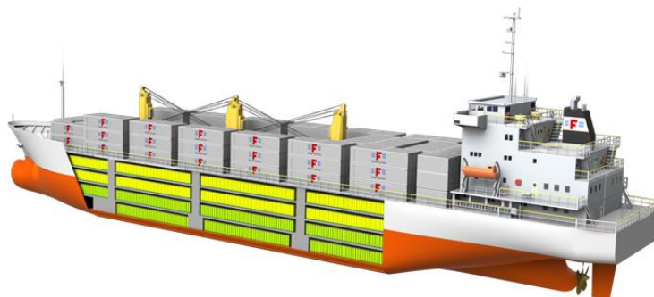
Slika 3. Prikaz broda hladnjače

( https://www.worldcargonews.com/in-depth/in-depth/zespris-dual-strategy-for-reefers )