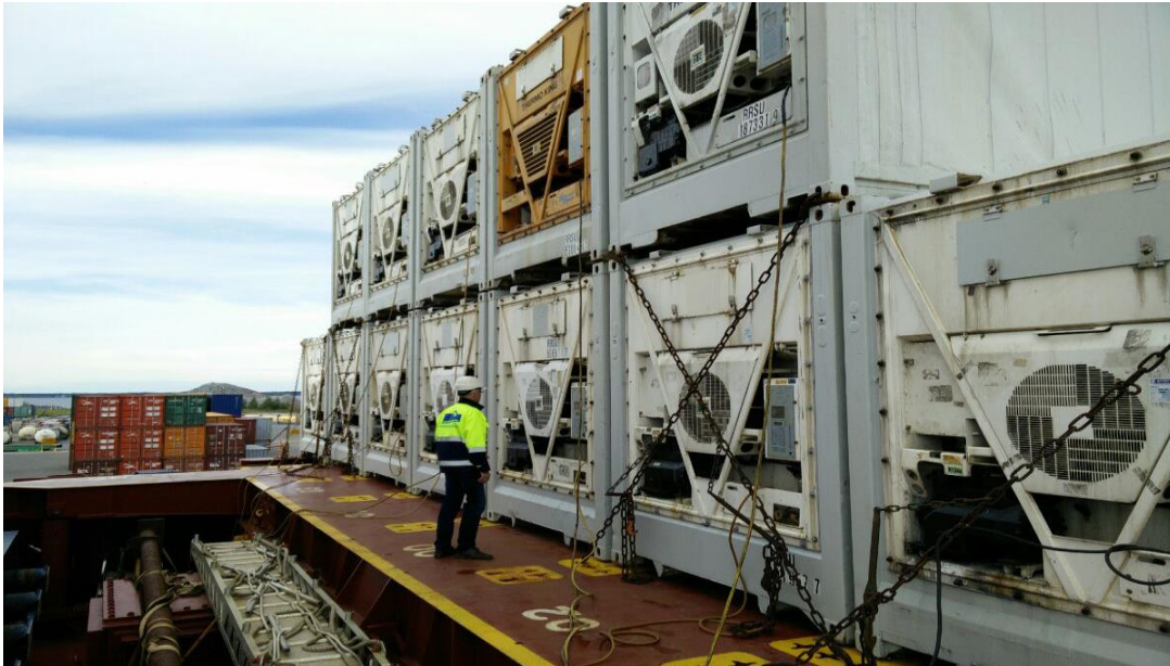
Slika 5. Prikaz rashladnih kontejnera na kontejnerskom brodu

Economizer). Moderniji rashladni kontejneri su opremljeni pothlađivačem kako bi se povećao rashladni učinak.