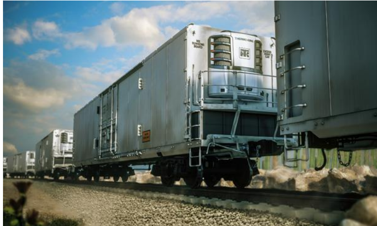
Slika 6. Prikaz rashladnih vagona