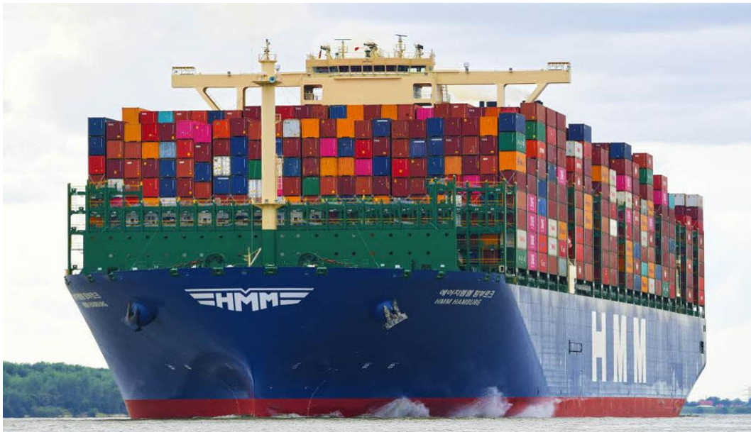
Slika 4. HMM 24000TEU Class

potrebno provjeravati rade li ispravno. Također, jedan od glavnih dijelova može otkazati, koji se tada treba zamijeniti ili isključiti. Moderni brodovi za rashladne kontejnere dizajnirani su tako da uključuju sustav vodenog hlađenja za kontejnere smještene ispod palube, što ne zamjenjuje rashladni sustav nego olakšava odvođenje topline sa uređaja rashladne jedinice. Kontejneri smješteni na izloženoj gornjoj palubi hlađeni su zrakom. Dizajn vodenog hlađenja omogućuje dodatne rashladne spremnike ispod palube, budući da se voda može koristiti za raspršivanje velike količine topline koju stvaraju. Takav sustav crpi svježju vodu iz broskog sustava slatke rashladne vode, te zauzvrat prenosi toplinu kroz izmjenjivače topline na morsku vodu koja je ujedno i glavni medij rashlade na brodu.