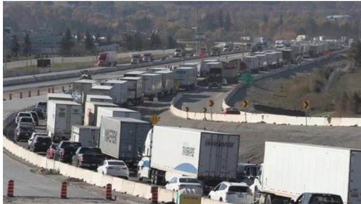
Slika 9. Simboličan prikaz cestovnog transporta