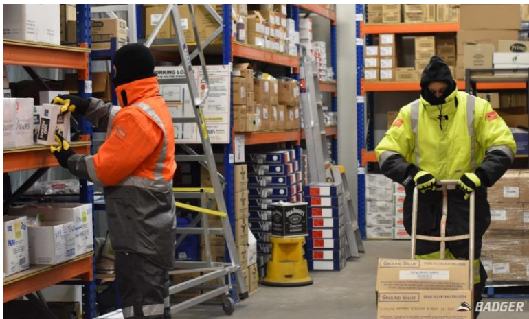
Slika 7. Hladne komore - hladnjače

Skladišne hladnjače prizemne su konstrukcije te uzrokuju manje investicije prilikom izgradnje, međutim pogonski troškovi eksploatacije u odnosu na višekratne hladnjače su manji.