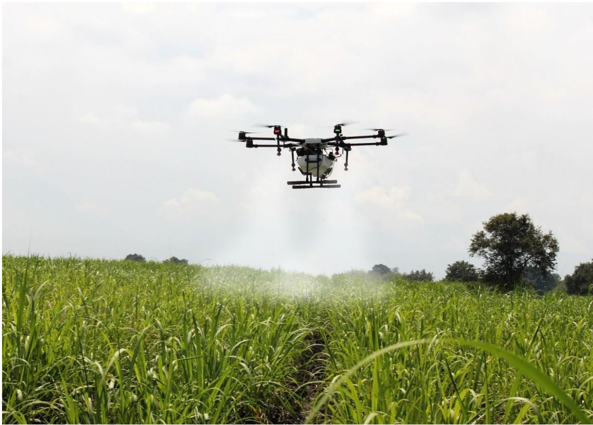
Table 9 Prskanje poljoprivrednih nasada