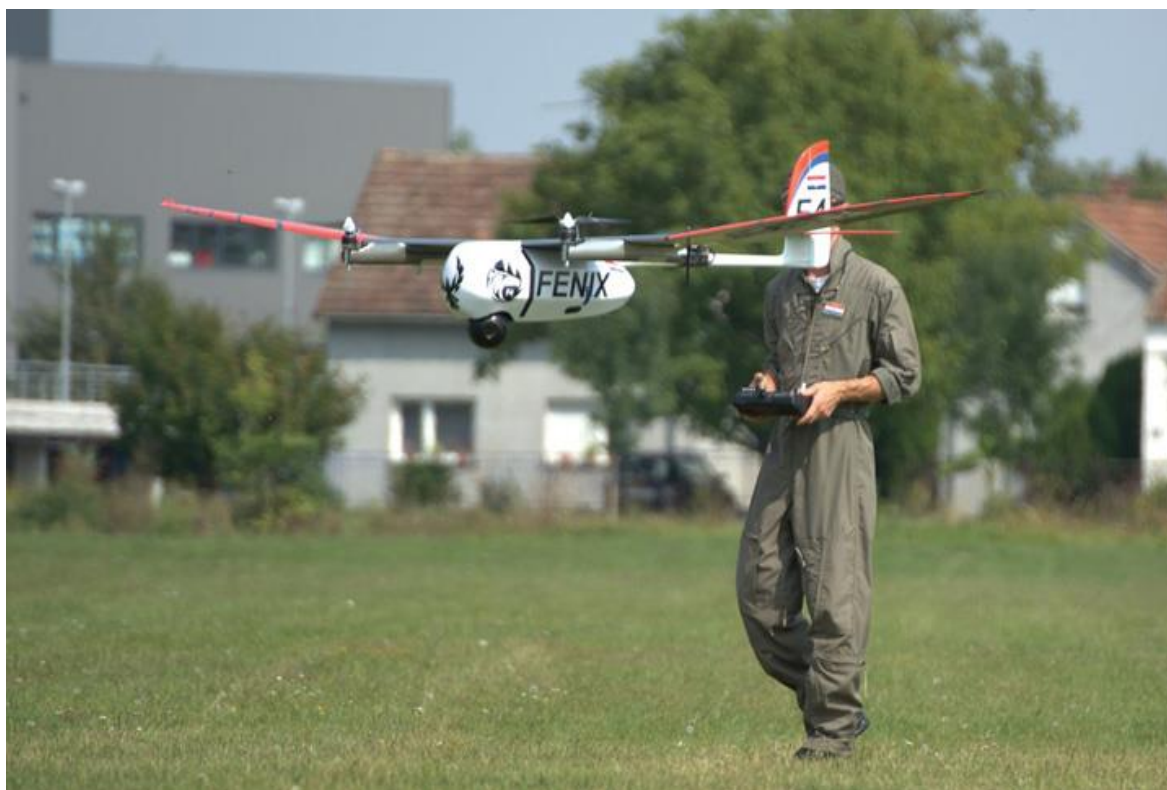
Table 6 Hrvatski vojni dron Fenix

Prve su bespilotne letjelice konstruirane u doba između dvaju svjetskih ratova. Uglavnom su to bili vojni zrakoplovi dodatno opremljeni upravljačkim uređajem s giroskopom ili radijskim uređajem za daljinsko vođenje, a rabili su se kao zračne mete za vježbovna gađanja ili kao zračna torpeda. Tijekom II. svj. rata razvijene su krilate bespilotne letjelice opremljene mlaznim motorima i giroskopskim navođenjem (njemačke leteće bombe V-1), kao preteče suvremenih krstarećih projektila. Tijekom hladnoga rata počele su se razvijati bespilotne letjelice za špijuniranje i nadzor protivničkoga teritorija.