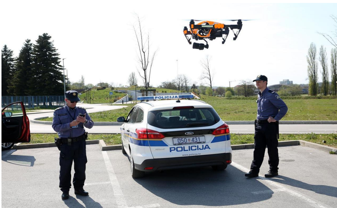
Table 3 dron u upotrebi Policije