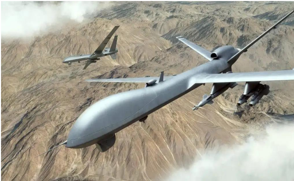
Table 1. Vojni dron