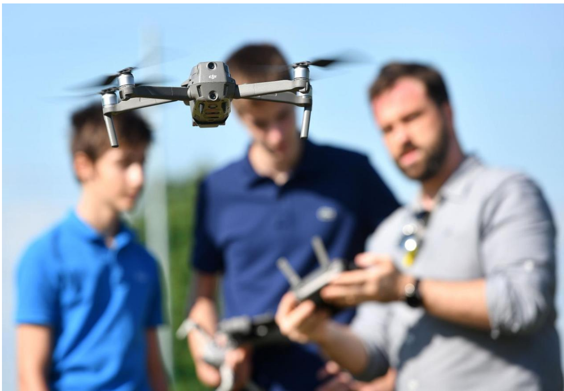
Table 5 polaganje za upravljanje dronom