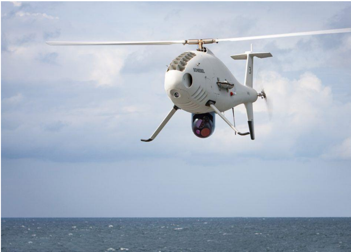
Table 10 Dron za nadzor Jadranskog mora