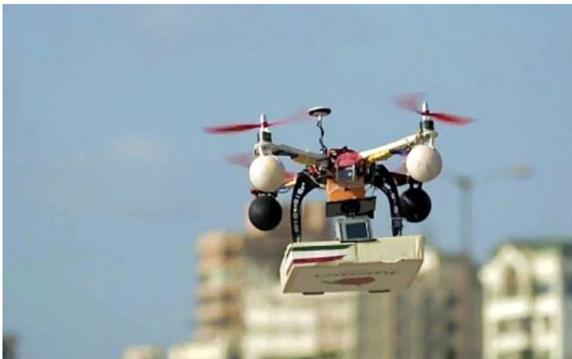
Table 8 Dronovi za dostave paketa

U primjeni su i kod katastarskih poslovanja, geometrije i snimanja terena i katastarskih čestica, u vatrogastvu za snimanje veličine površine zahvaćene požarom. U mup-u za nadziranje granica država te mnoge druge funkcije u raznim granama. Primjena im je stvarno u velikoj količini, naprave su same po sebi skupe i još uvijek teško dostupne za primjenu.