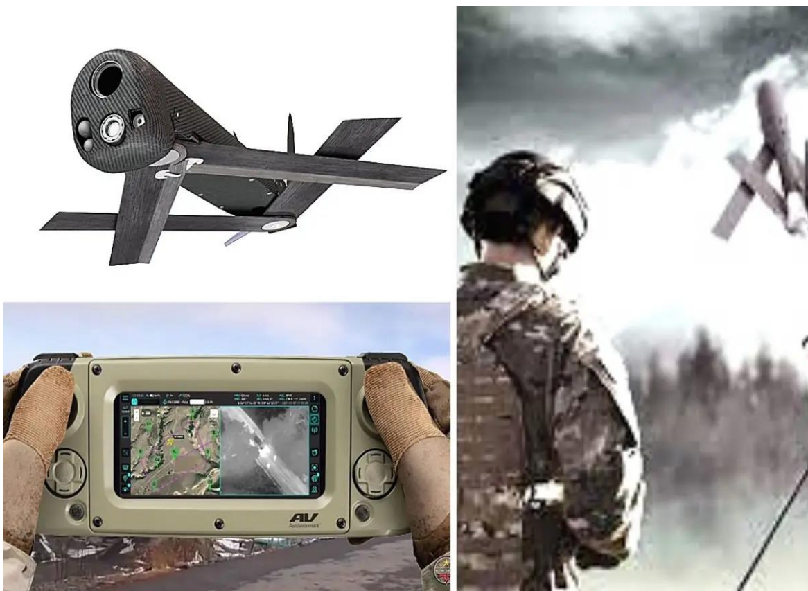
Table 4 Daljinsko upravljane dronom u vojne svrhe