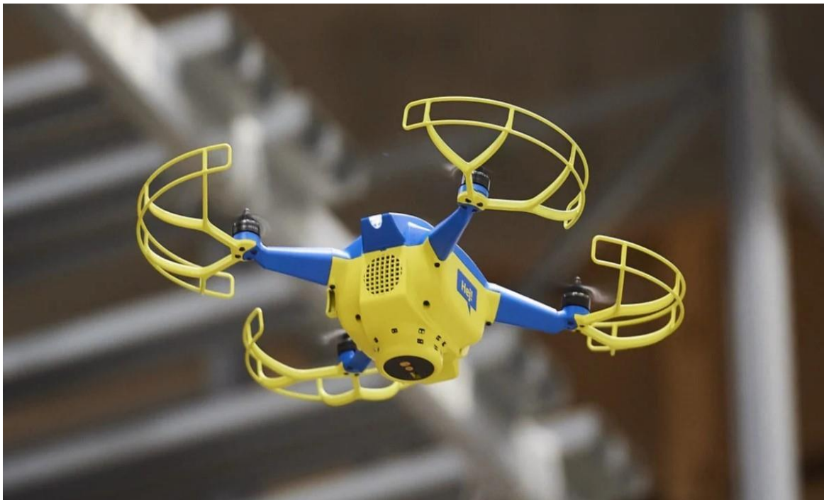
Table 11 IKEA dron u skladišnom prostoru

U slučaju da se primjeti neovlašteno izvođenje letačkih operacija dronovima, potrebno je odmah prijaviti Hrvatskoj agenciji za civilno zrakoplovstvo. Za sve bespilotne zrakoplove mase veće od 900 g obavezna je uspostava AD HOC strukture zračnog prostora prije izvođenja letačkih operacija.