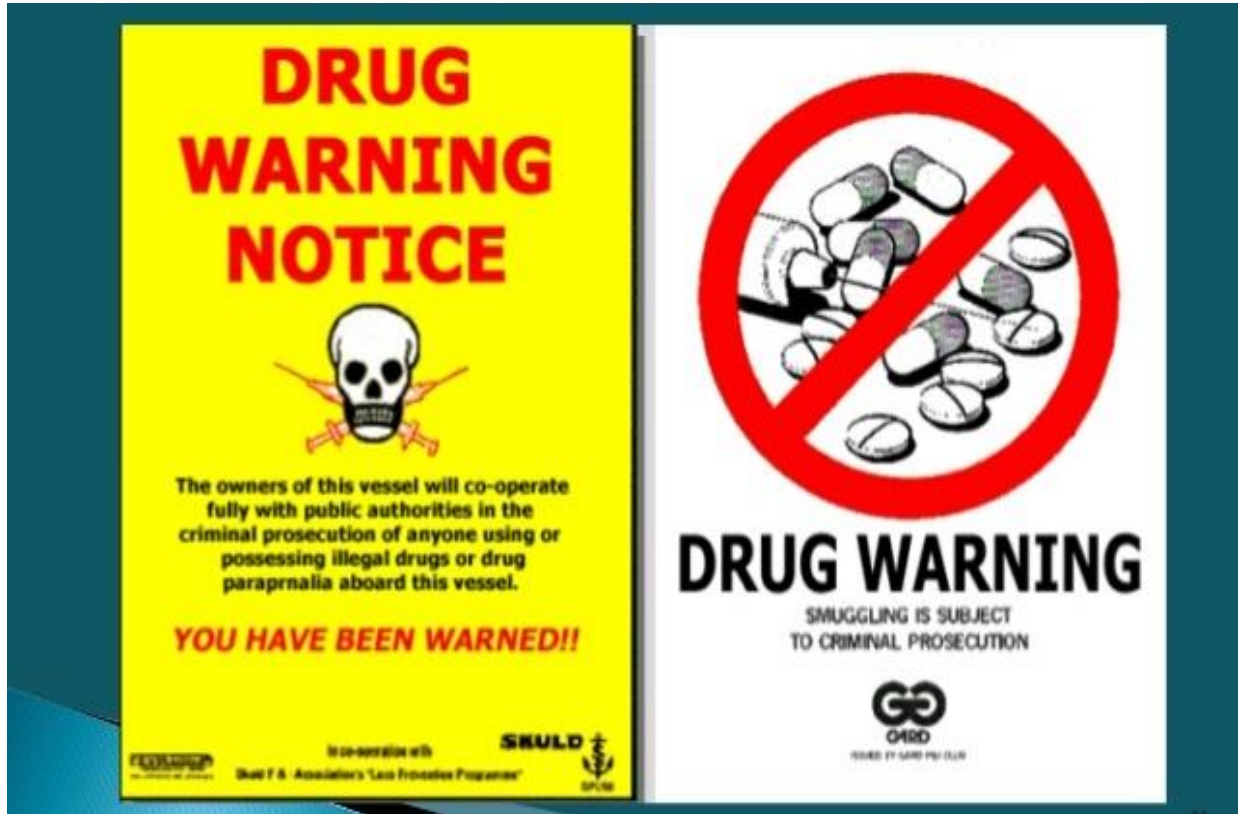
Slika 2. Primjer plakata vezanog za zabranu krijumčarenja droge