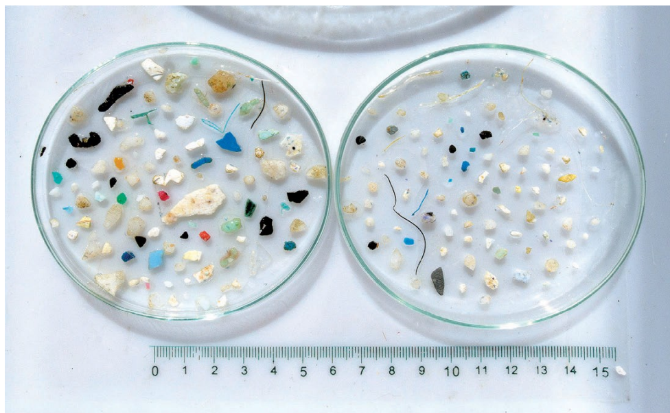
Slika 8. Uzorak mikroplastike uzet sa velikog tihooceanskog otoka smeća na 34°42'210 S - 142°21'004 Z, [22]