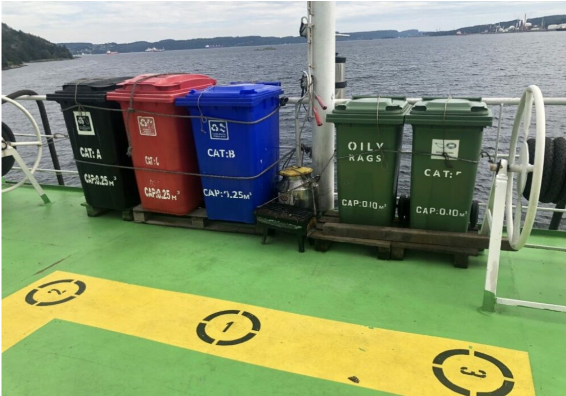
Slika 4. Sakupljanje smeća na brodu, [11]