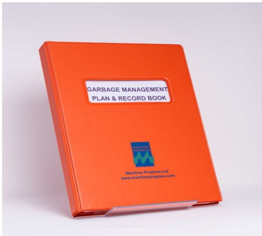
Slika 1. Plan upravljanja smećem, [8]

Svaki brod od 100 bruto tona više, te svaki brod koji je ovlašten prevoziti 15 i više osoba, fiksne ili plutajuće platforme obavezni su koristiti „Plan upravljanja smećem“ (engl. Garbage Management Plan - GMP) kojega se posada treba pridržavati. Plan upravljanja smećem osigurava procedure za minimiziranje, sakupljanje, skladištenje, procesuiranje i odlaganje smeća koristeći se opremom na brodu. U njemu se jasno nalaže osoba koja je zadužena za pravilnu provedbu plana. Takav plan trebao bi koristiti smjernice prema rezoluciji MEPC.220(63)) i biti napisan na radnom jeziku posade broda, [7].