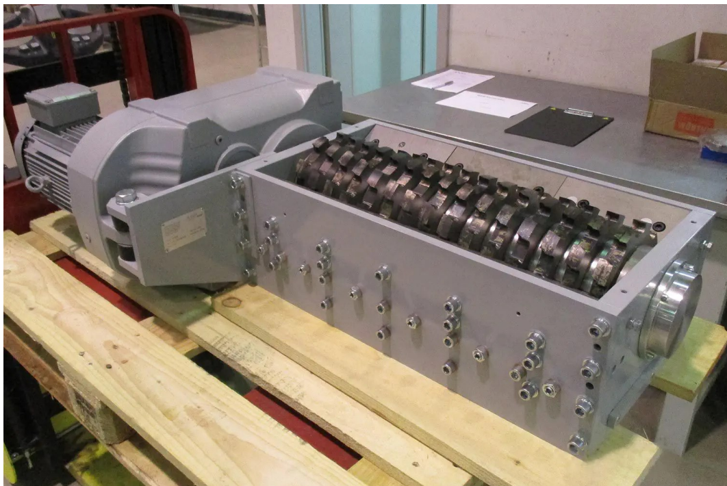
Slika 6. Kominutor, [13]