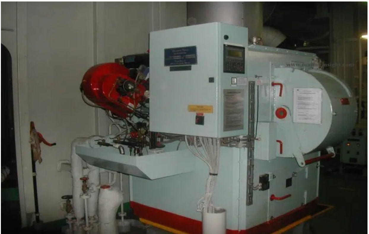
Slika 7. Incinerator, [17]

Krutim otpadcima potrebno je od 30 do 90 minuta kako bi u potpunosti izgorili, dok je tekućim otpadcima potrebno svega nekoliko sekundi. Zbog iznimno visokih temperatura mnogi štetni plinovi bivaju uništeni. No, oni koji ipak ostanu u komori odlaze u sekundarnu komoru za izgaranje na daljnje zagrijavanje i uništavanje. Nastali plinovi prolaze kroz opremu za kontrolu onečišćenja zraka koja uklanja sitne čestice i kisele plinove poput sumpornog dioksida koji je vrlo korozivan, [16].