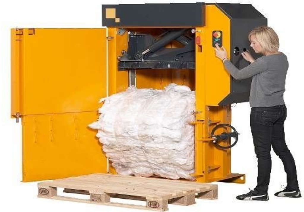
Slika 5. Kompaktor, [12]