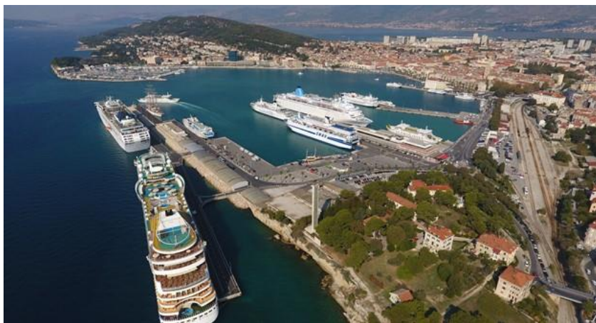
Slika 4. Panorama luke u Splitu