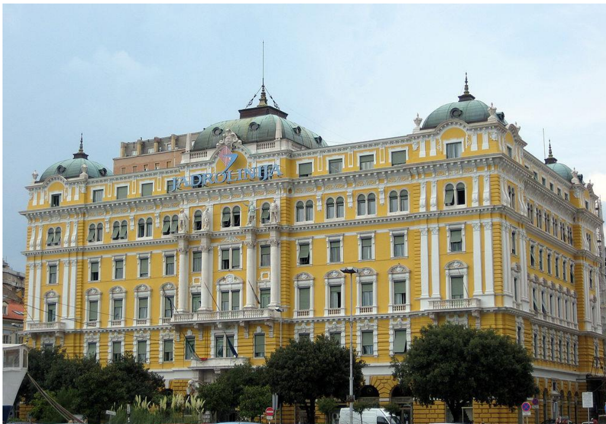
Slika 5. Palača Jadran u kojoj je sjedište Jadrolinije