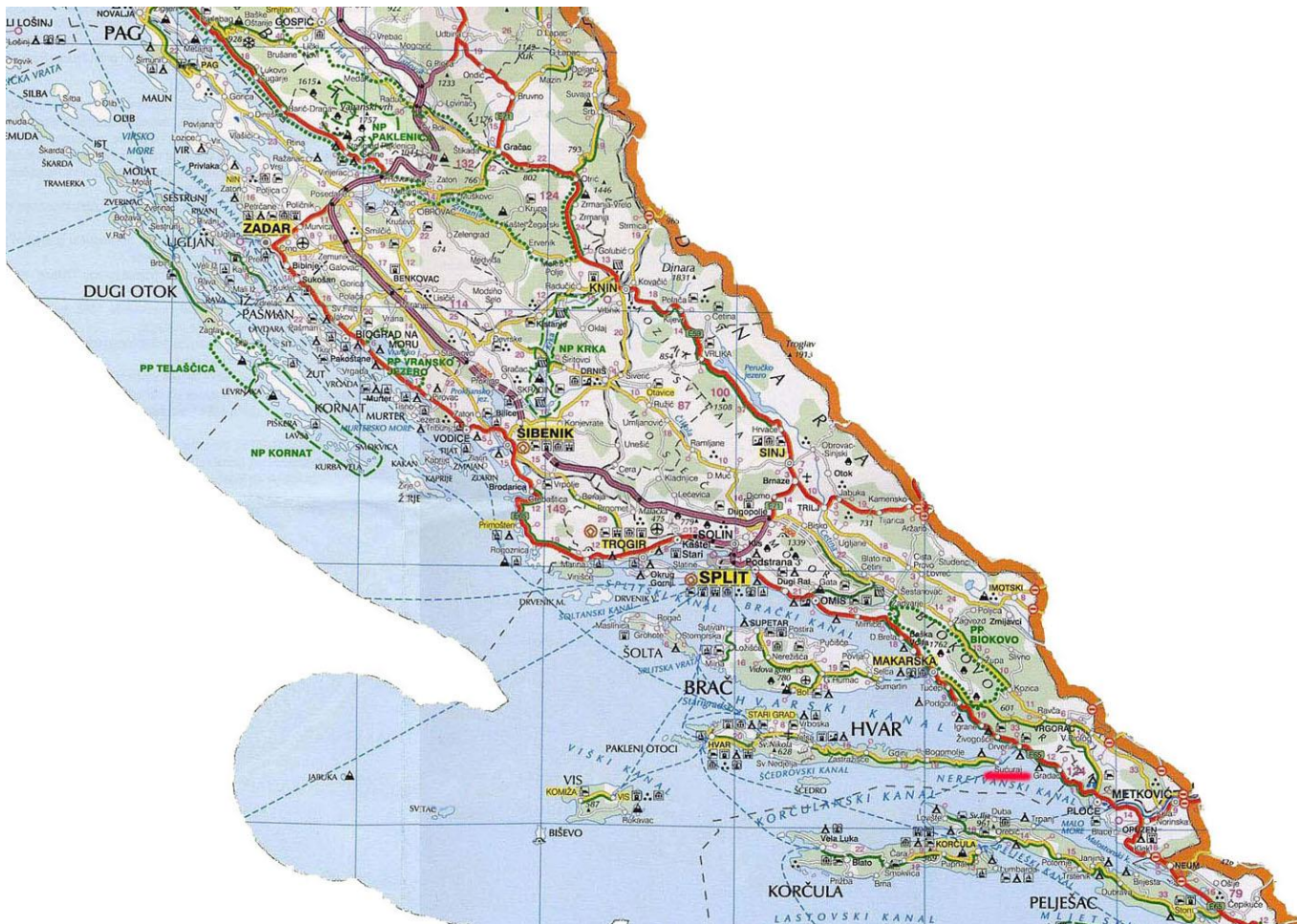
Slika 2. Razvedenost Zadarskog arhipelaga sa najvećim brojem otoka